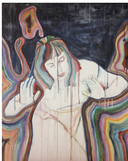
Ulla von Brandenburg, Jacqueline , 2017 aquarelle sur gesso et bois, 140 x 110 cm watercolor on gesso and wood, 55 1/8 x 43 1/4 in.

Ces images sont destinées uniquement à la promotion de l'exposition d'Ulla von Brandenburg, Two Times Seven , présentée à la galerie Art:Concept, Paris du 8 avril au 13 mai 2017. Elles ne peuvent être recadrées ou modifiées. Merci de bien mentionner les crédits suivants : courtesy Ulla von Brandenburg et Art:Concept, Paris