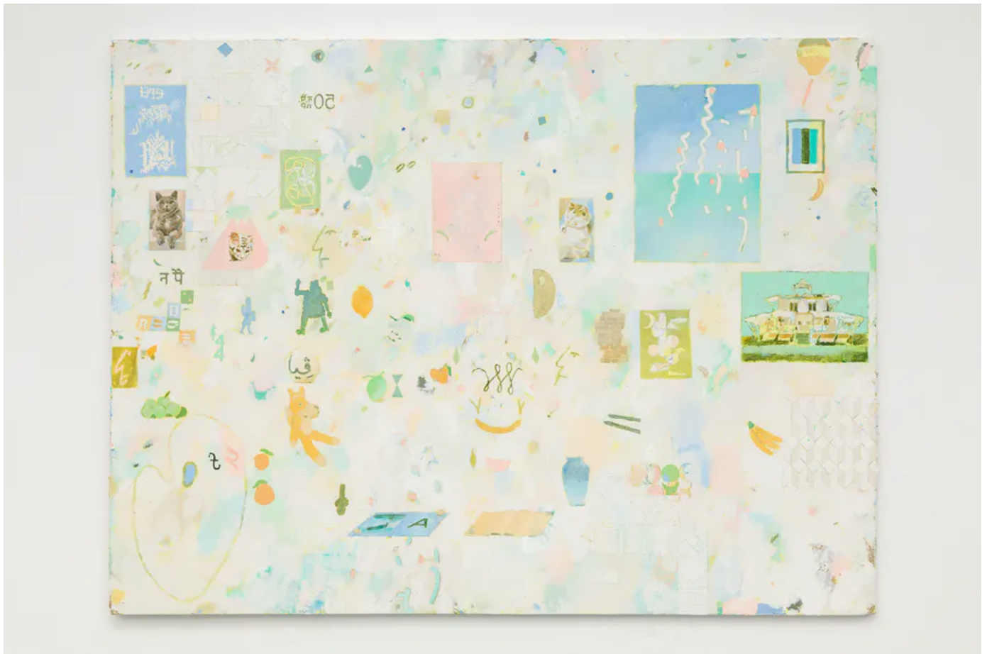
Pierre. Bellot, L'Atelier intérieur , huile sur toile, 150 x 200 cm.

Pierre Bellot est diplômé de l'École Nationale Supérieure des Beaux-Arts de Paris. Coutumier d'une palette restreinte, travaillant tout en camaïeux et en contrastes, il redéfinit les formes par la couleur pure, à l'instar de Matisse. Il travaille à partir de photographies ou d'archives personnelles glanées au fil des expériences, et leur donne une nouvelle direction. L'exposition est l'occasion de découvrir ce travail de réappropriation personnelle et créative.