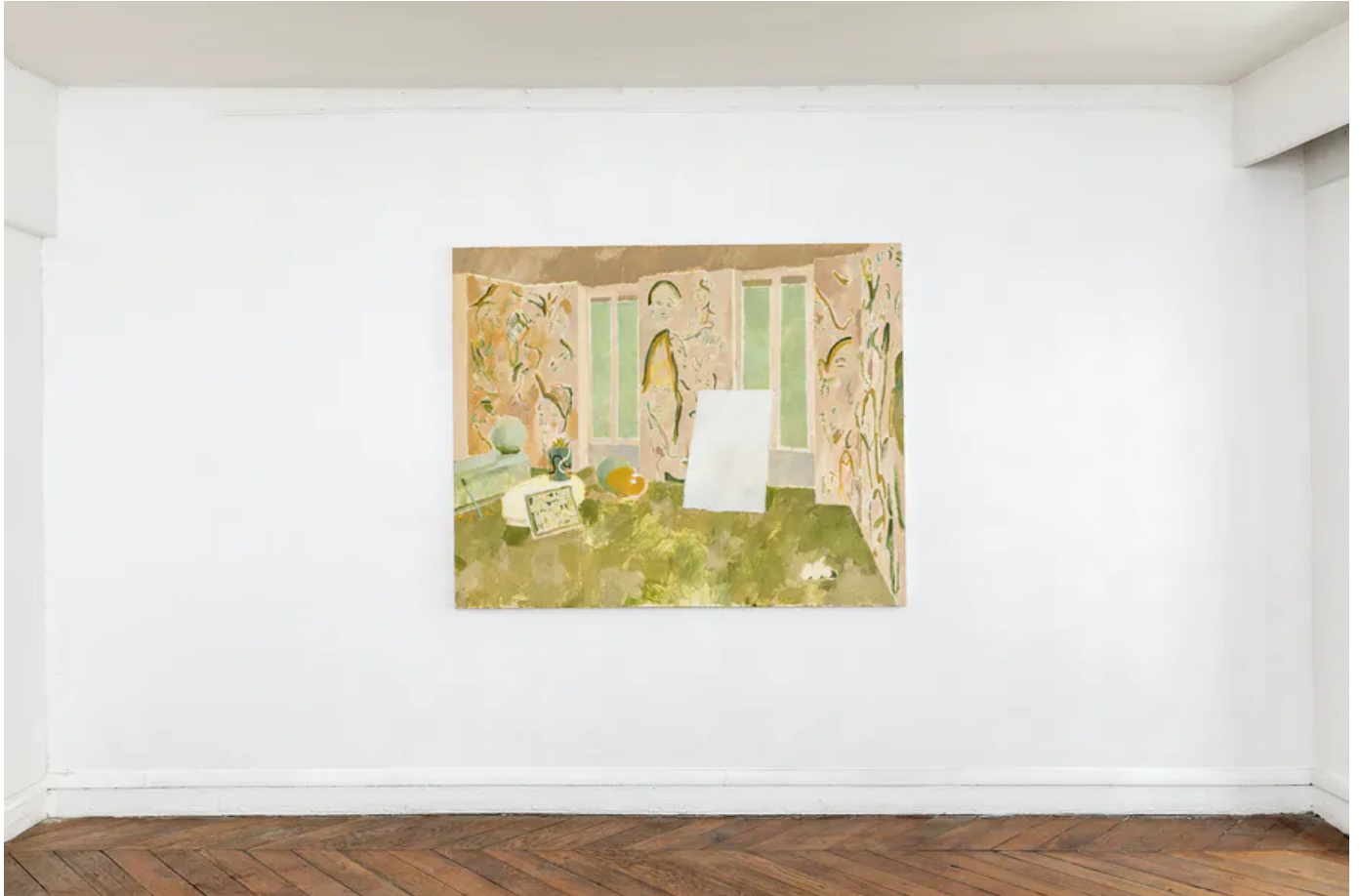
Pierre Bellot, Le Salon , 2020, huile sur toile, 130 x 162 cm. Photo © Pierre Bellot / Tajan

Dans Le Salon , on trouve encore une fois la trace de Matisse pour qui on sait combien le motif de la fenêtre a été important. Ici, il semble que la toile blanche et les murs tapissés de visages aient mystérieusement échangé leur rôle.