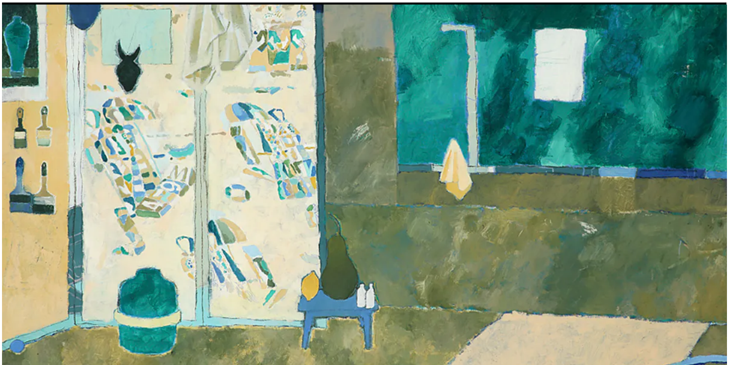
Pierre Bellot, Composition dans l'atelier, 2020, huile sur toile, 82 x 116 cm (détail), Photo © Pierre Bellot / Tajan

Tajan - The Gallery, lieu qui s'engage à soutenir et promouvoir la création artistique sous l'égide de la maison de ventes éponyme, nous offre ici la possibilité de découvrir une autre facette de l'art actuel, avec une exposition consacrée à la