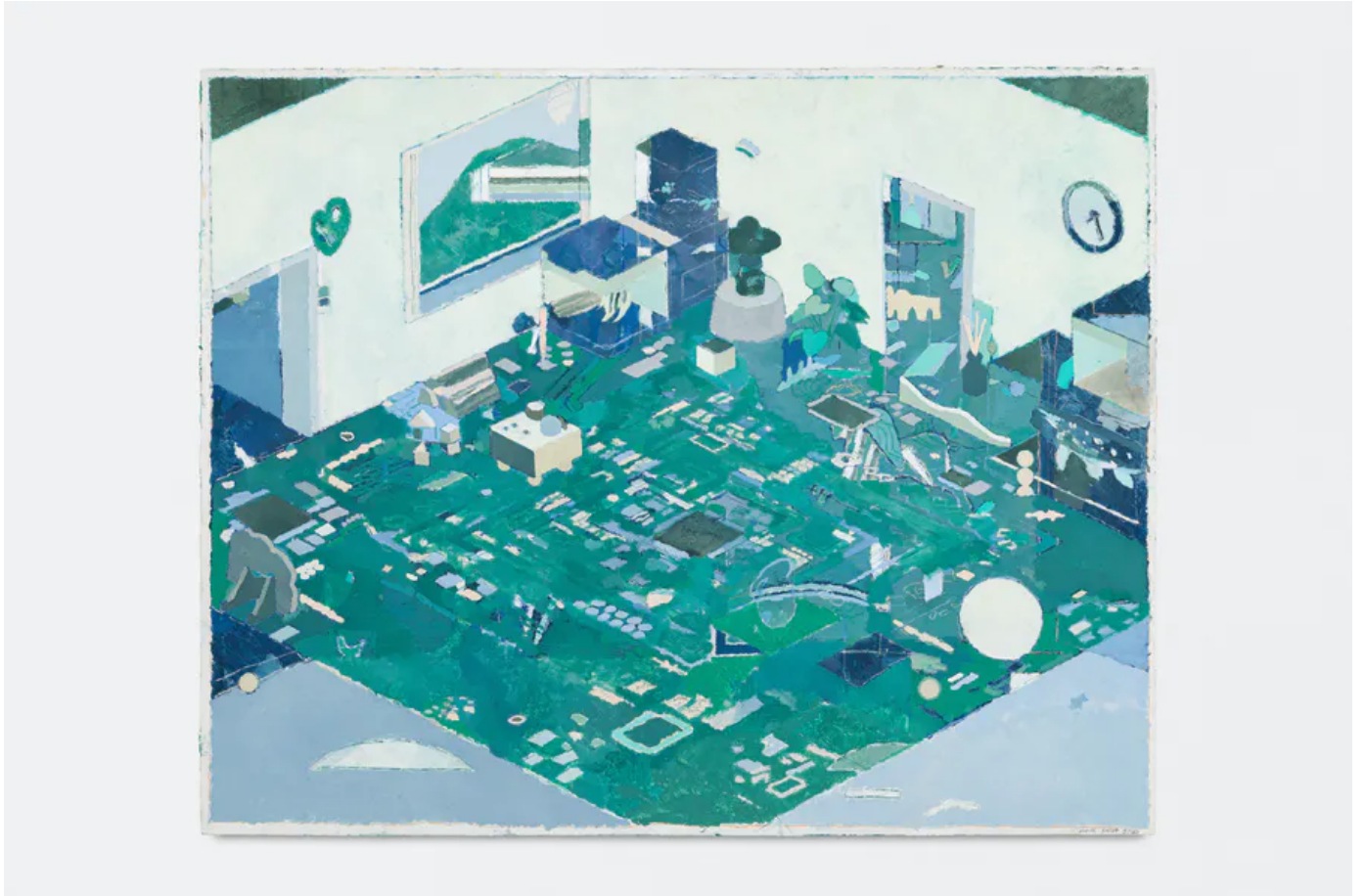
Pierre Bellot, Room, 2020, huile sur toile, 130 x 162 cm.

Room en revanche, est une image plus moderne, comme une modélisation en trois dimensions de l'espace intérieur sur le support bidimensionnel de la toile. Bellot se joue de l'espace et donne cette fois-ci un air de vingt-et-unième siècle aux aplats de couleurs empruntés à Matisse.