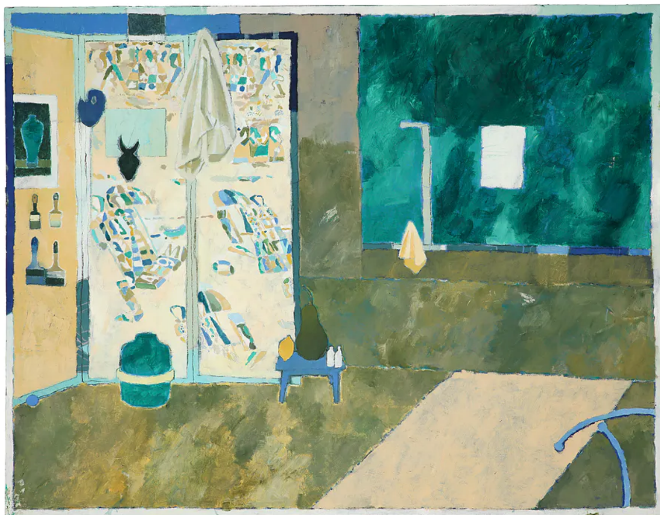
Pierre Bellot, Composition dans l'atelier , 2020, huile sur toile, 82 x 116 cm.

Enfin, dans Composition dans l'atelier , Bellot poursuit dans son univers intérieur, où œuvres achevées et inachevées, inspirations et pinceaux se côtoient. Comme chez Matisse, on sent l'importance de l'atelier pour le peintre.