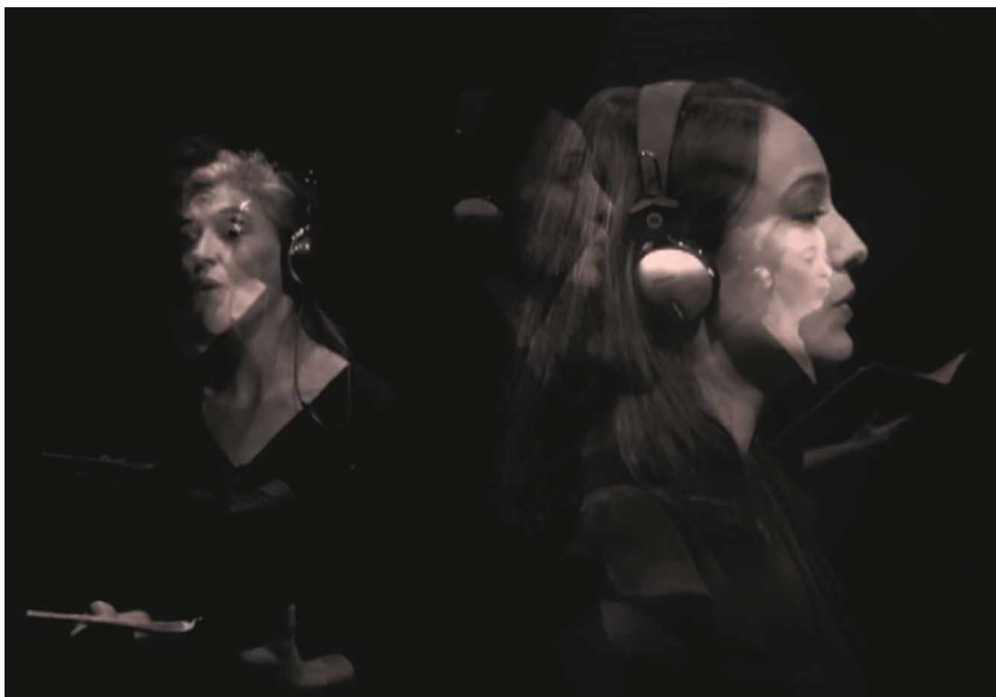
Image extraite de la composition musicale de Jonathan Bell (2019/2020). CASA DE VELAZQUEZ, MADRID 2020

A Paris, que propose l'exposition « Itinérance » et quel est son concept ?