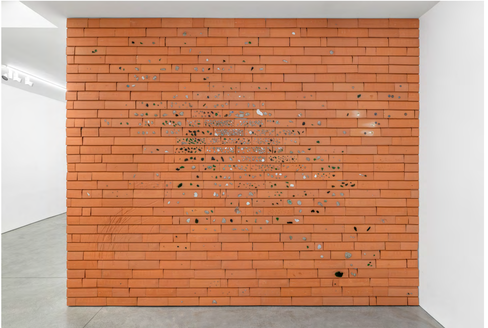
Try doing anything without it , 2022. Briques, pièces de monnaie, verre trouvé (Paris, Texas) / Bricks, coins, found glass (Paris, Texas). 324 x 397 cm. Produit aux / Produced at Rairies Montrieux. Courtesy of the artist and Art : Concept, Paris. Photo Nicolas Brasseur