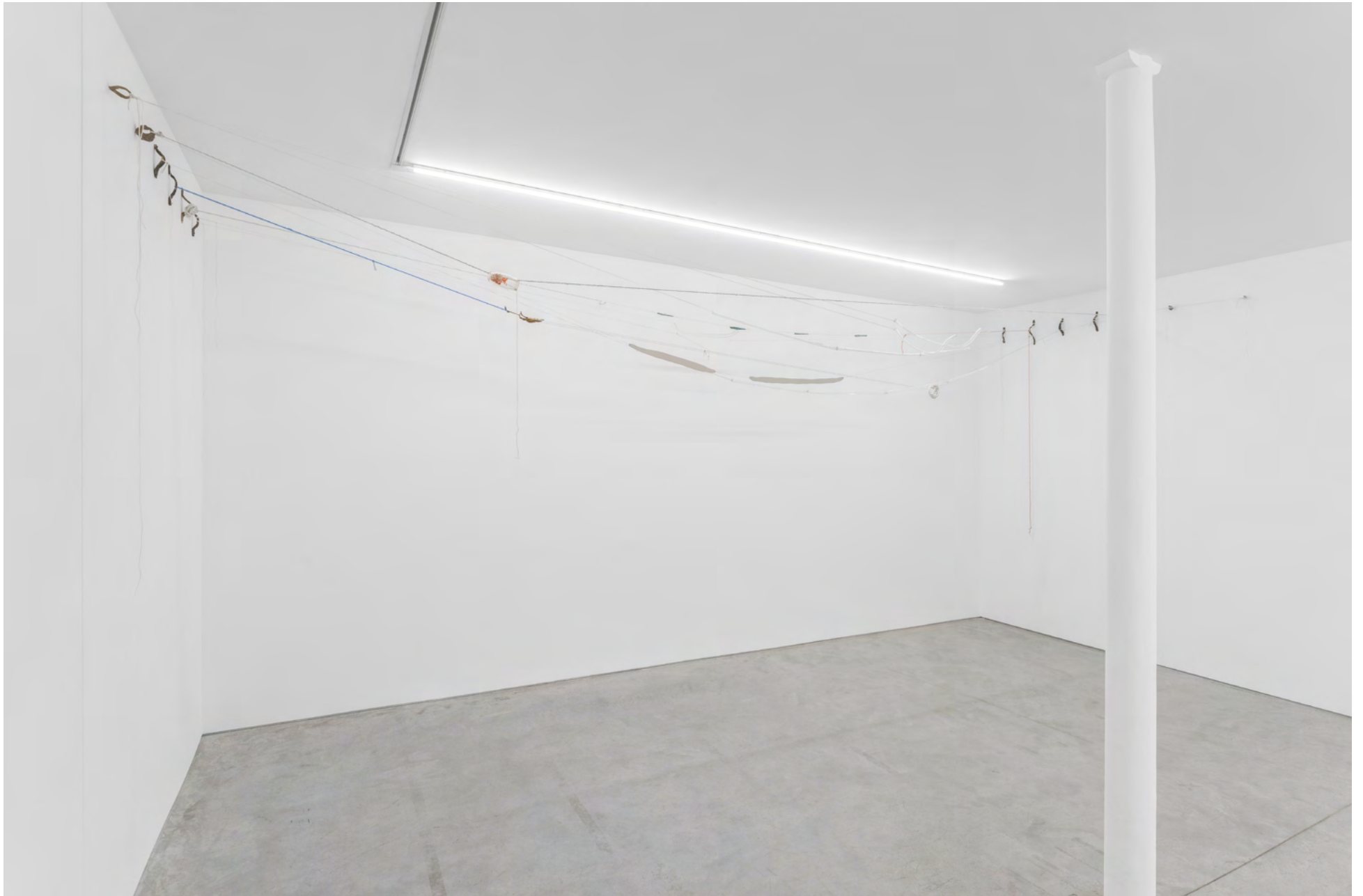
Walking with a lot of people , 2022. Porcelaine de Limoges, verre, ficelle de fouet, corde de laine, fil de fer, jute, ruban, fil, or, bronze / Limoges porcelain, glass, whipping twine, woolen rope, wire, Jute, ribbon, thread, gold, bronze. Dimensions variables. Courtesy of the artist and Art : Concept, Paris. Photo Nicolas Brasseur