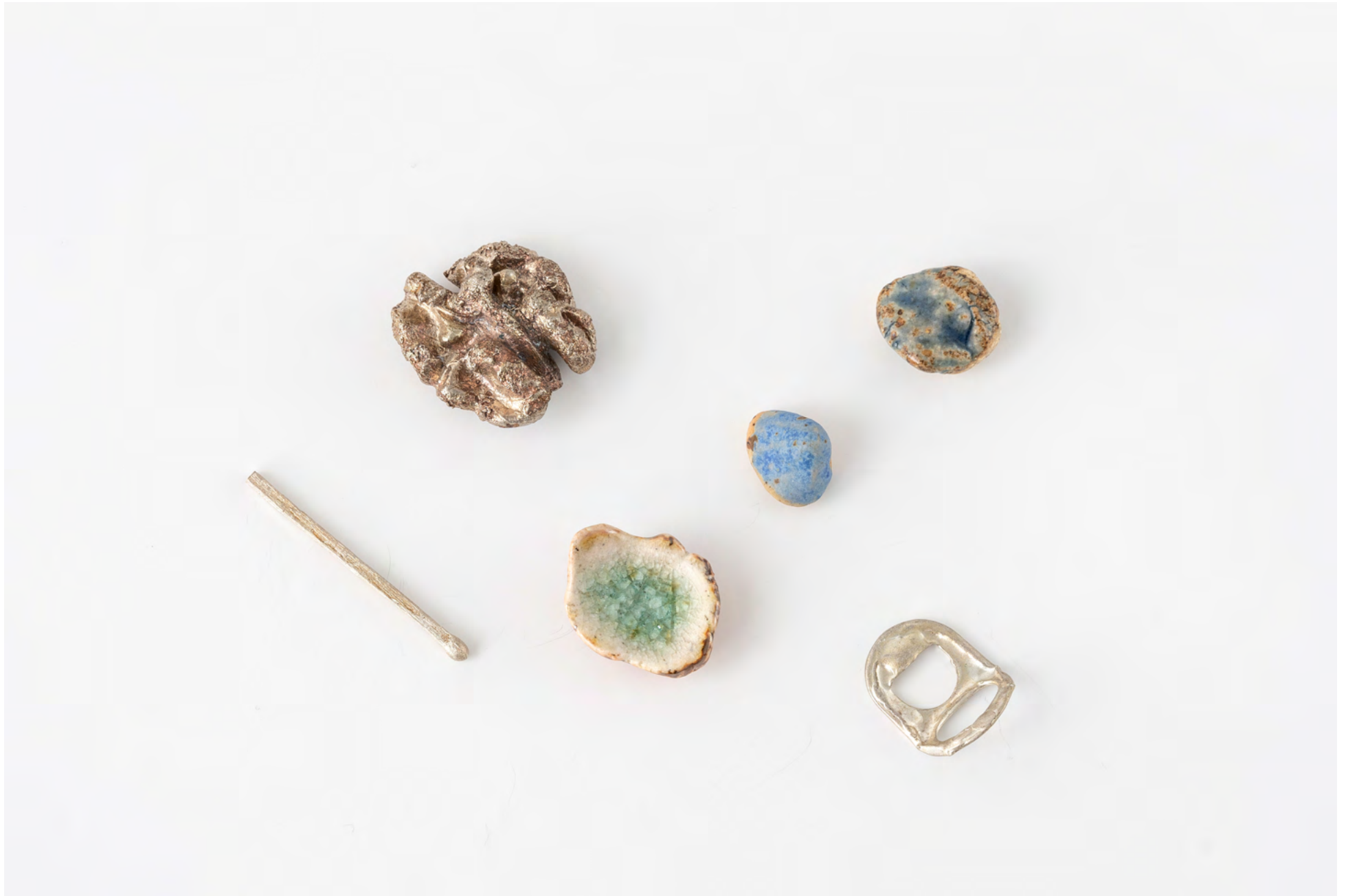
amazing all times of year , 2022. Laiton blanc, argent, verre trouvé (Auckland), grès, glaçure / White brass, silver, found glass (Auckland), stoneware, glaze (6 pc), dimensions variables.