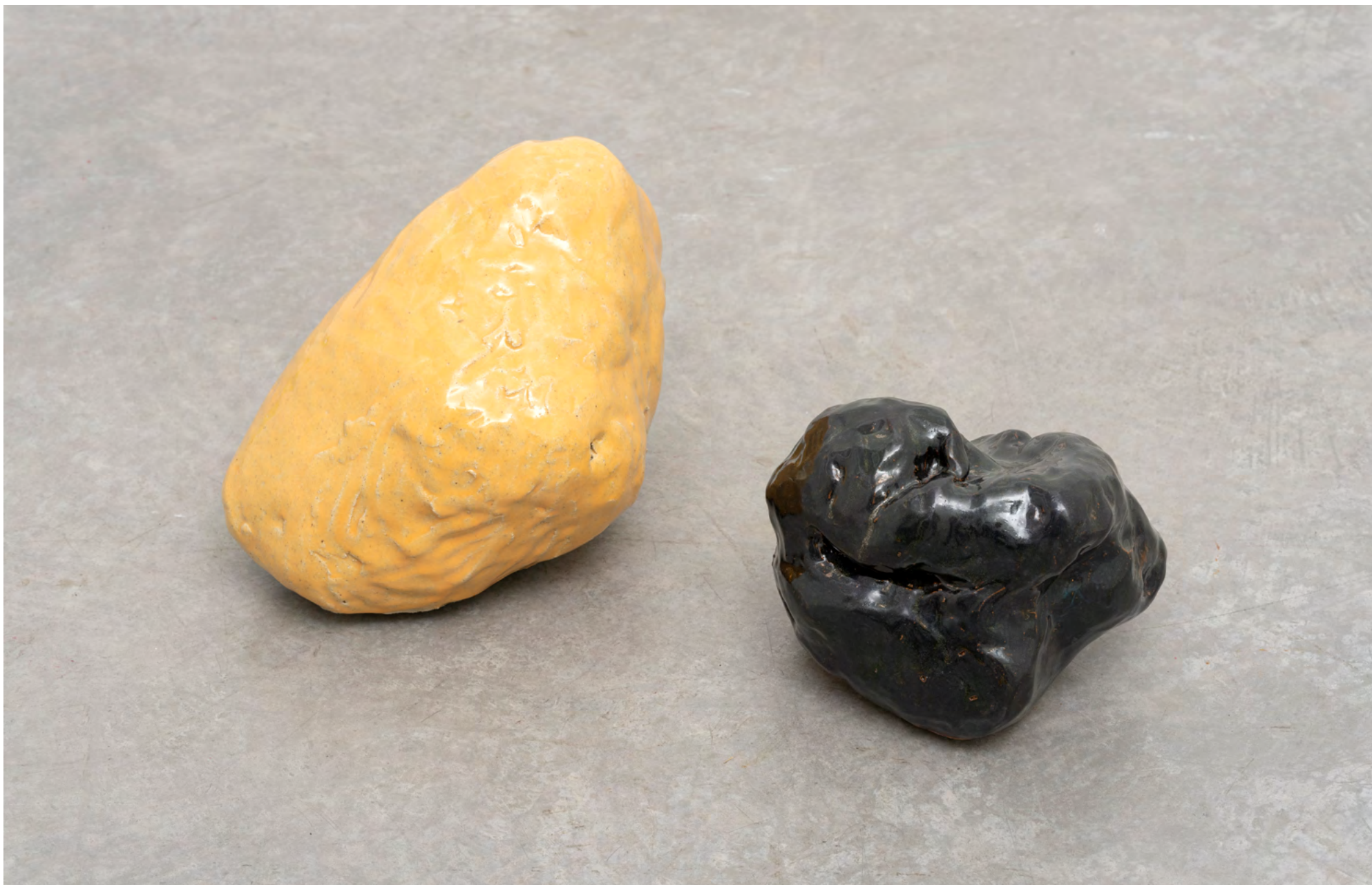
High up, high up on the hills , 2022. Grès, émail / Stoneware, glaze. Yellow : 21 x 28 x 20 cm ; black : 15 x 21 x 18 cm