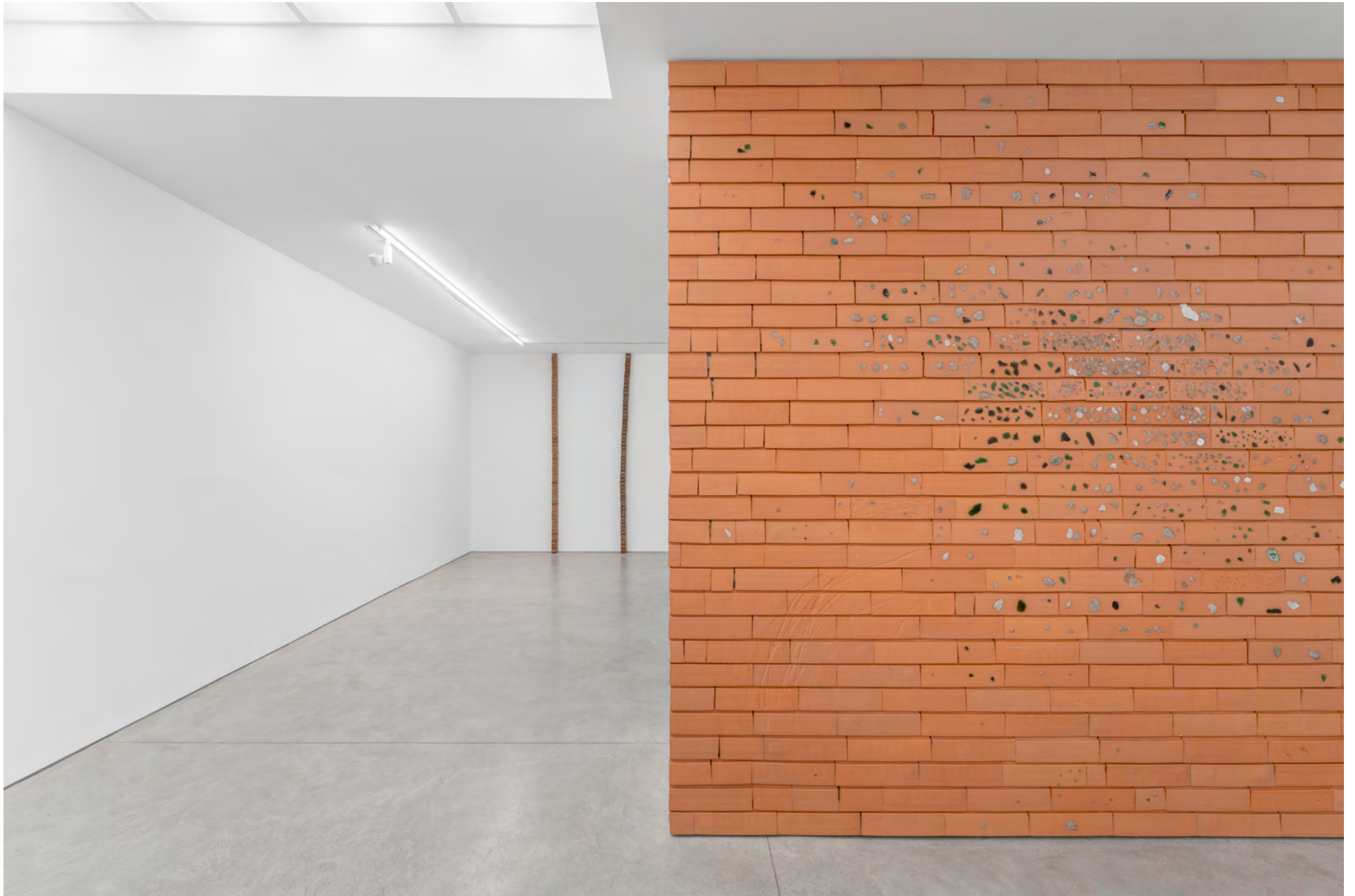
Vue de l'exposition / Installation view, Kate Newby: Try doing anything without it , 2022, Art : Concept, Paris.