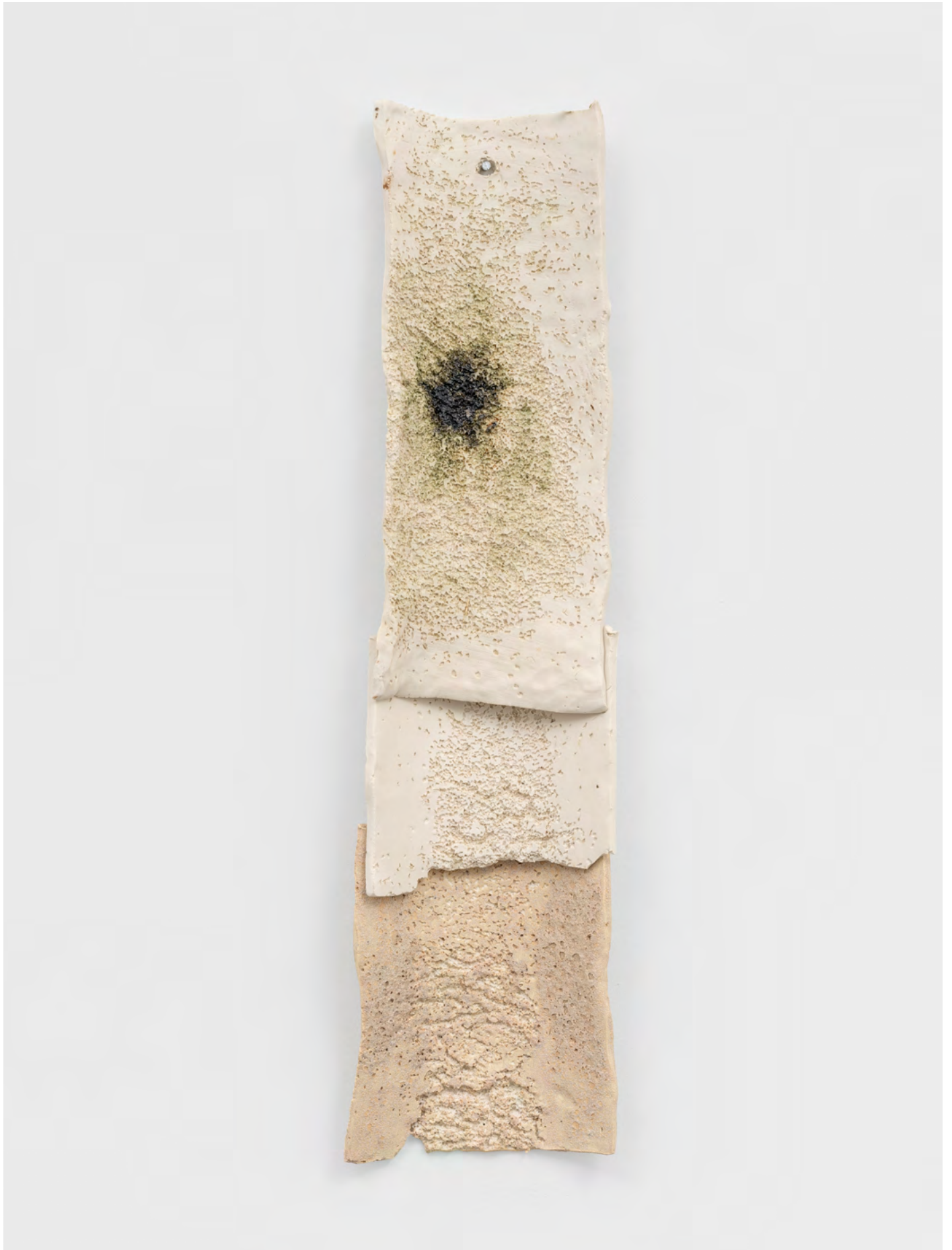
Funny, I don't remember having much to do with how I got this way , 2021. Porcelaine, émail, patine / Porcelain, glawwwze, wash. 68 × 16 × 6 cm.