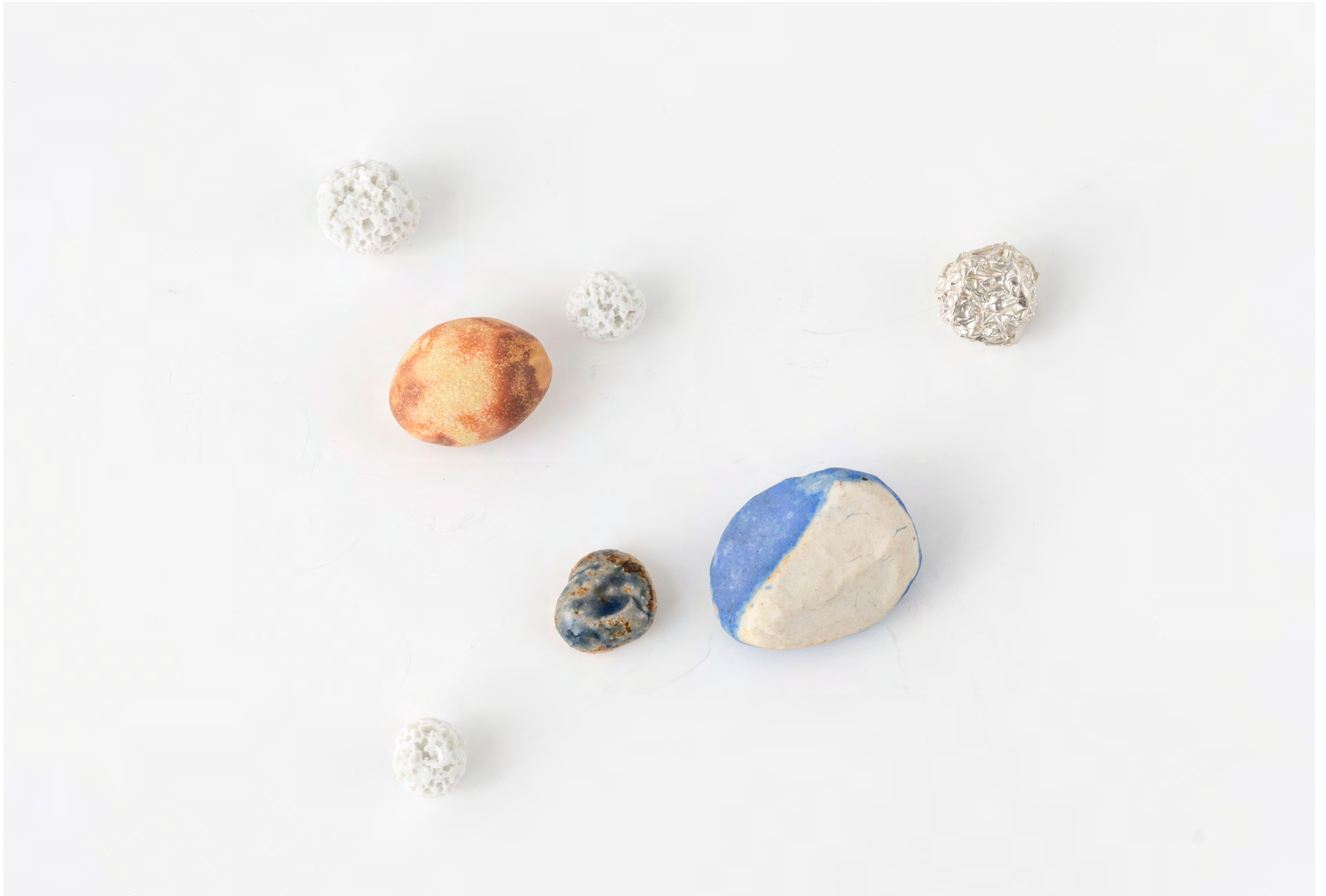
i send you strenght and love , 2022. Porcelaine de Limoges, porcelaine, émail, argent / Limoges porcelain, porcelain, glaze, silver (7 pc), dimensions variables