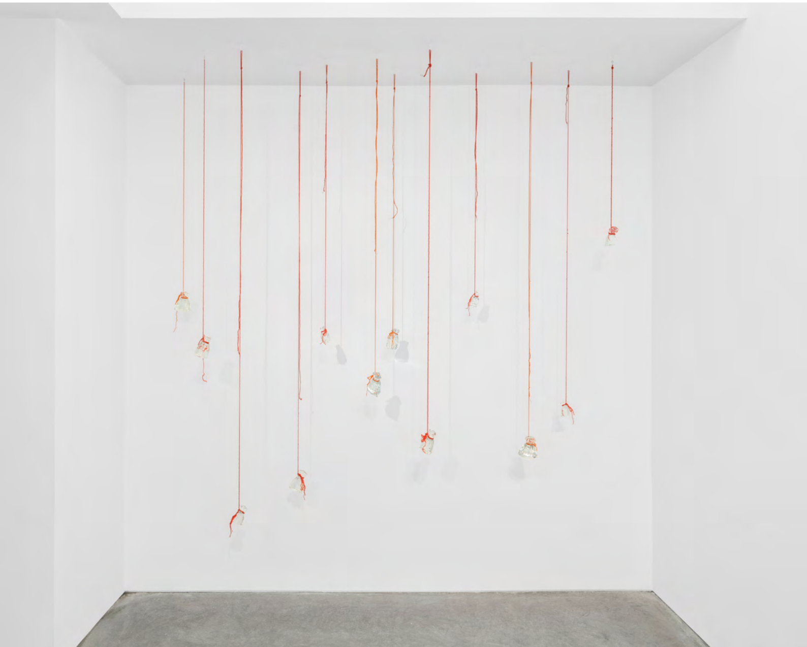
Generous and with light , 2019. Verre, corde de laine, câble / glass, wool rope, wire, dimensions variables