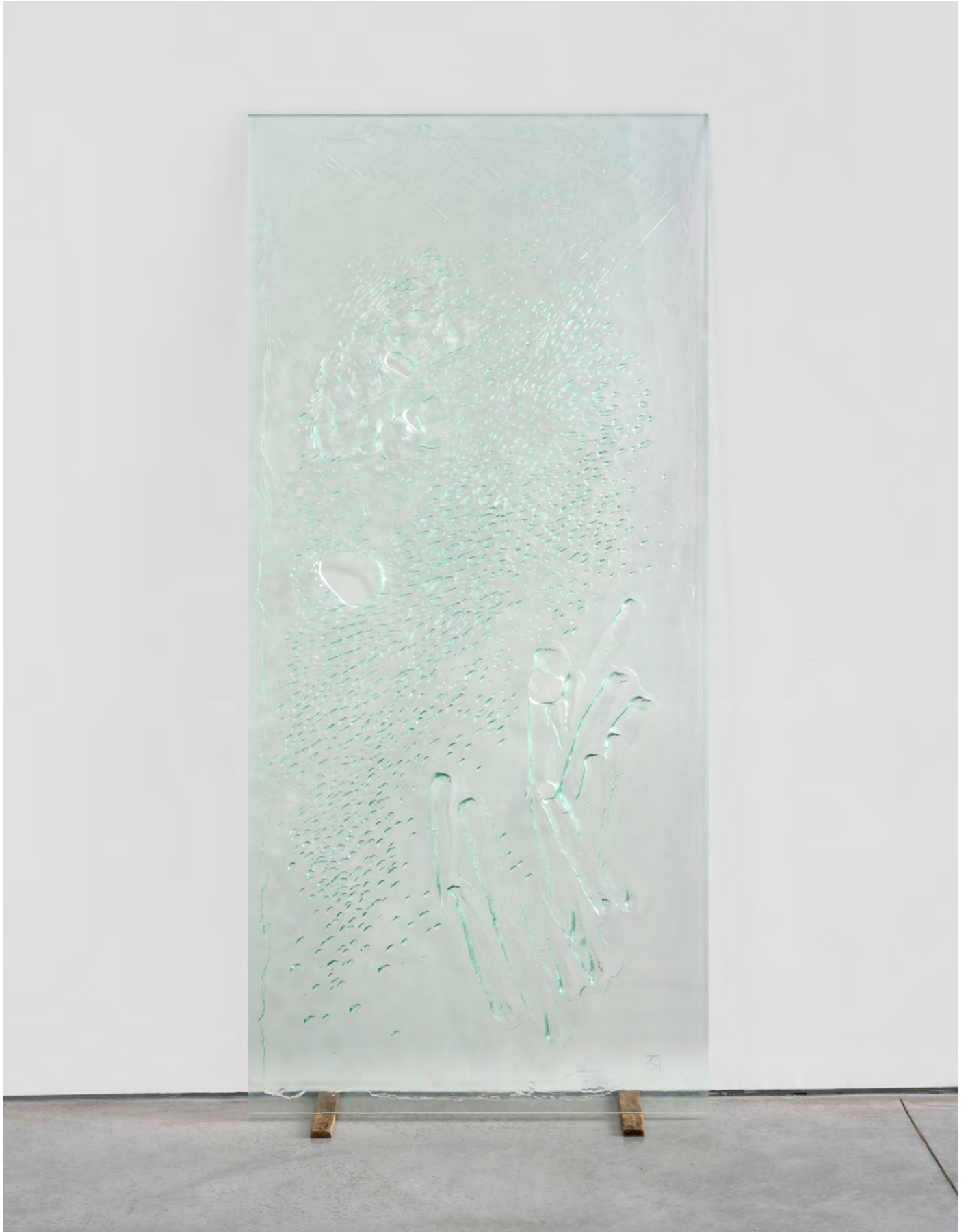
Close is good , 2022. Verre / Glass. 201 x 94 cm (79 1/8 x 37 in). Produit aux / Produced at Ateliers Loire, Chartres. Courtesy of the artist and Art : Concept, Paris. Photo Nicolas Brasseur