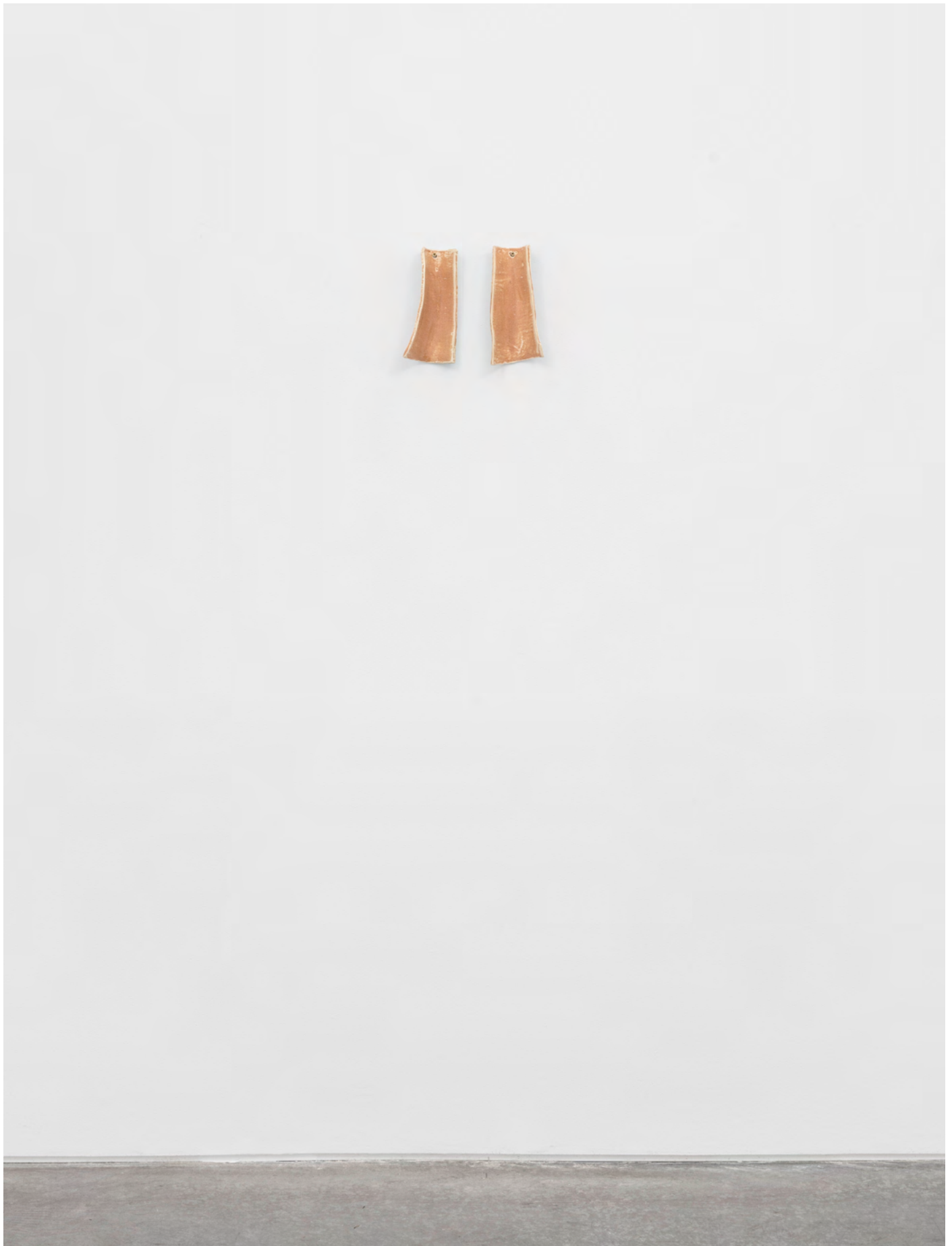
Self-Portrait , 2022. Porcelaine, émail / Porcelain, glaze. 20 x 8 x 5,5 cm (each)