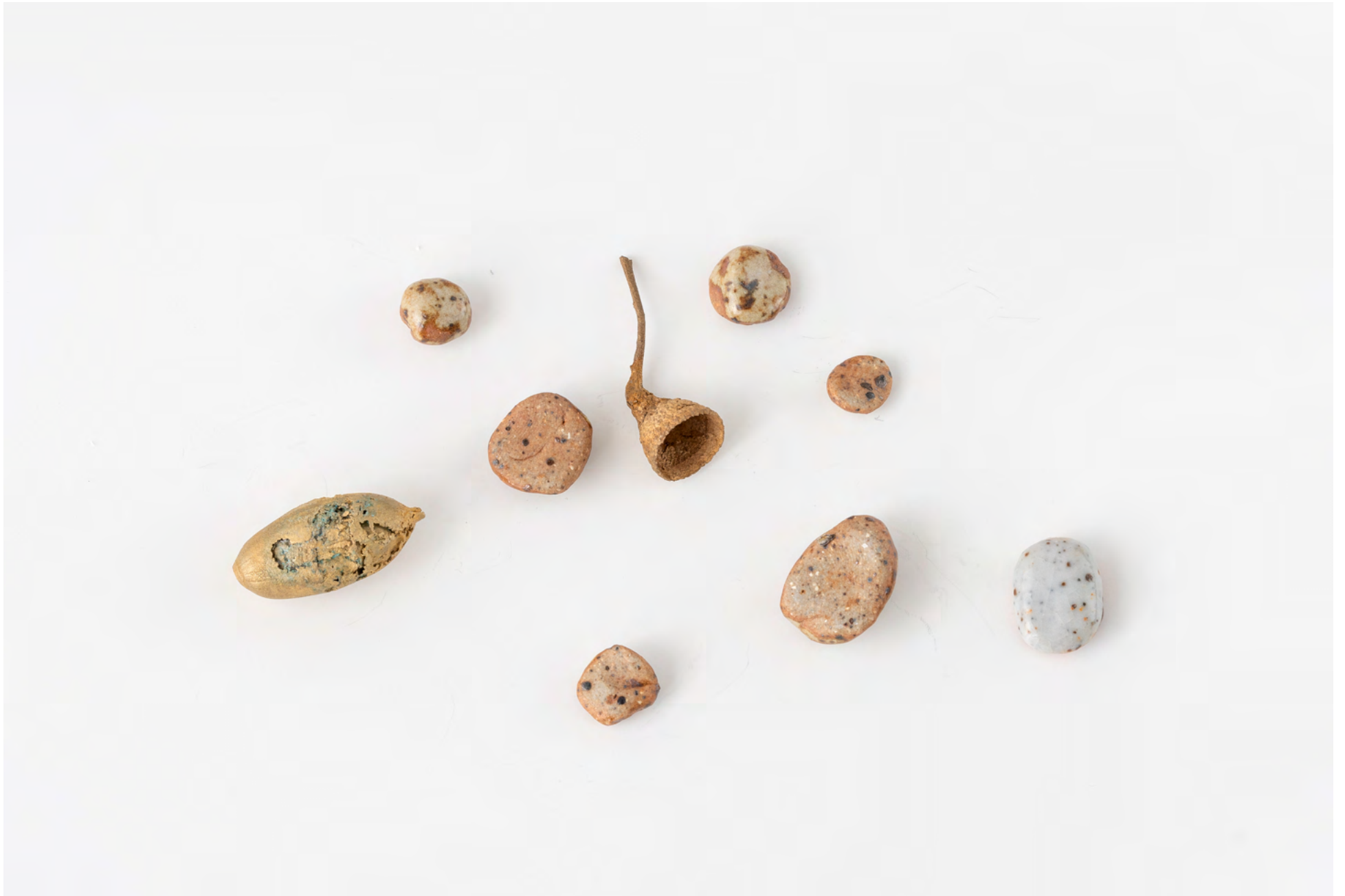
Weneedmoreofthat , 2022. Laiton, bronze, grès, émail / Brass, bronze, stoneware, glaze (9 pc), dimensions variables