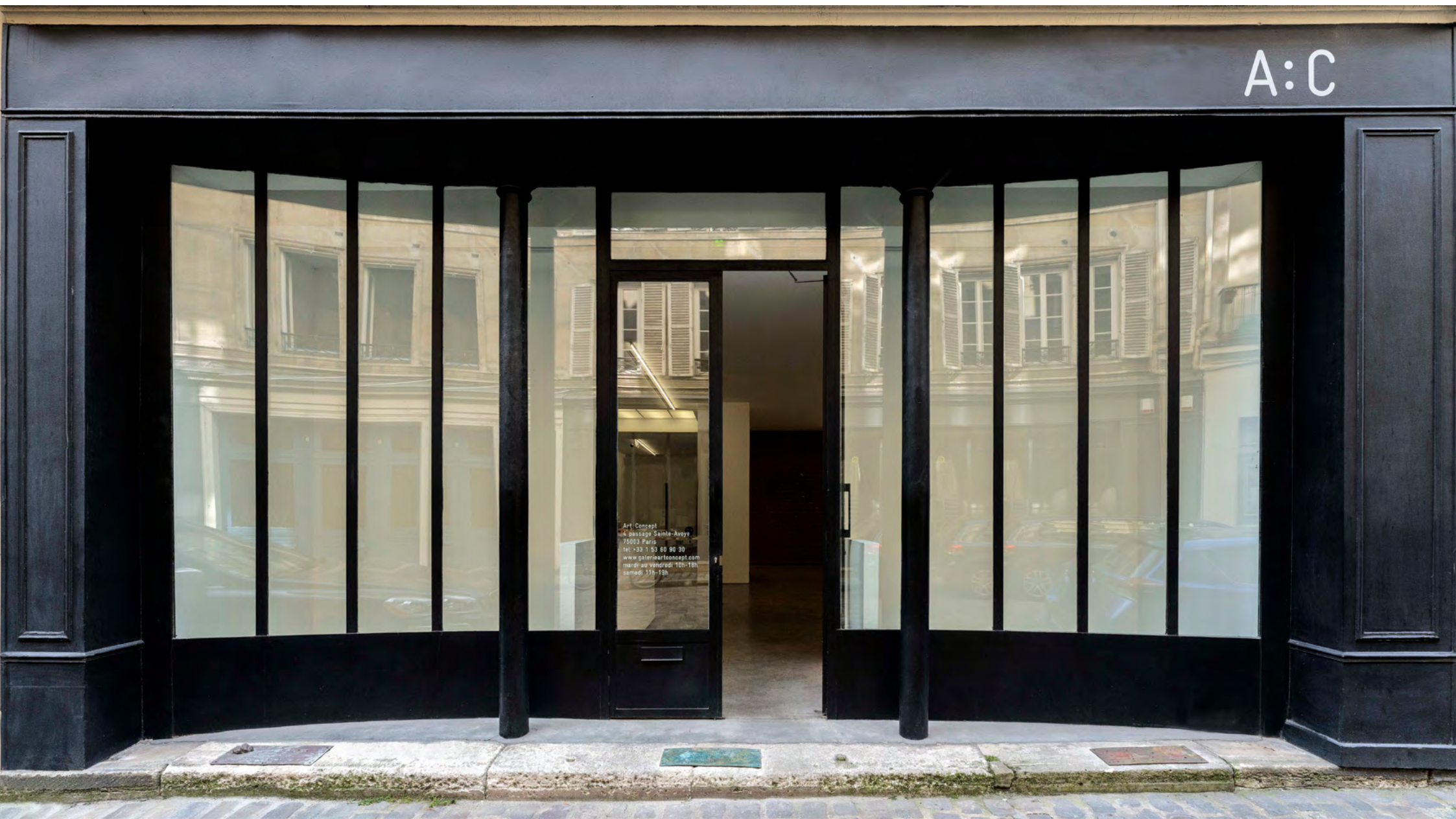
Vue de l'exposition / Installation view, Kate Newby: Try doing anything without it , 2022, Art : Concept, Paris.