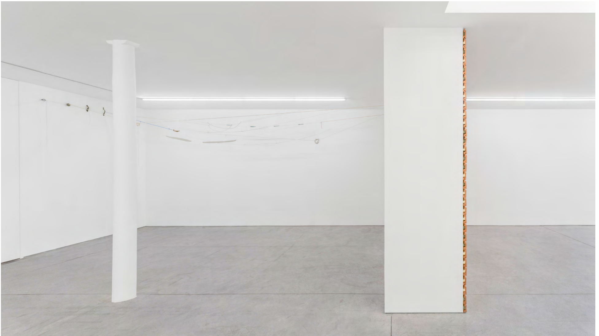
Vue de l'exposition / Installation view, Kate Newby: Try doing anything without it , 2022, Art : Concept, Paris.