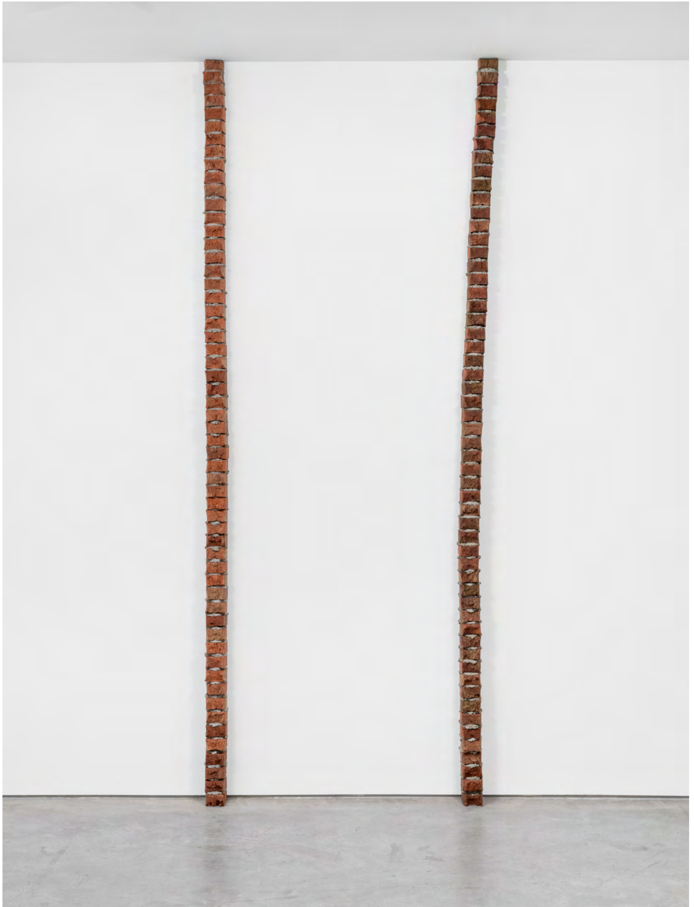
Thank you for taking us along (à gauche/left), Her expression (à droite/right), 2022. Briques, mortier / Bricks, mortar. 324 x 10 x 11 cm (127 1/2 x 3 7/8 x 4 3/8 in). Produit aux / Produced at Rairies-Montrieux.