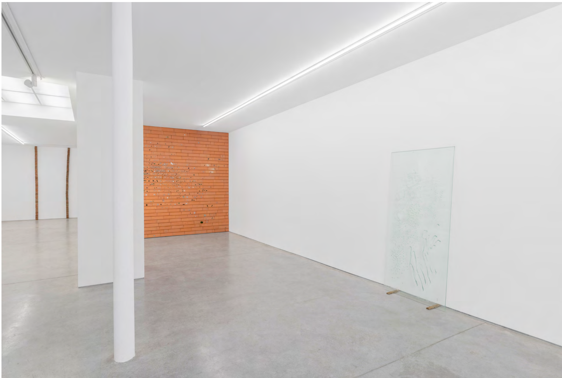
Vue de l'exposition / Installation view, Kate Newby: Try doing anything without it , 2022, Art : Concept, Paris.