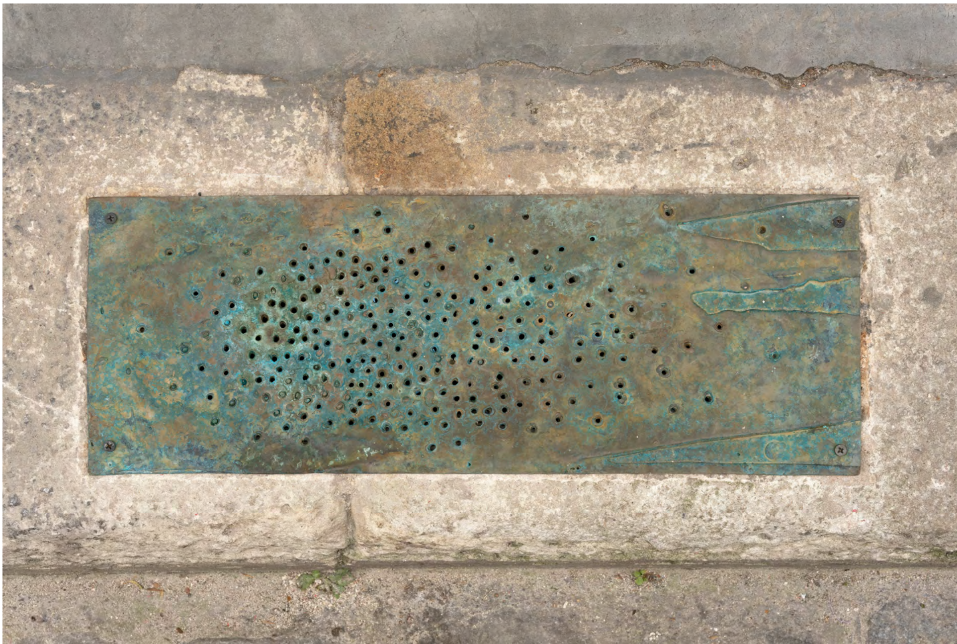
5 minutes to everywhere , 2022. Bronze. 19,5 x 54 x 0,4 cm (7 5/8 x 21 1/4 x 1/8 in)