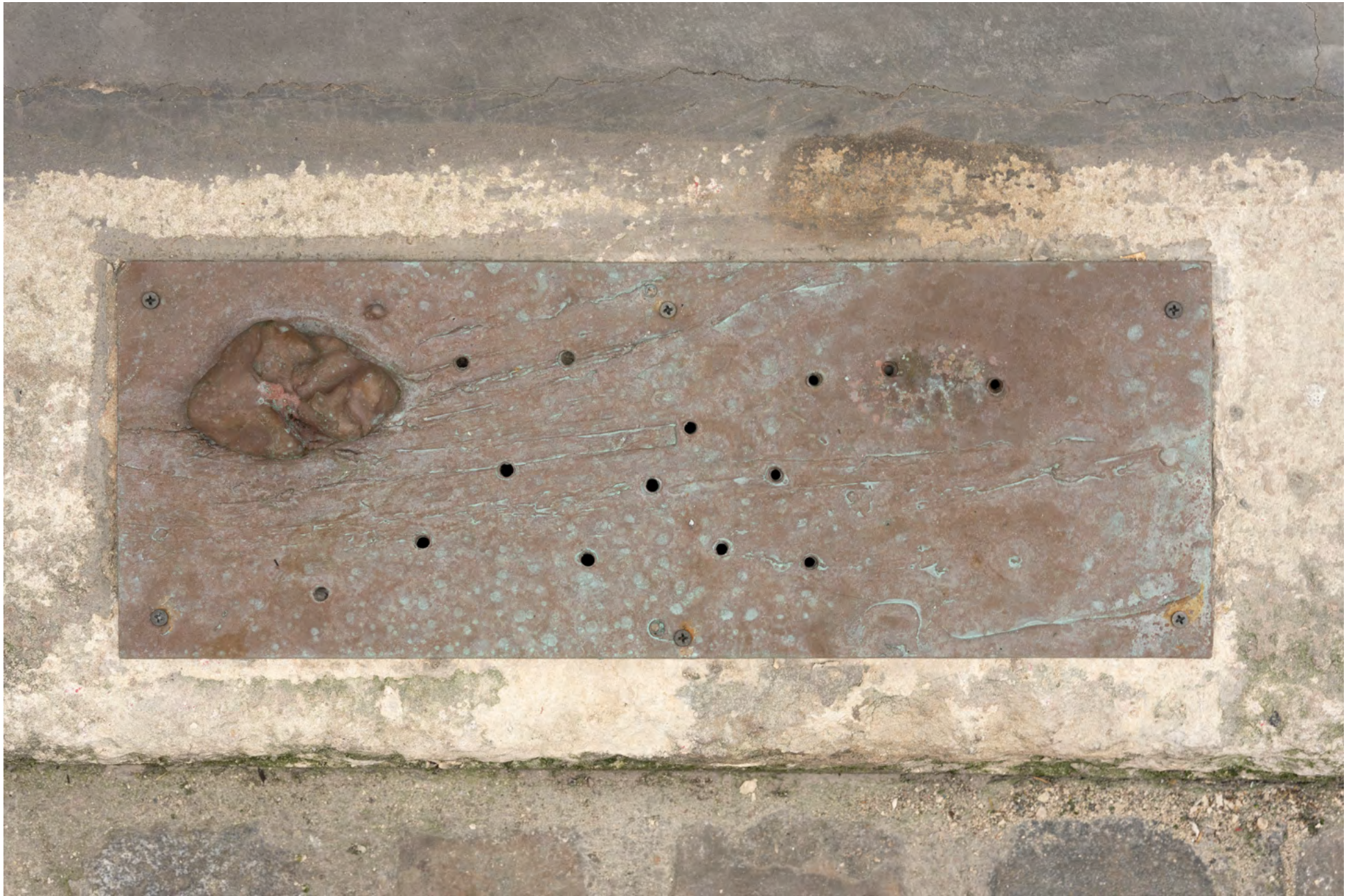
How Can the Worst Site Become the Best Garden , 2022. Bronze. 19,5 x 54 x 0,4 cm (7 5/8 x 21 1/4 x 1/8 in)