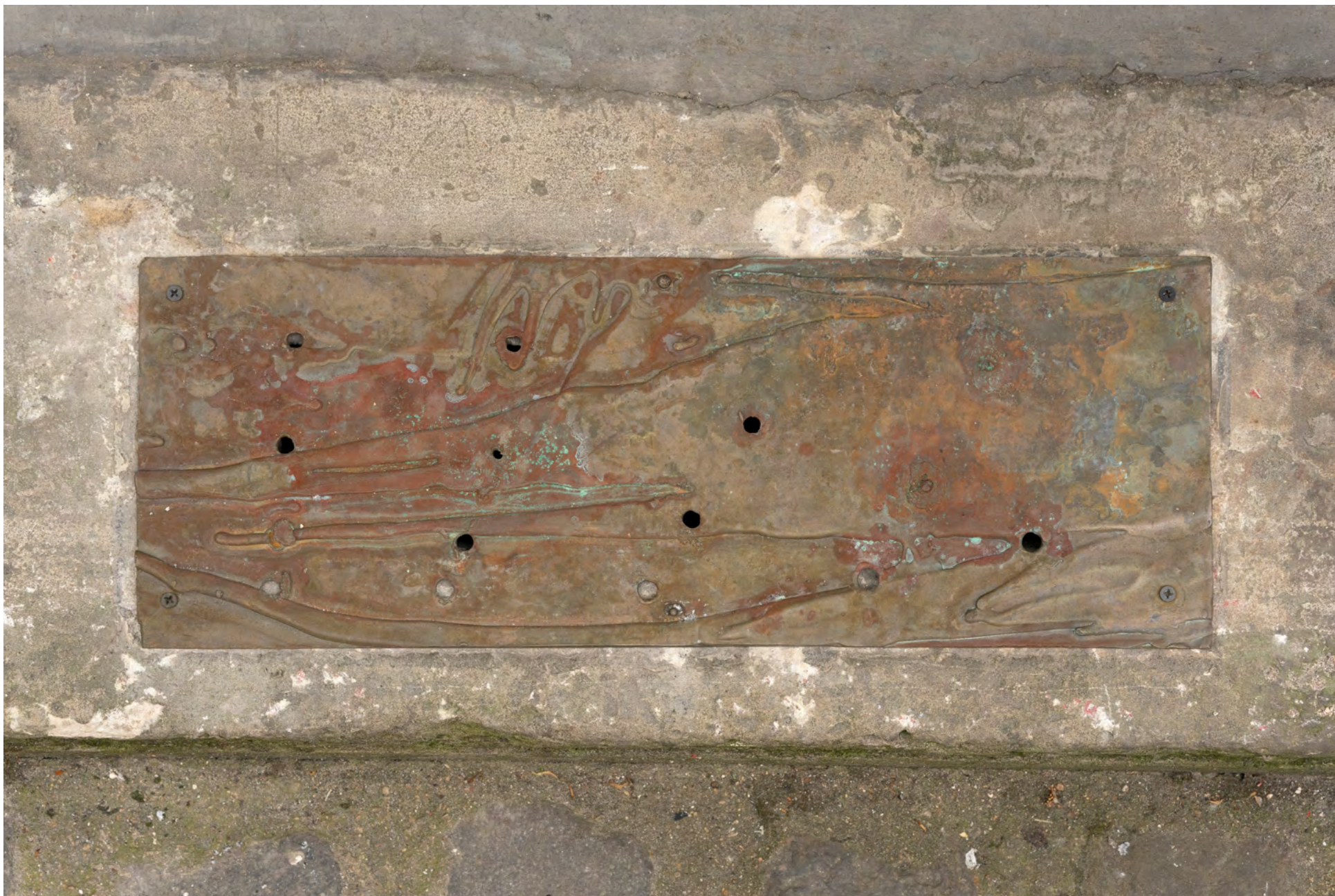
GET OFF THE SHED , 2022. Bronze. 19,5 x 54 x 0,4 cm (7 5/8 x 21 1/4 x 1/8 in)