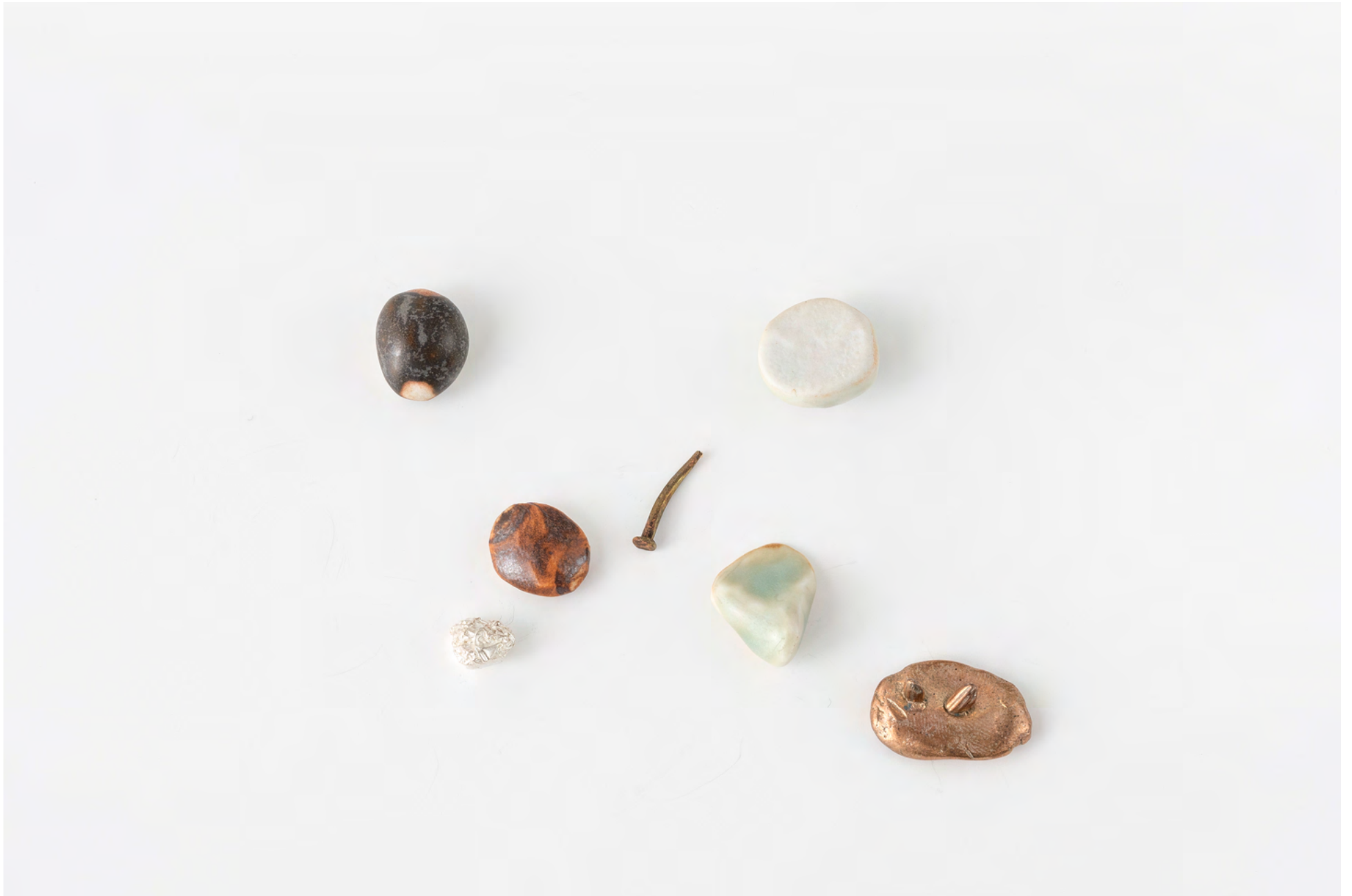
Still sounds as good as it did back then , 2022. Argent rose, argent, bronze, grès, porcelaine, émail / Pink silver, silver, bronze, stoneware, porcelain, glaze (7 pc), dimensions variables