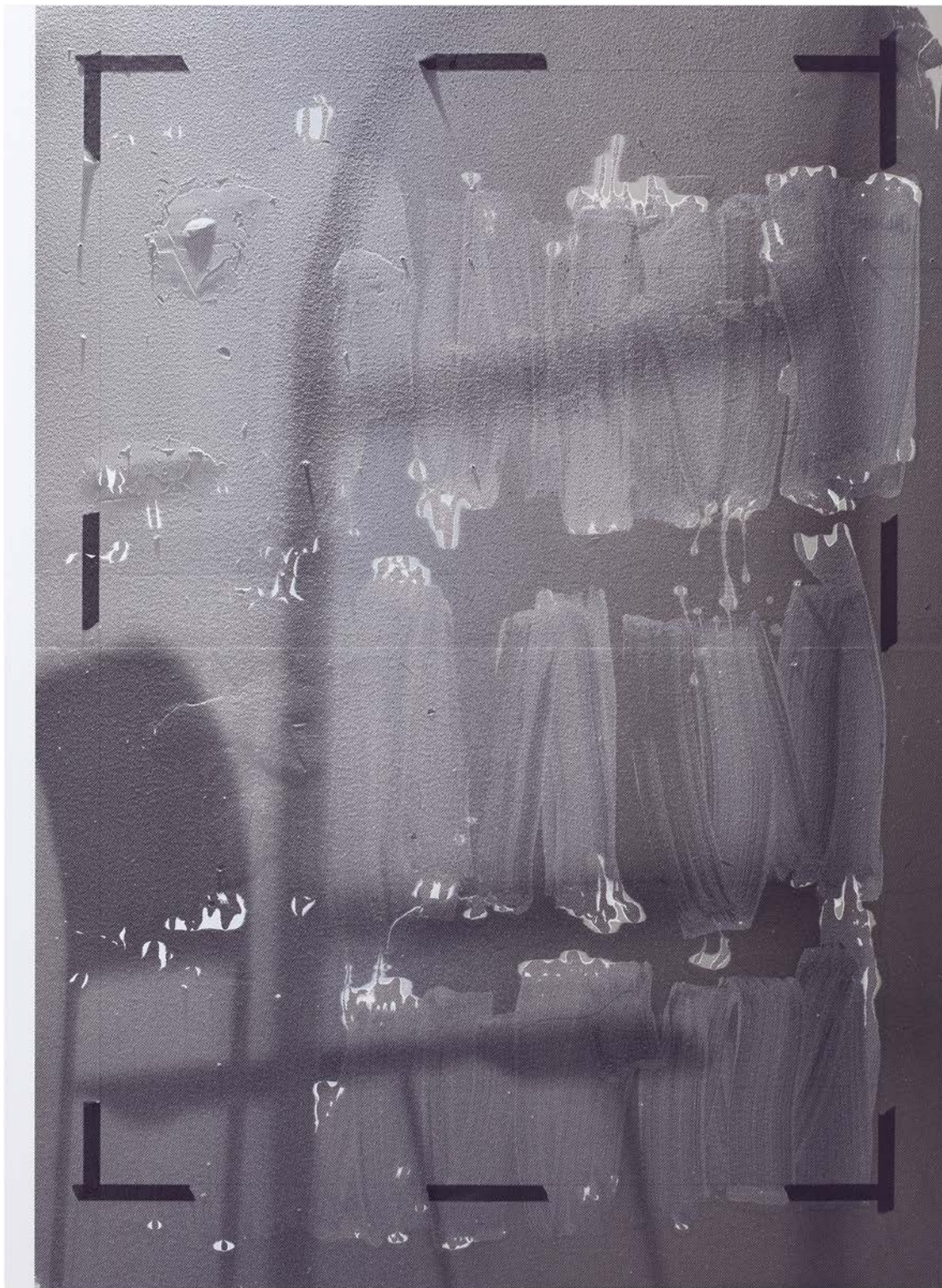
Untitled , 2014 acrylique sur aluminium acrylic on aluminum 196,85 x 146,05 cm // 77 1/2 x 57 1/2 in

Nathan Hylden - More Over 14 juin - 26 Juillet 2014 Images de presse // Images for press