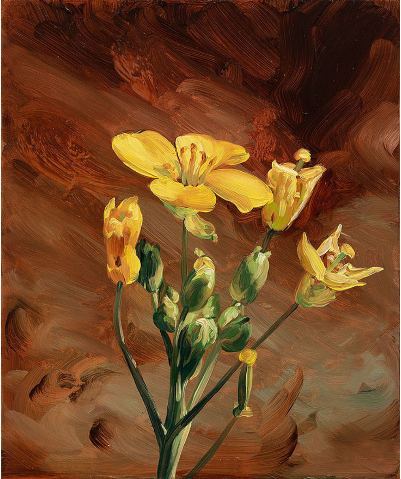
Julien AUDEBERT Bunias fausse-roquette , 2019 Huile sur cuivre Oil on copper 18 x 15 cm (7 1/8 x 5 7/8 in.)

Art : Concept 4 passage Sainte-Avoye, Paris 0033 1 53 60 90 30 www.galerieartconcept.com