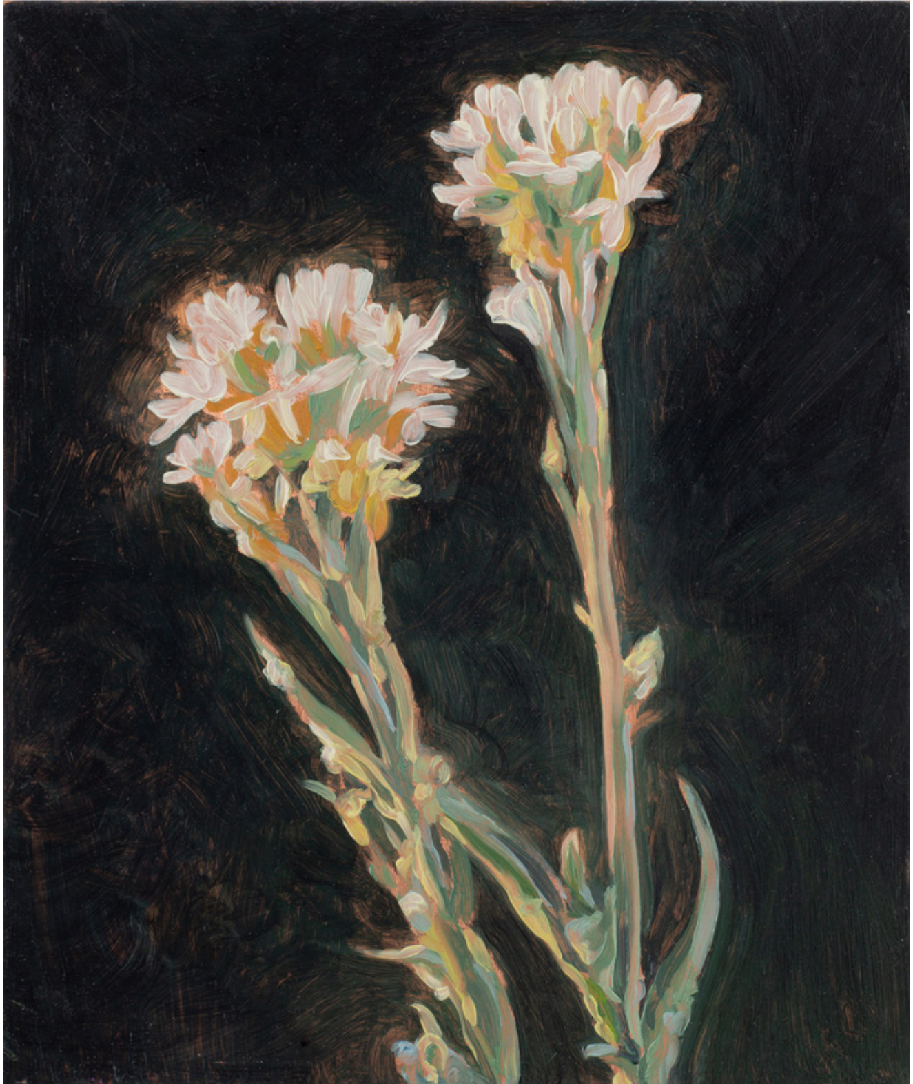
Julien AUDEBERT Alysson blanc , 2019 Huile sur cuivre Oil on copper 18 x 15 cm (7 1/8 x 5 7/8 in.) (Vendu)

Art : Concept 4 passage Sainte-Avoye, Paris 0033 1 53 60 90 30 www.galerieartconcept.com