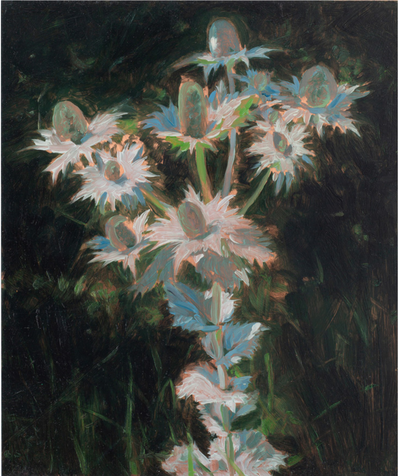
Julien AUDEBERT Panicaut géant , 2019 Huile sur cuivre Oil on copper 18 x 15 cm (7 1/8 x 5 7/8 in.) (Vendu)

Art : Concept 4 passage Sainte-Avoye, Paris 0033 1 53 60 90 30 www.galerieartconcept.com