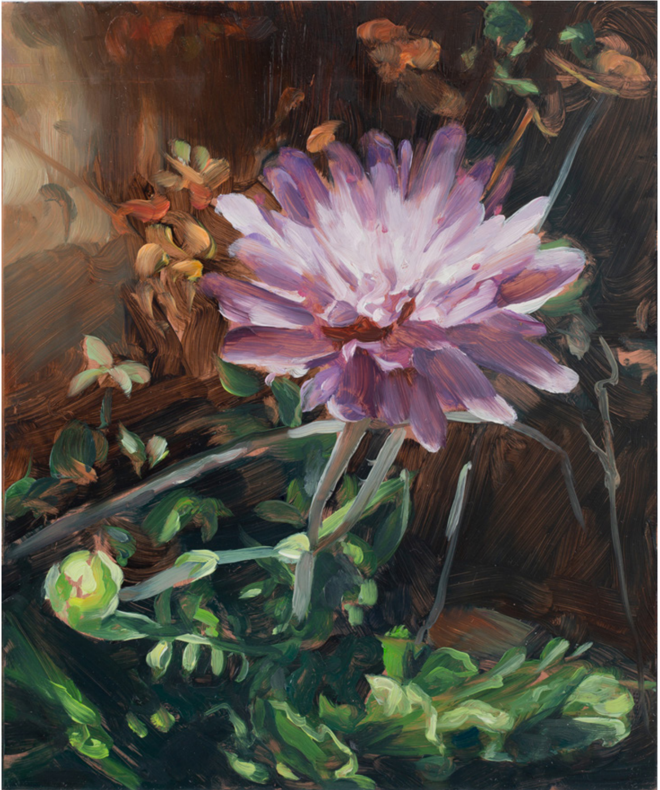
Julien AUDEBERT Knautie pourpre , 2019 Huile sur cuivre Oil on copper 18 x 15 cm (7 1/8 x 5 7/8 in.)

Art : Concept 4 passage Sainte-Avoye, Paris 0033 1 53 60 90 30 www.galerieartconcept.com