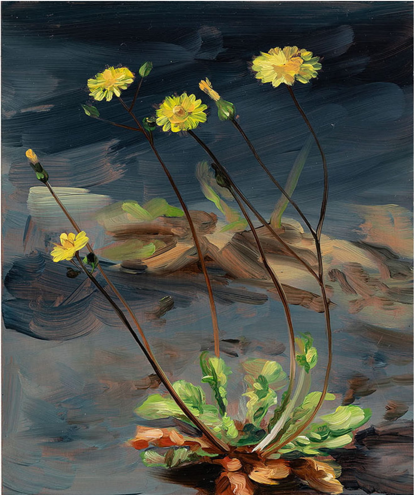
Julien AUDEBERT Crépis de Nîmes , 2019 Huile sur cuivre Oil on copper 18 x 15 cm (7 1/8 x 5 7/8 in.)

Art : Concept 4 passage Sainte-Avoye, Paris 0033 1 53 60 90 30 www.galerieartconcept.com