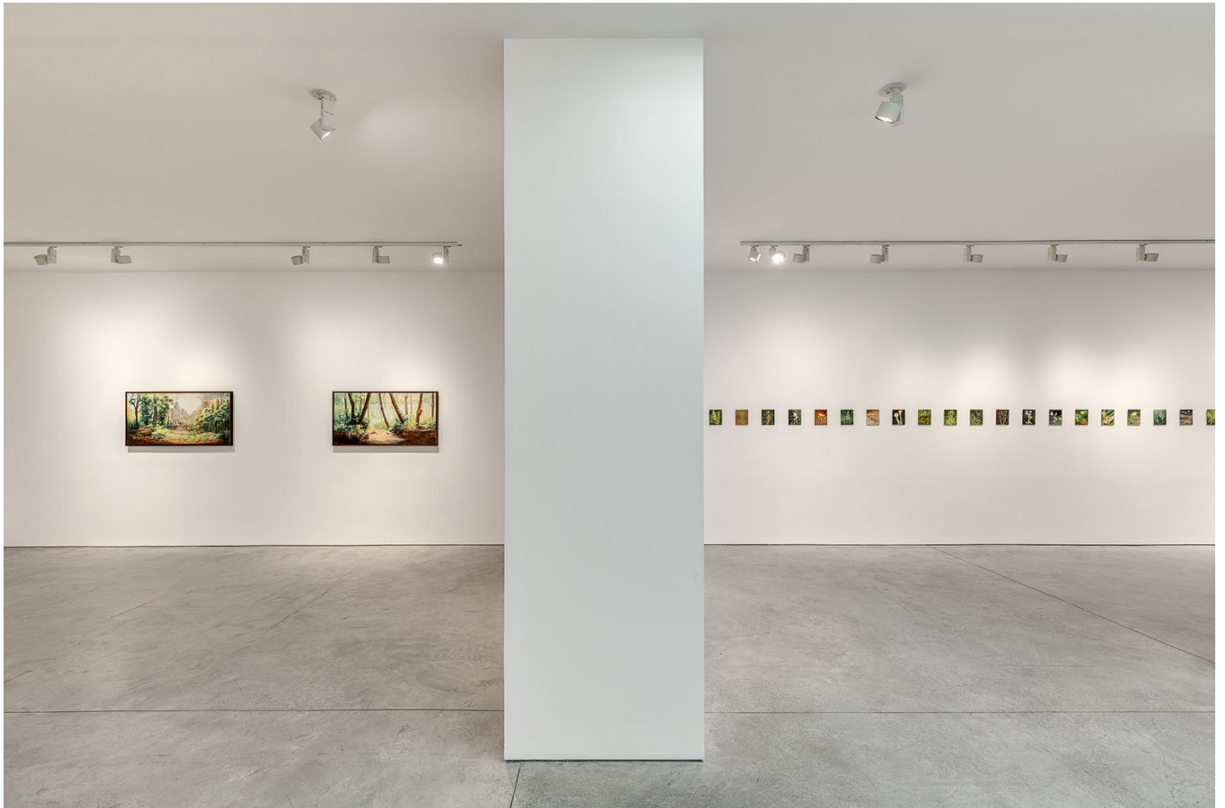
Another green world , Vue d'exposition, Art : Concept, Paris, 23 janvier - 29 février 2020 Another green world , Installation view, Art : Concept, Paris, 23 January - 29 February 2020

Art : Concept 4 passage Sainte-Avoye, Paris 0033 1 53 60 90 30 www.galerieartconcept.com