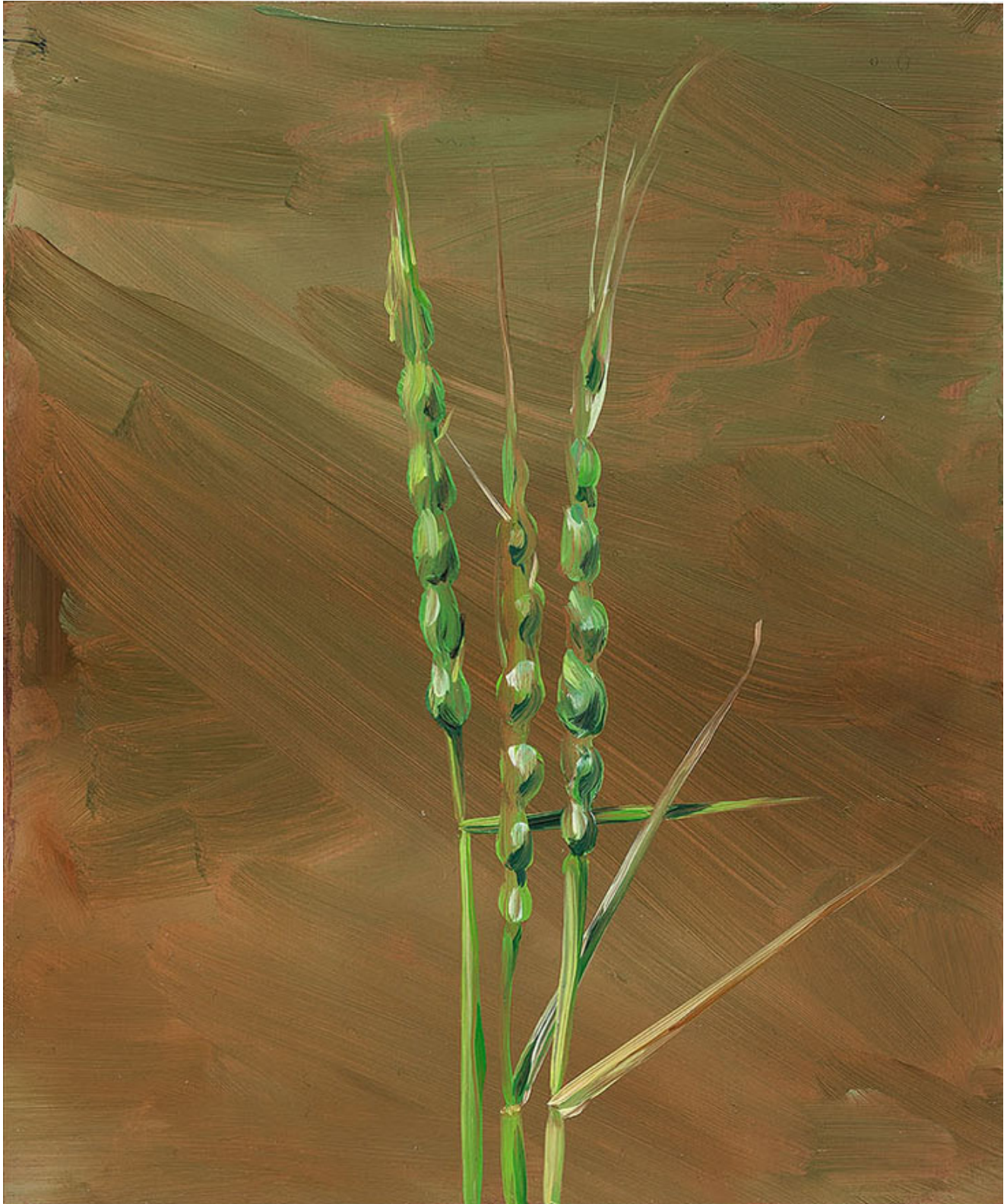
Julien AUDEBERT Aegilops ventricosa (Egilope ventru) , 2019 Huile sur cuivre Oil on copper 18 x 15 cm (7 1/8 x 5 7/8 in.)

Art : Concept 4 passage Sainte-Avoye, Paris 0033 1 53 60 90 30 www.galerieartconcept.com