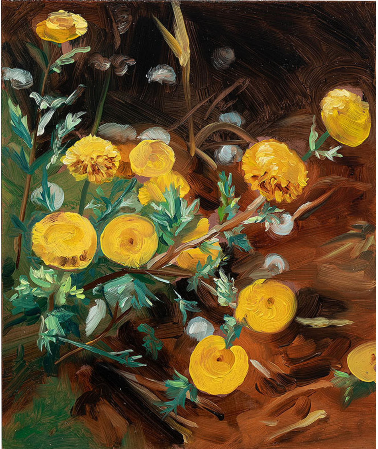
Julien AUDEBERT Anacyclus valentinus (Anacycle de Valence) , 2019 Huile sur cuivre Oil on copper 18 x 15 cm (7 1/8 x 5 7/8 in.) (Vendu)

Art : Concept 4 passage Sainte-Avoye, Paris 0033 1 53 60 90 30 www.galerieartconcept.com