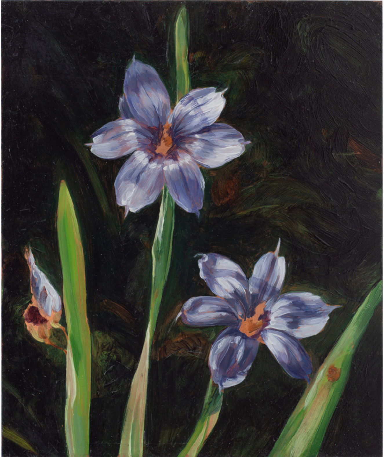
Julien AUDEBERT Bermudienne , 2019 Huile sur cuivre Oil on copper 18 x 15 cm (7 1/8 x 5 7/8 in.) (Vendu)

Art : Concept 4 passage Sainte-Avoye, Paris 0033 1 53 60 90 30 www.galerieartconcept.com