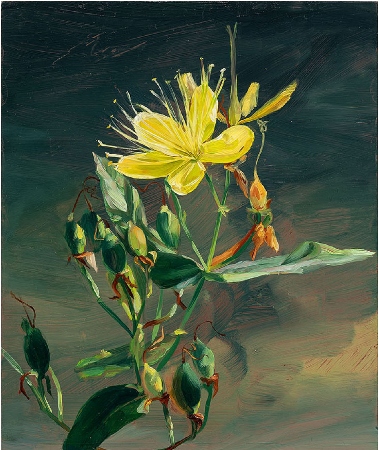
Julien AUDEBERT Grand millepertuis canadien , 2019 Huile sur cuivre Oil on copper 18 x 15 cm (7 1/8 x 5 7/8 in.)

Art : Concept 4 passage Sainte-Avoye, Paris 0033 1 53 60 90 30 www.galerieartconcept.com