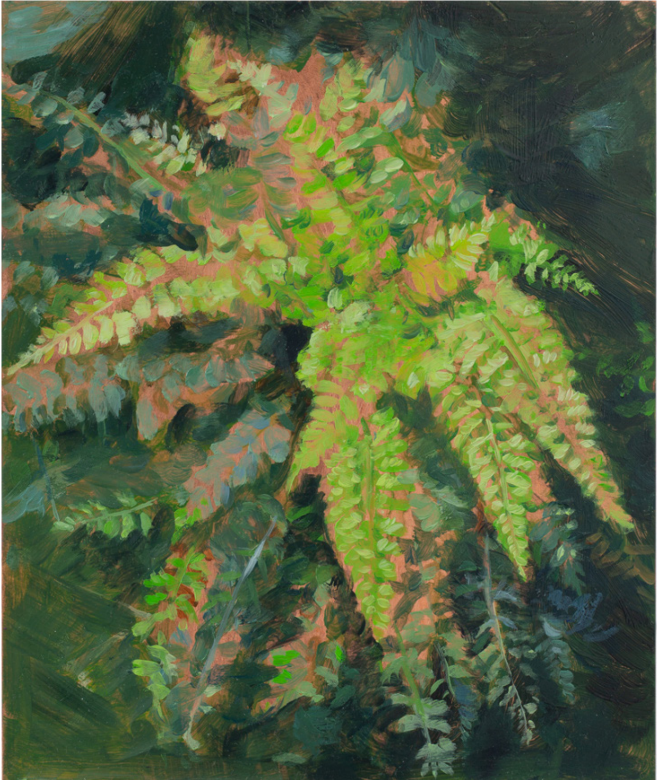
Julien AUDEBERT Doradille des fontaines , 2019 Huile sur cuivre Oil on copper 18 x 15 cm (7 1/8 x 5 7/8 in.) (Vendu)

Art : Concept 4 passage Sainte-Avoye, Paris 0033 1 53 60 90 30 www.galerieartconcept.com