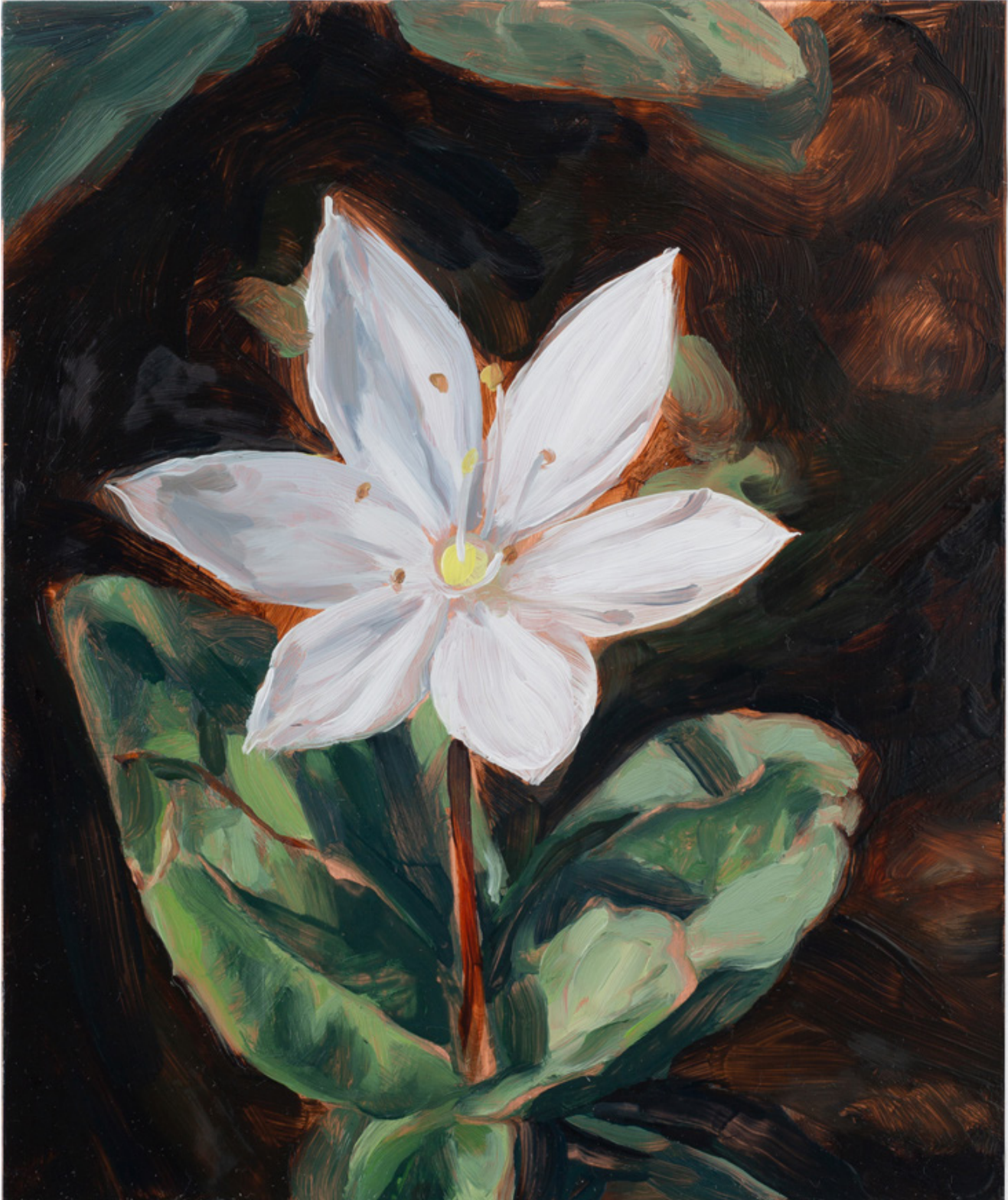
Julien AUDEBERT Trientale d'Europe , 2019 Huile sur cuivre Oil on copper 18 x 15 cm (7 1/8 x 5 7/8 in.)

Art : Concept 4 passage Sainte-Avoye, Paris 0033 1 53 60 90 30 www.galerieartconcept.com