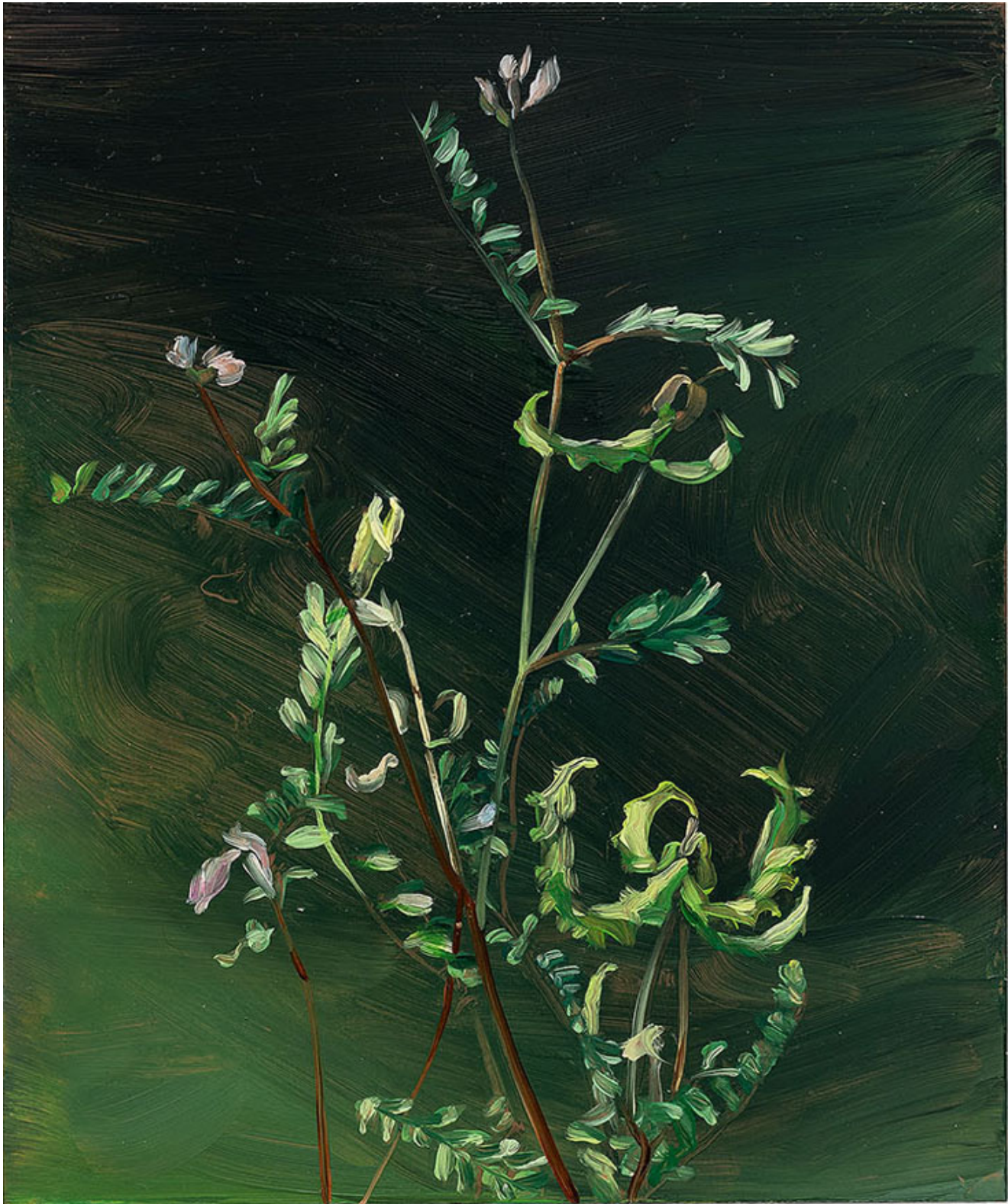
Julien AUDEBERT Astragale double-scie , 2019 Huile sur cuivre Oil on copper 18 x 15 cm (7 1/8 x 5 7/8 in.)

Art : Concept 4 passage Sainte-Avoye, Paris 0033 1 53 60 90 30 www.galerieartconcept.com