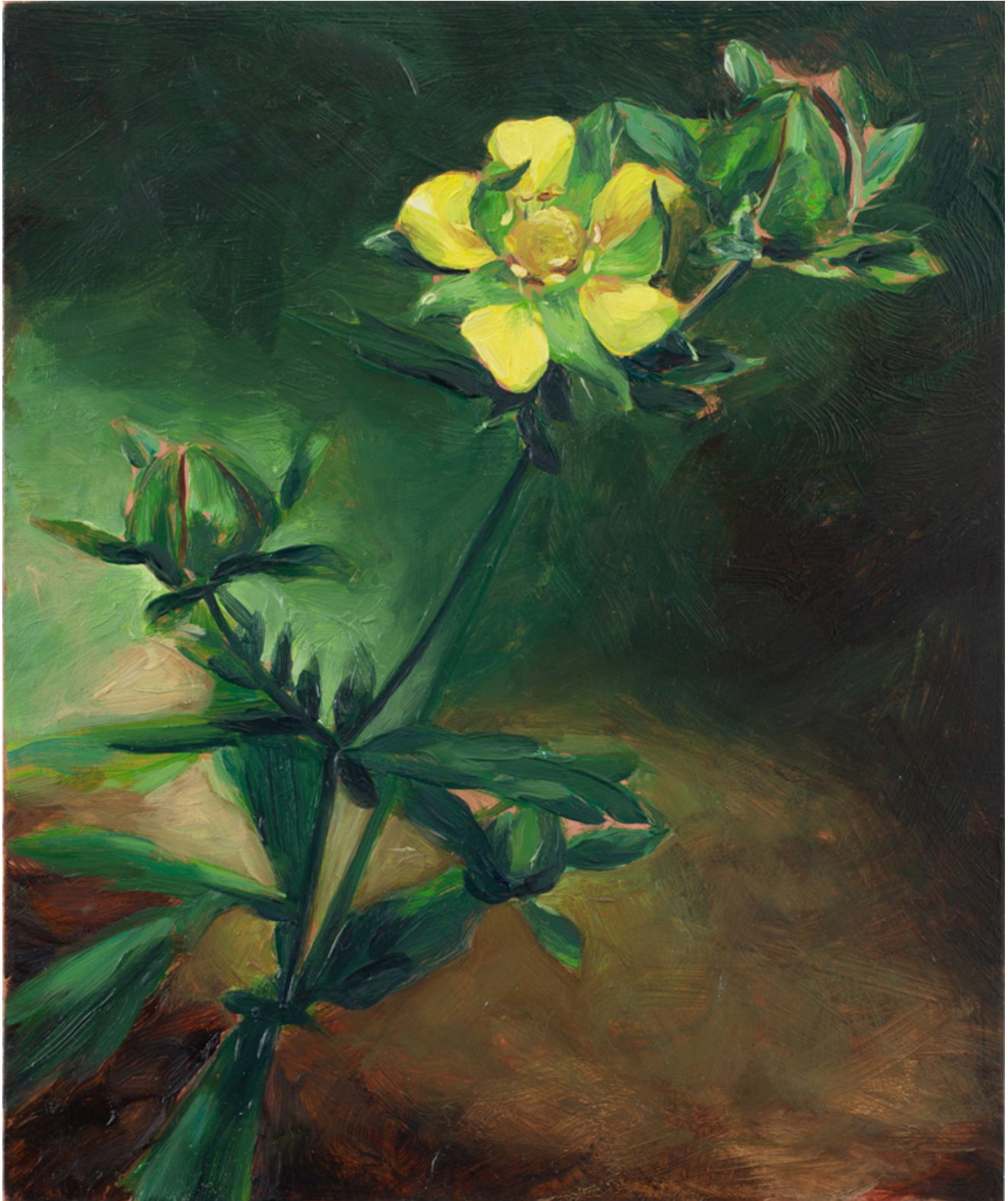
Julien AUDEBERT Potentille norvégienne , 2019 Huile sur cuivre Oil on copper 18 x 15 cm (7 1/8 x 5 7/8 in.)

Art : Concept 4 passage Sainte-Avoye, Paris 0033 1 53 60 90 30 www.galerieartconcept.com