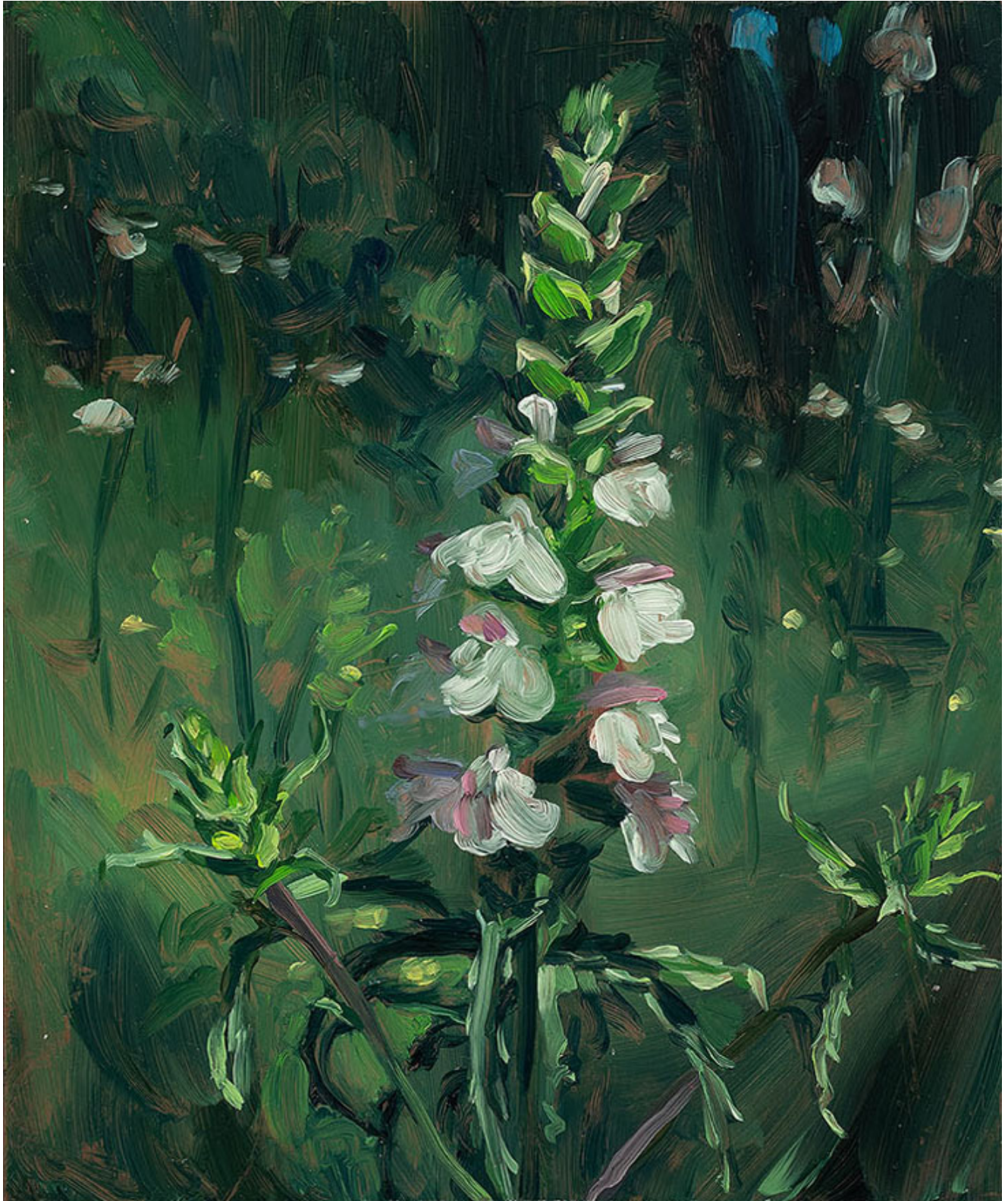
Julien AUDEBERT Bellardie multicolore , 2019 Huile sur cuivre Oil on copper 18 x 15 cm (7 1/8 x 5 7/8 in.)

Art : Concept 4 passage Sainte-Avoye, Paris 0033 1 53 60 90 30 www.galerieartconcept.com