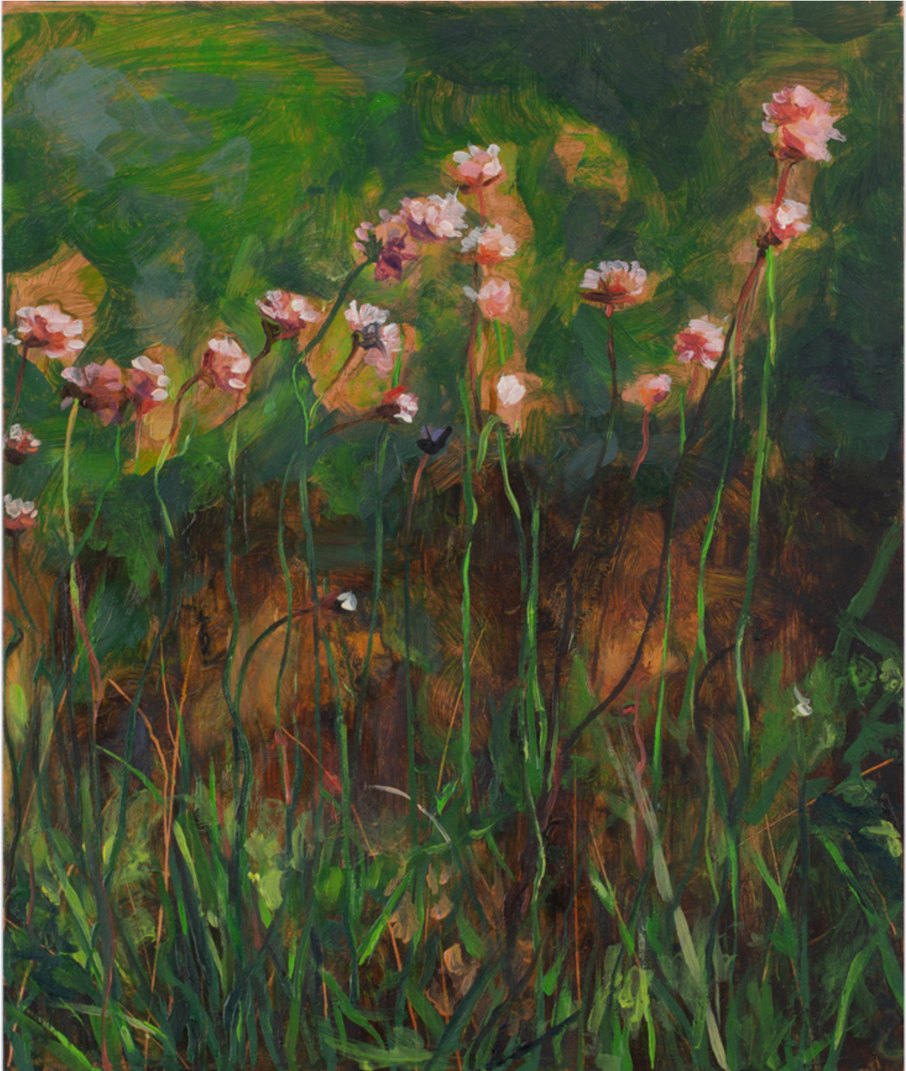
Julien AUDEBERT Armérie à tige allongée , 2019 Huile sur cuivre Oil on copper 18 x 15 cm (7 1/8 x 5 7/8 in.) (Vendu)

Art : Concept 4 passage Sainte-Avoye, Paris 0033 1 53 60 90 30 www.galerieartconcept.com