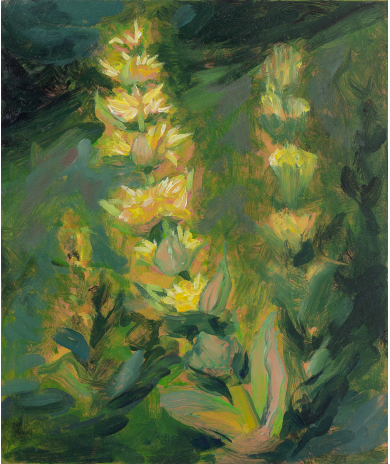
Julien AUDEBERT Grande gentiane , 2019 Huile sur cuivre Oil on copper 18 x 15 cm (7 1/8 x 5 7/8 in.)

Art : Concept 4 passage Sainte-Avoye, Paris 0033 1 53 60 90 30 www.galerieartconcept.com