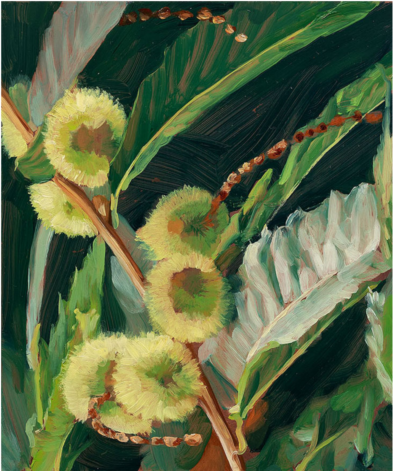
Julien AUDEBERT Châtaignier , 2019 Huile sur cuivre Oil on copper 18 x 15 cm (7 1/8 x 5 7/8 in.)

Art : Concept 4 passage Sainte-Avoye, Paris 0033 1 53 60 90 30 www.galerieartconcept.com