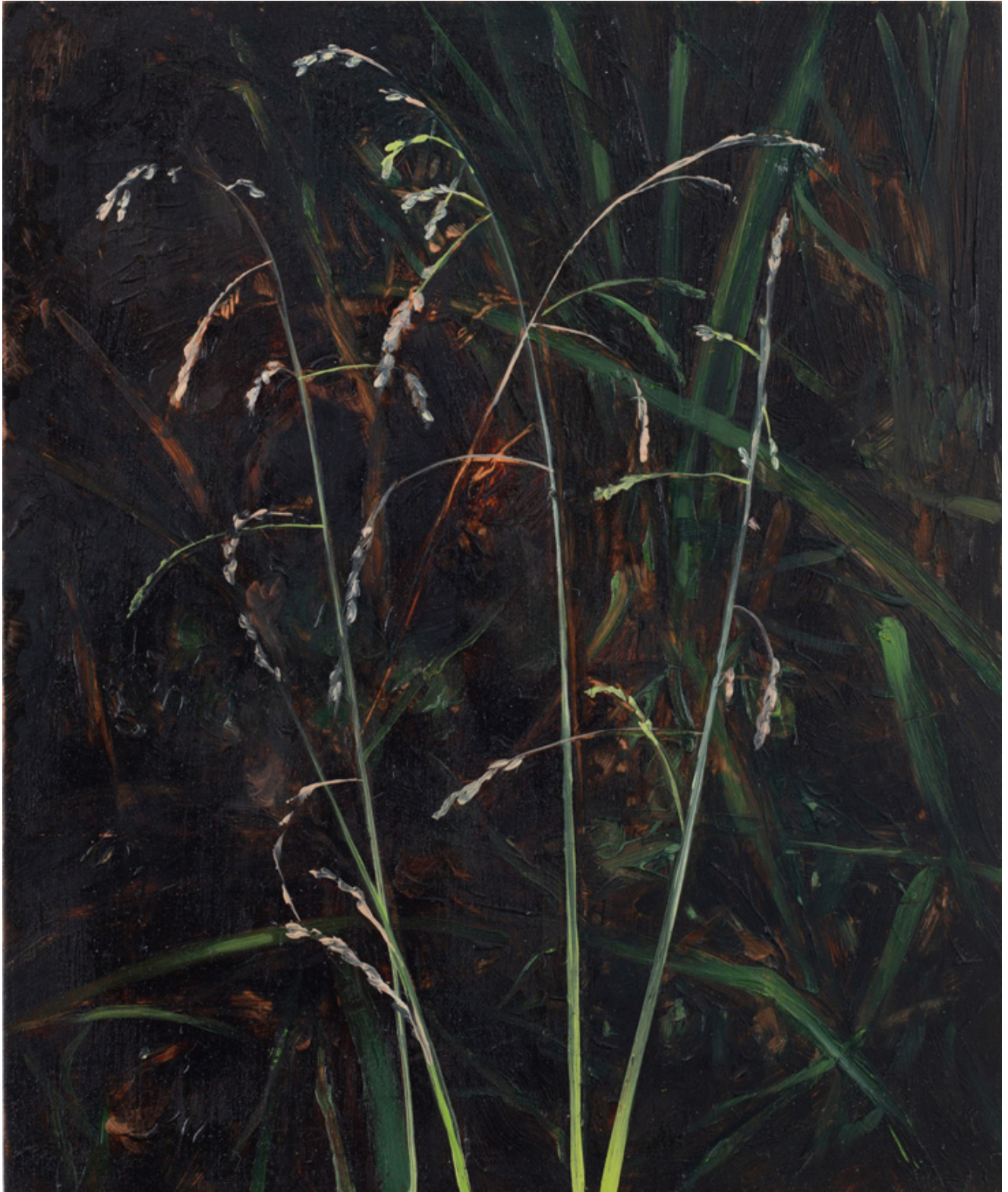
Julien AUDEBERT Glycérie striée , 2019 Huile sur cuivre Oil on copper 18 x 15 cm (7 1/8 x 5 7/8 in.) (Vendu)

Art : Concept 4 passage Sainte-Avoye, Paris 0033 1 53 60 90 30 www.galerieartconcept.com