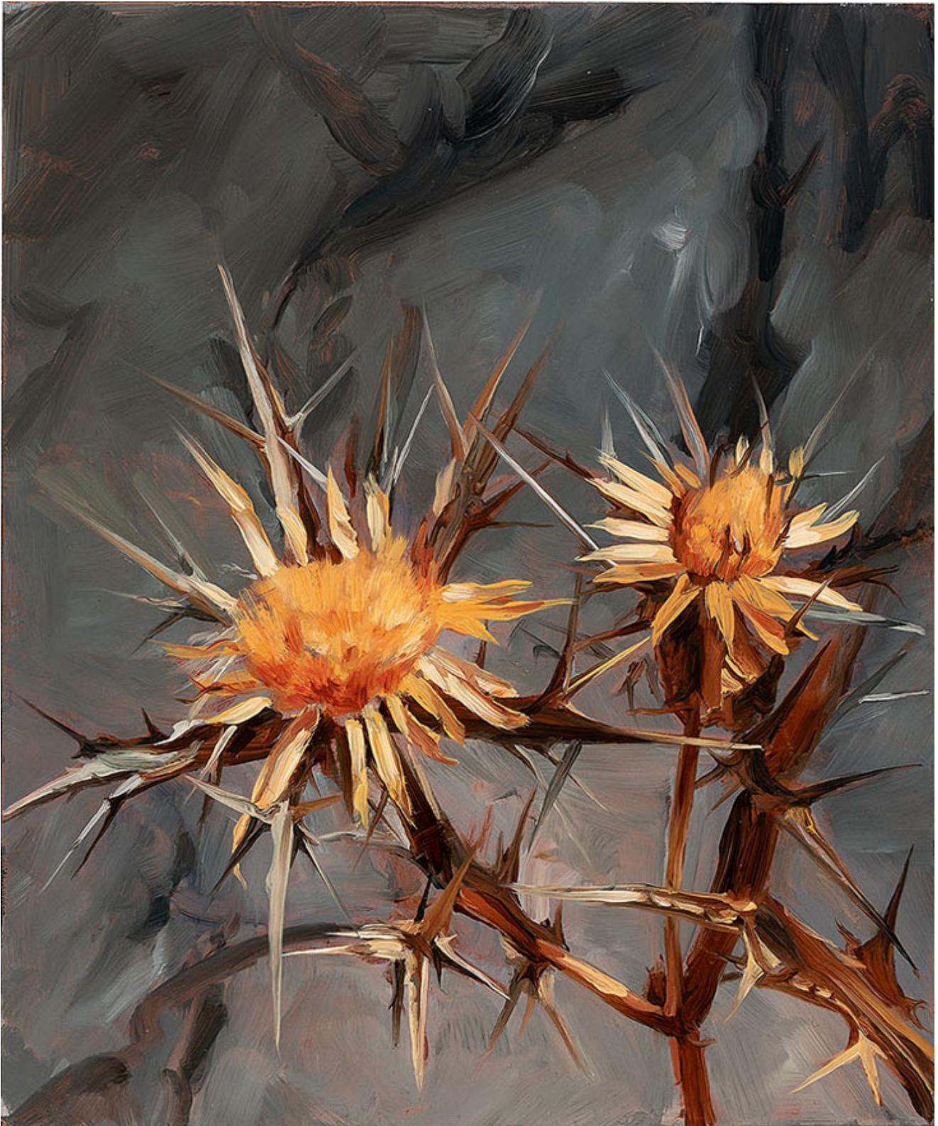
Julien AUDEBERT Carline en corymbe , 2019 Huile sur cuivre Oil on copper 18 x 15 cm (7 1/8 x 5 7/8 in.) (Vendu)

Art : Concept 4 passage Sainte-Avoye, Paris 0033 1 53 60 90 30 www.galerieartconcept.com