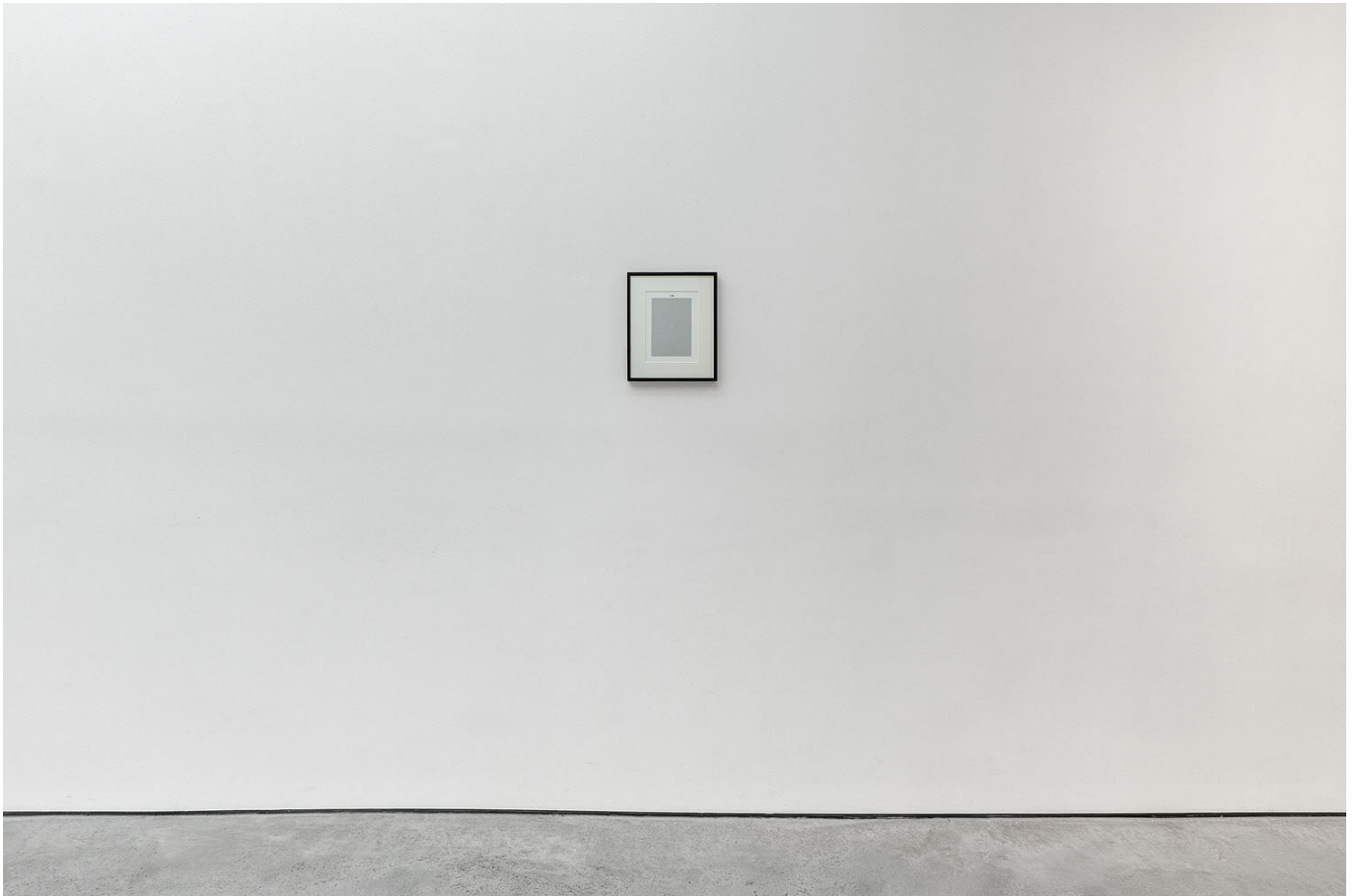
Julien Audebert, Inclusion (1798) , 2020, tirage photographique par contact sur papier barité, 17 x 12 cm, ed 1/5. Julien Audebert, Inclusion (1798) , 2020, contact printing on barytine paper, 6 3/4 x 4 3/4 in., ed 1/5.

Art : Concept 4 passage Sainte-Avoye, Paris 0033 1 53 60 90 30 www.galerieartconcept.com