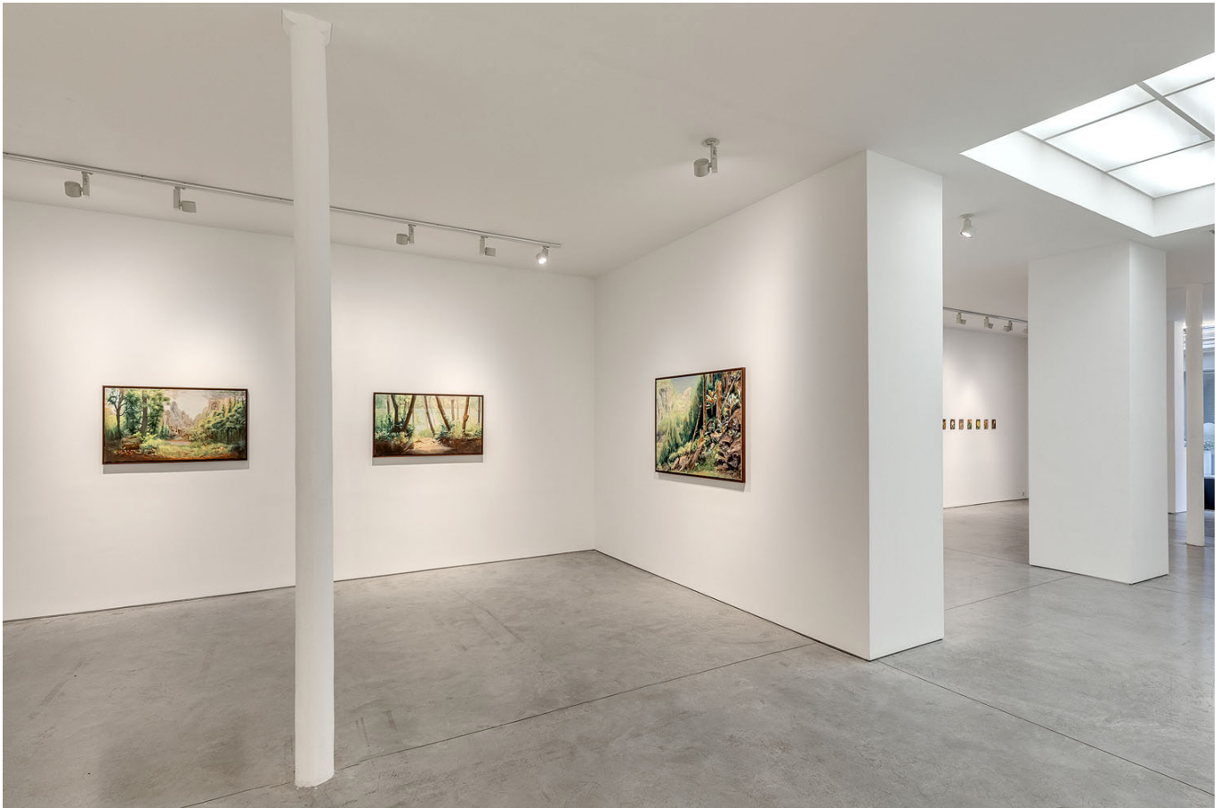
Another green world , Vue d'exposition, Art : Concept, Paris, 23 janvier - 29 février 2020 Another green world , Installation view, Art : Concept, Paris, 23 January - 29 February 2020

Art : Concept 4 passage Sainte-Avoye, Paris 0033 1 53 60 90 30 www.galerieartconcept.com