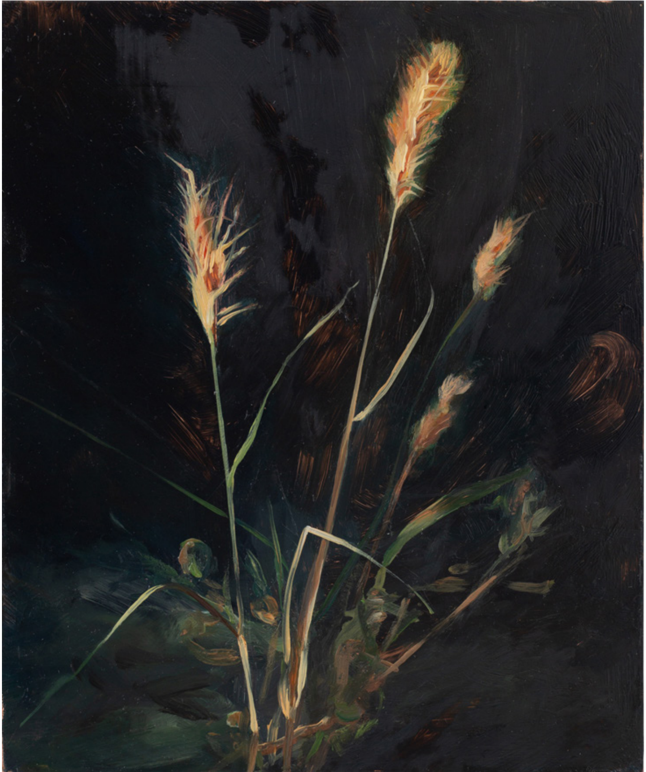
Julien AUDEBERT Brome à balais , 2019 Huile sur cuivre Oil on copper 18 x 15 cm (7 1/8 x 5 7/8 in.)

Art : Concept 4 passage Sainte-Avoye, Paris 0033 1 53 60 90 30 www.galerieartconcept.com