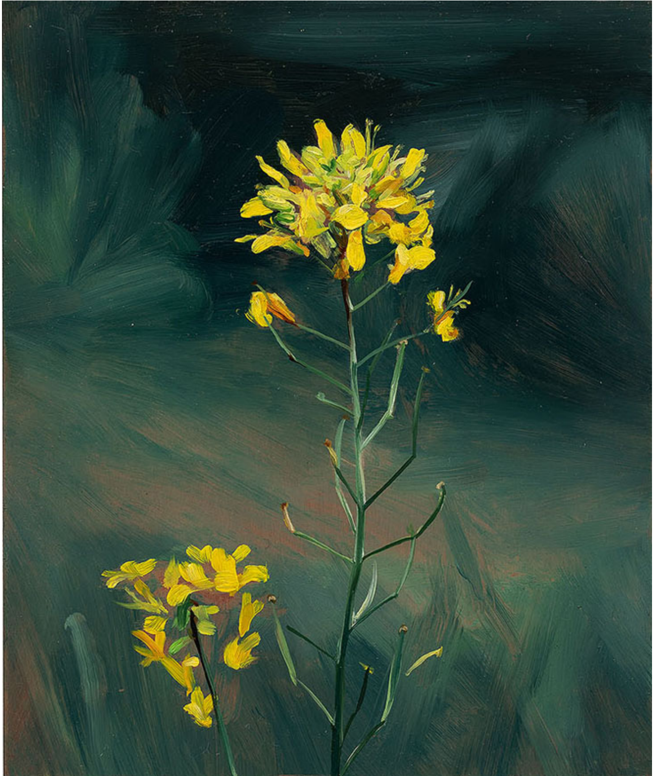
Julien AUDEBERT Fausse roquette à feuille de cresson , 2019 Huile sur cuivre Oil on copper 18 x 15 cm (7 1/8 x 5 7/8 in.)

Art : Concept 4 passage Sainte-Avoye, Paris 0033 1 53 60 90 30 www.galerieartconcept.com