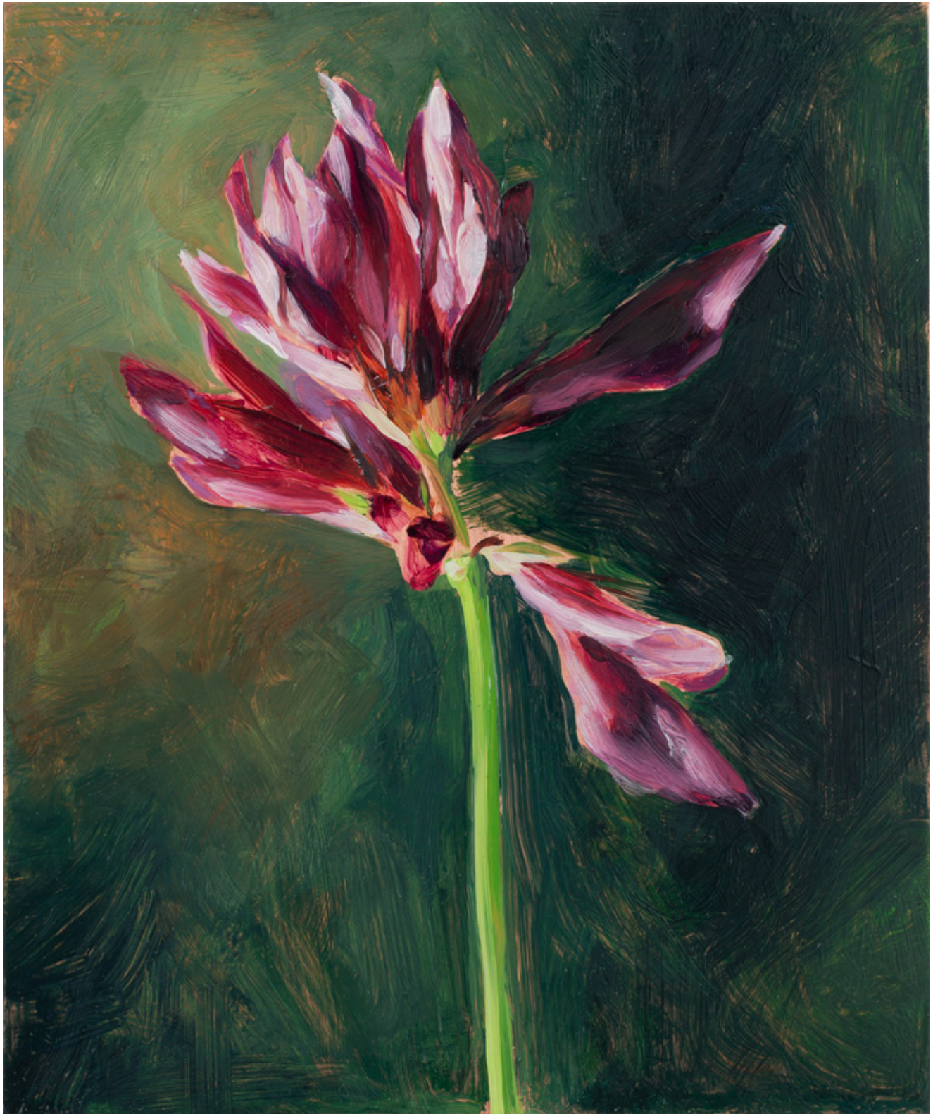
Julien AUDEBERT Trèfle alpin , 2019 Huile sur cuivre Oil on copper 18 x 15 cm (7 1/8 x 5 7/8 in.) (Vendu)

Art : Concept 4 passage Sainte-Avoye, Paris 0033 1 53 60 90 30 www.galerieartconcept.com