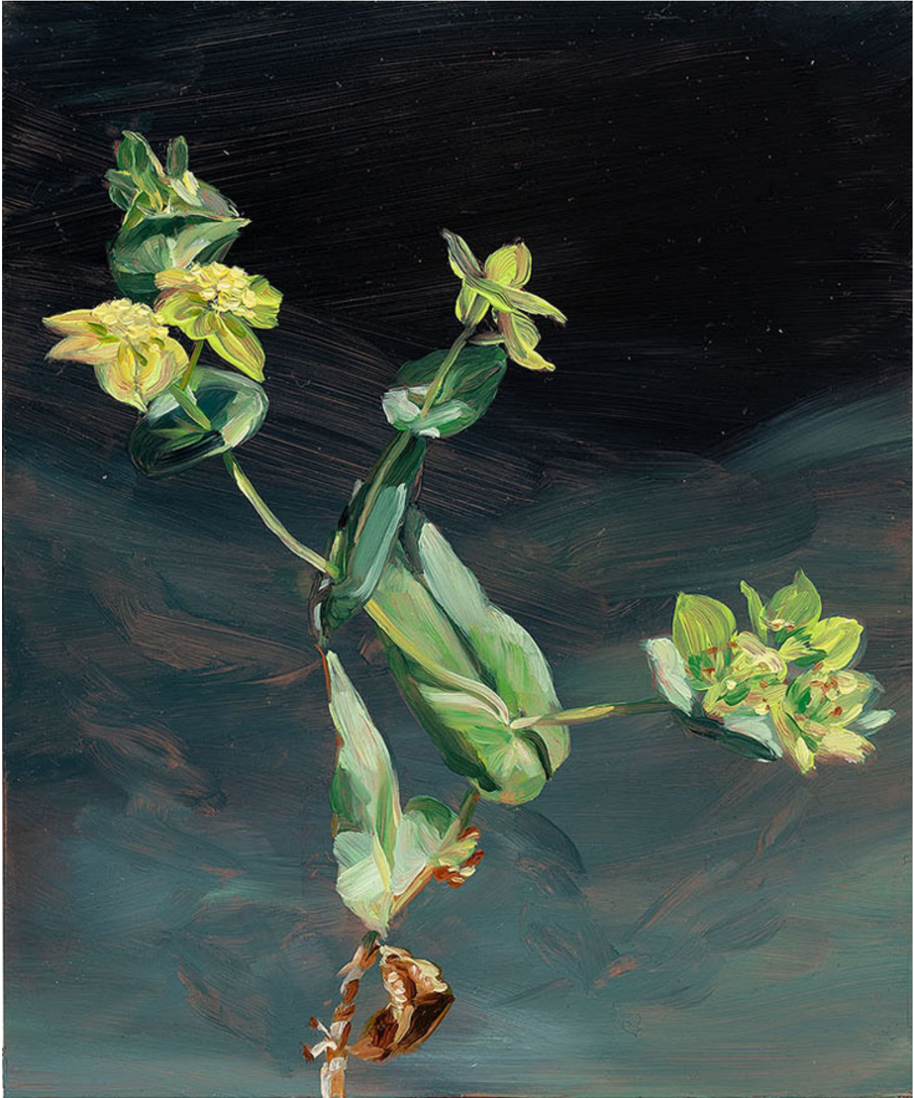
Julien AUDEBERT Buplèvre ovale , 2019 Huile sur cuivre Oil on copper 18 x 15 cm (7 1/8 x 5 7/8 in.)

Art : Concept 4 passage Sainte-Avoye, Paris 0033 1 53 60 90 30 www.galerieartconcept.com