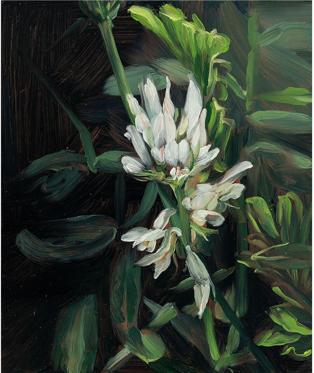
Julien AUDEBERT Astragale à gousse en hameçon , 2019 Huile sur cuivre Oil on copper 18 x 15 cm (7 1/8 x 5 7/8 in.) (Vendu)

Art : Concept 4 passage Sainte-Avoye, Paris 0033 1 53 60 90 30 www.galerieartconcept.com