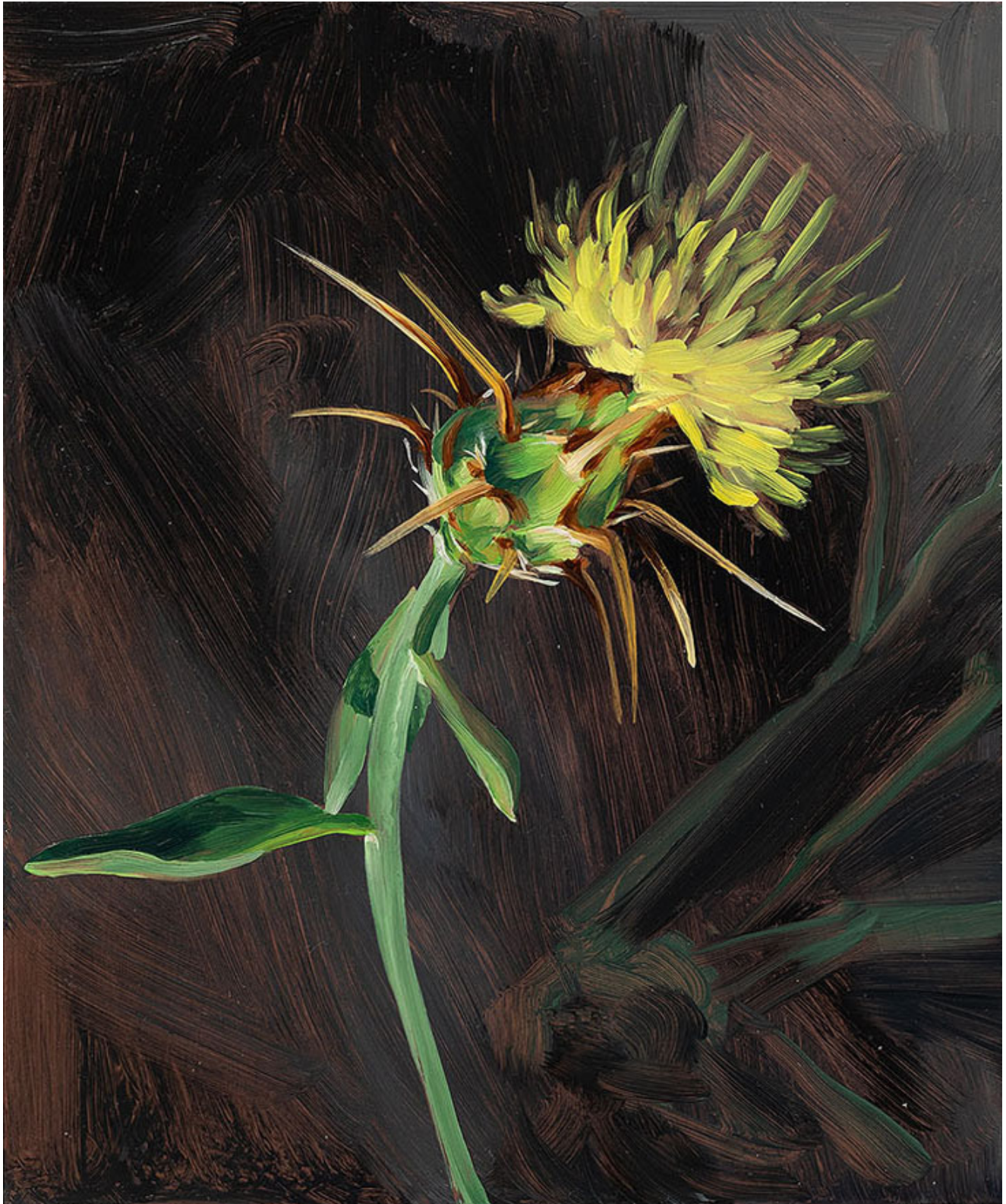
Julien AUDEBERT Centauree de Nice , 2019 Huile sur cuivre Oil on copper 18 x 15 cm (7 1/8 x 5 7/8 in.)

Art : Concept 4 passage Sainte-Avoye, Paris 0033 1 53 60 90 30 www.galerieartconcept.com