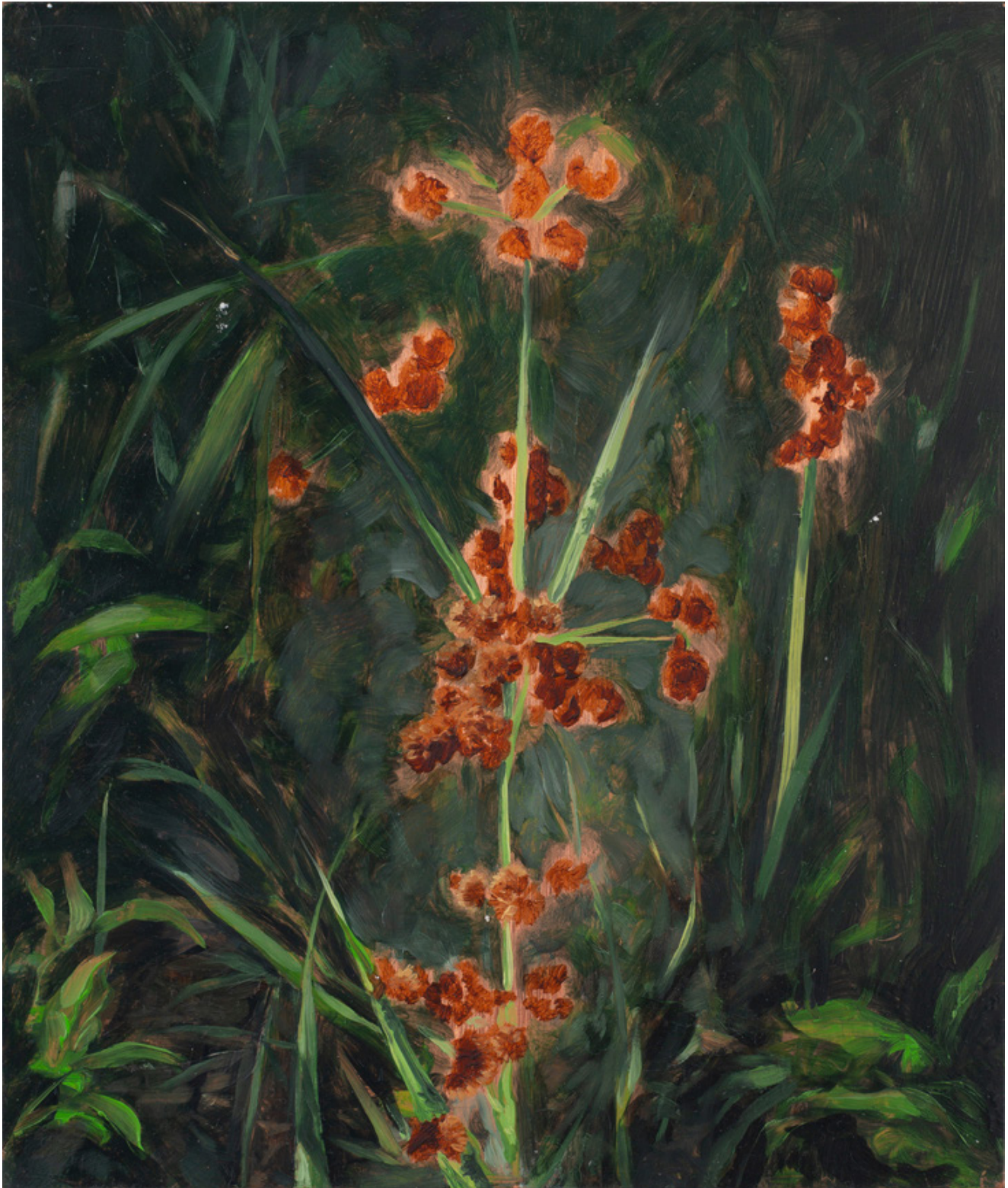
Julien AUDEBERT Scirpe vert sombre , 2019 Huile sur cuivre Oil on copper 18 x 15 cm (7 1/8 x 5 7/8 in.) (Vendu)

Art : Concept 4 passage Sainte-Avoye, Paris 0033 1 53 60 90 30 www.galerieartconcept.com