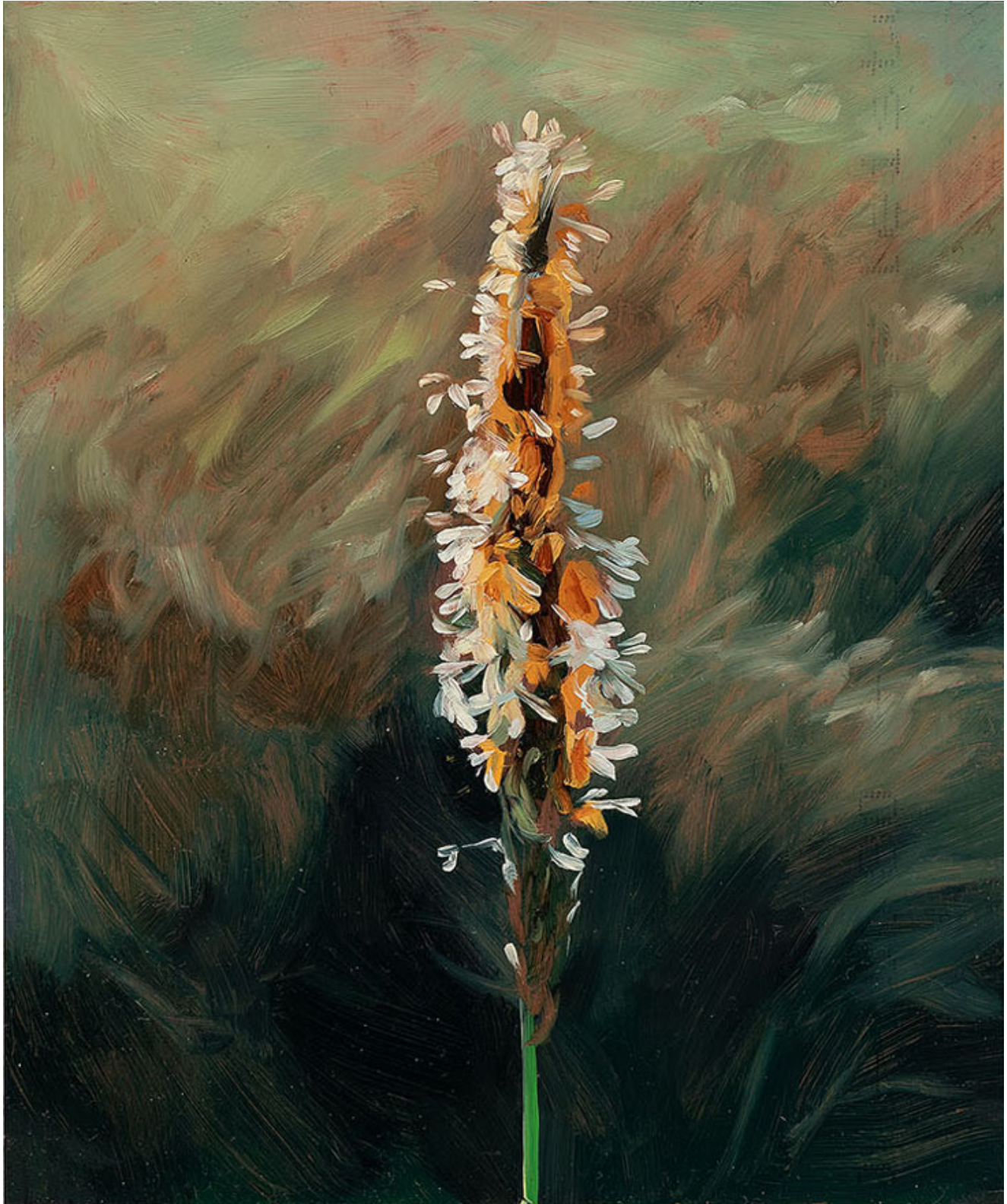
Julien AUDEBERT Vulpin bulbeux , 2019 Huile sur cuivre Oil on copper 18 x 15 cm (7 1/8 x 5 7/8 in.) (Vendu)

Art : Concept 4 passage Sainte-Avoye, Paris 0033 1 53 60 90 30 www.galerieartconcept.com