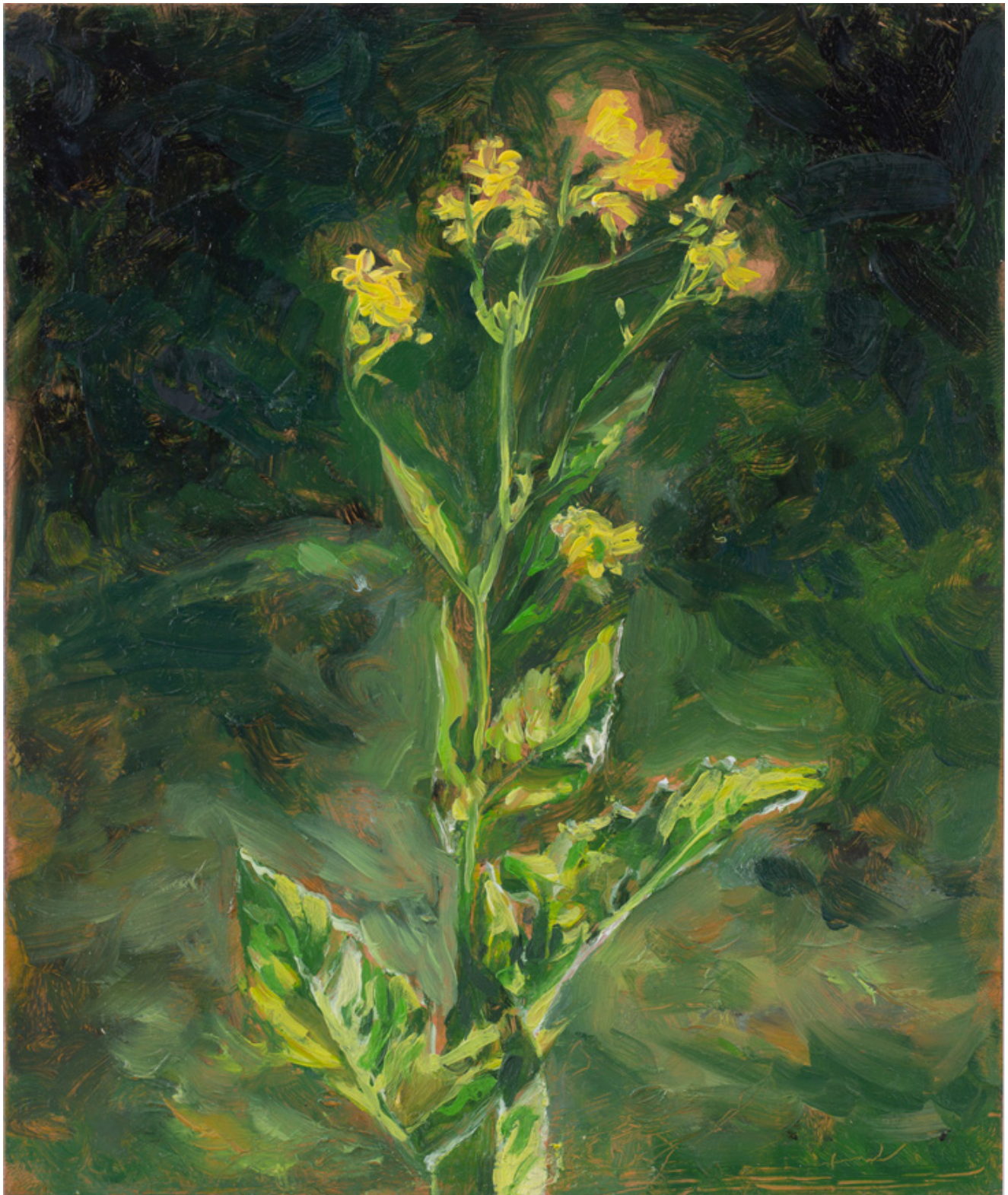
Julien AUDEBERT Roquette d'orient , 2019 Huile sur cuivre Oil on copper 18 x 15 cm (7 1/8 x 5 7/8 in.) (Vendu)

Art : Concept 4 passage Sainte-Avoye, Paris 0033 1 53 60 90 30 www.galerieartconcept.com