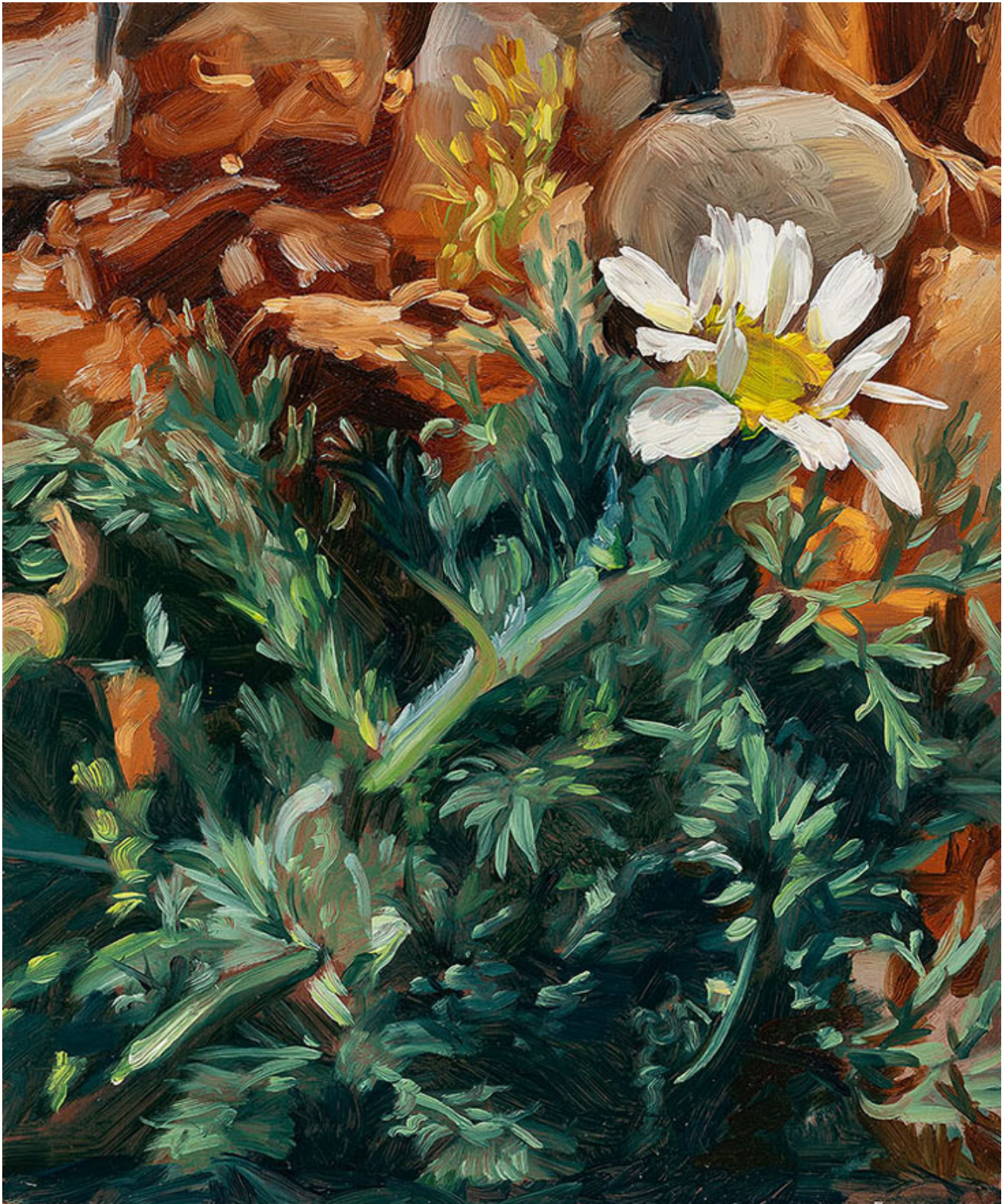
Julien AUDEBERT Anacycle en massue , 2019 Huile sur cuivre Oil on copper 18 x 15 cm (7 1/8 x 5 7/8 in.)

Art : Concept 4 passage Sainte-Avoye, Paris 0033 1 53 60 90 30 www.galerieartconcept.com