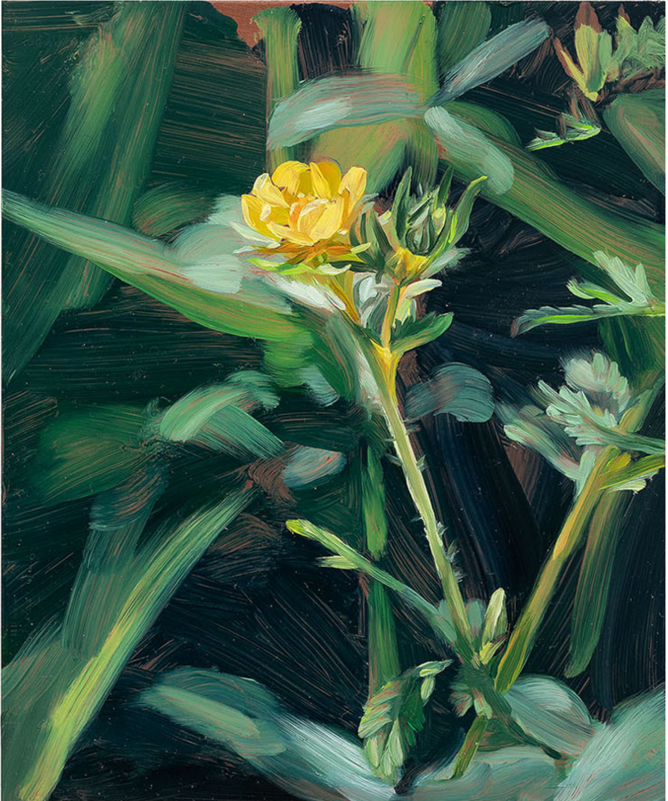
Julien AUDEBERT Potentille droite , 2019 Huile sur cuivre Oil on copper 18 x 15 cm (7 1/8 x 5 7/8 in.)

Art : Concept 4 passage Sainte-Avoye, Paris 0033 1 53 60 90 30 www.galerieartconcept.com