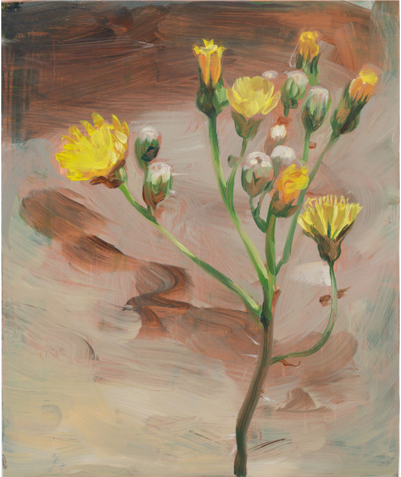
Julien AUDEBERT Epervière de Bauhin , 2019 Huile sur cuivre Oil on copper 18 x 15 cm (7 1/8 x 5 7/8 in.)

Art : Concept 4 passage Sainte-Avoye, Paris 0033 1 53 60 90 30 www.galerieartconcept.com