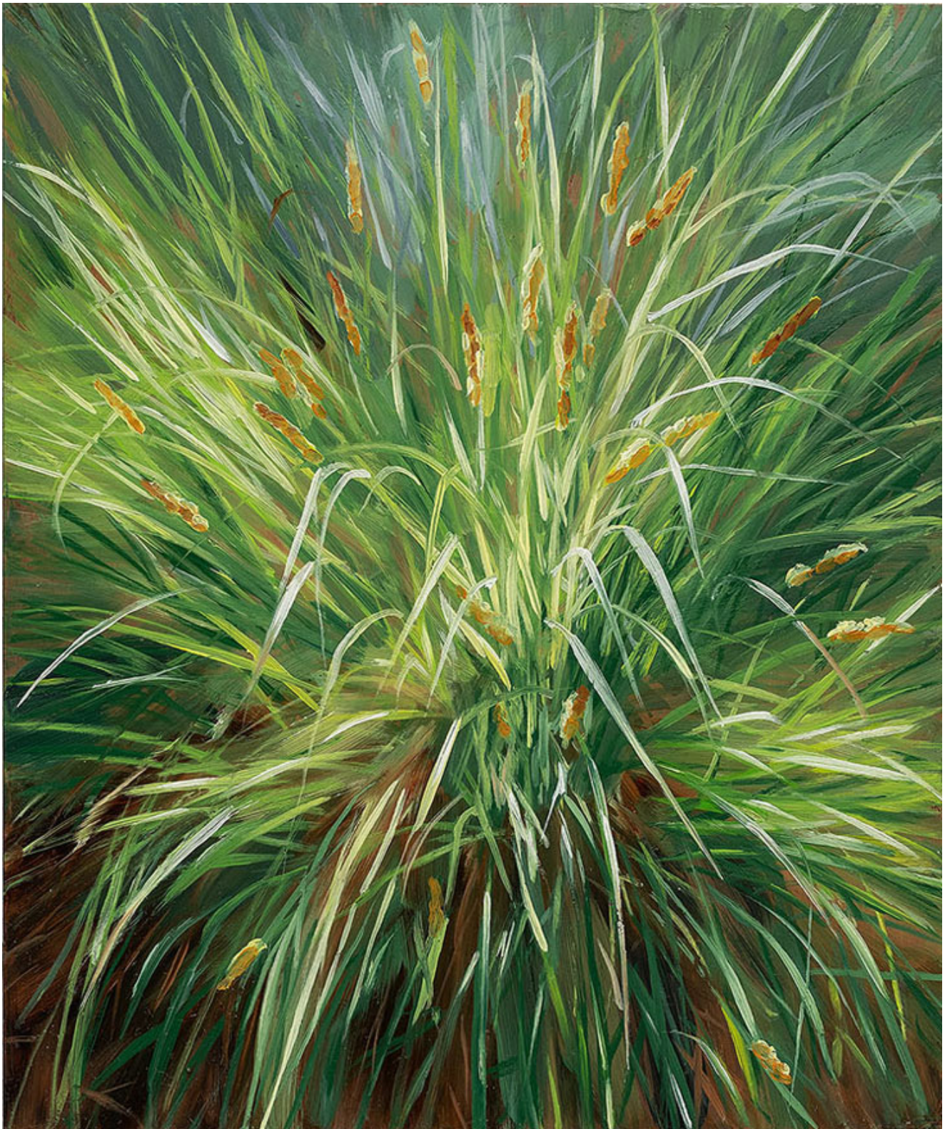
Julien AUDEBERT Fausse laïche des renards , 2019 Huile sur cuivre Oil on copper 18 x 15 cm (7 1/8 x 5 7/8 in.) (Vendu)

Art : Concept 4 passage Sainte-Avoye, Paris 0033 1 53 60 90 30 www.galerieartconcept.com