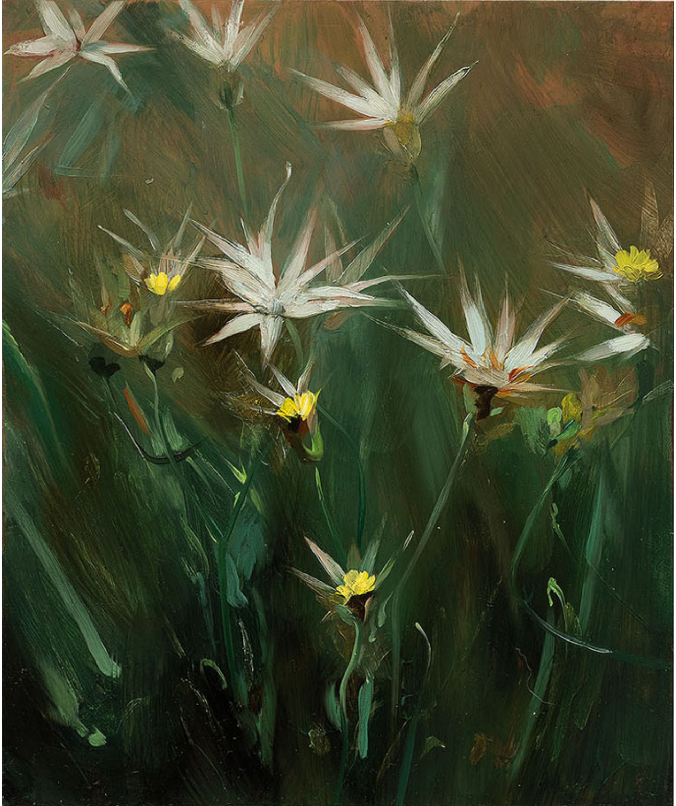
Julien AUDEBERT Catalanche jaune , 2019 Huile sur cuivre Oil on copper 18 x 15 cm (7 1/8 x 5 7/8 in.)

Art : Concept 4 passage Sainte-Avoye, Paris 0033 1 53 60 90 30 www.galerieartconcept.com