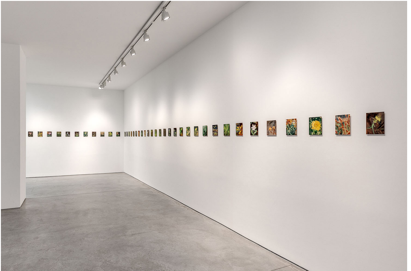
Another green world , Vue d'exposition, Art : Concept, Paris, 23 janvier - 29 février 2020 Another green world , Installation view, Art : Concept, Paris, 23 January - 29 February 2020

Art : Concept 4 passage Sainte-Avoye, Paris 0033 1 53 60 90 30 www.galerieartconcept.com