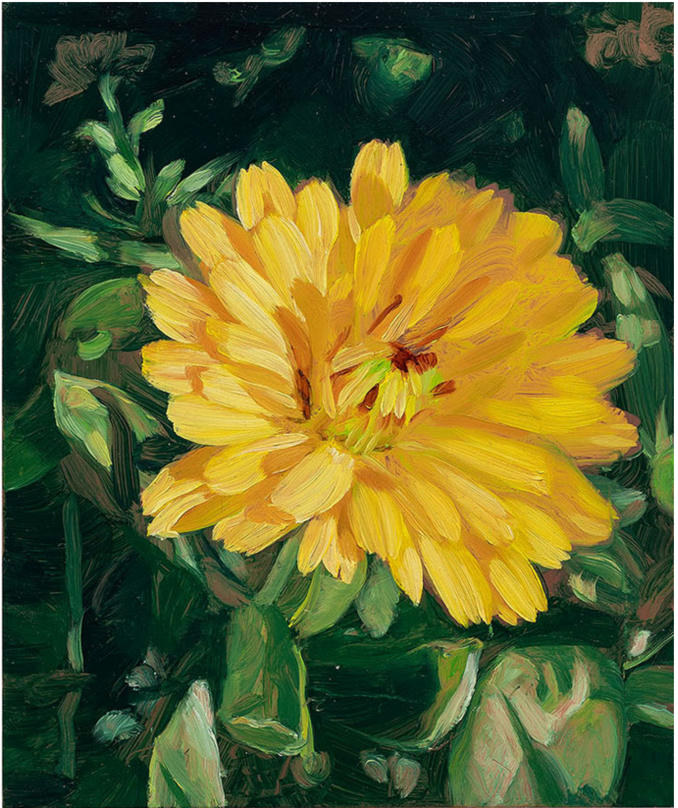
Julien AUDEBERT Souci étoilé , 2019 Huile sur cuivre Oil on copper 18 x 15 cm (7 1/8 x 5 7/8 in.)

Art : Concept 4 passage Sainte-Avoye, Paris 0033 1 53 60 90 30 www.galerieartconcept.com