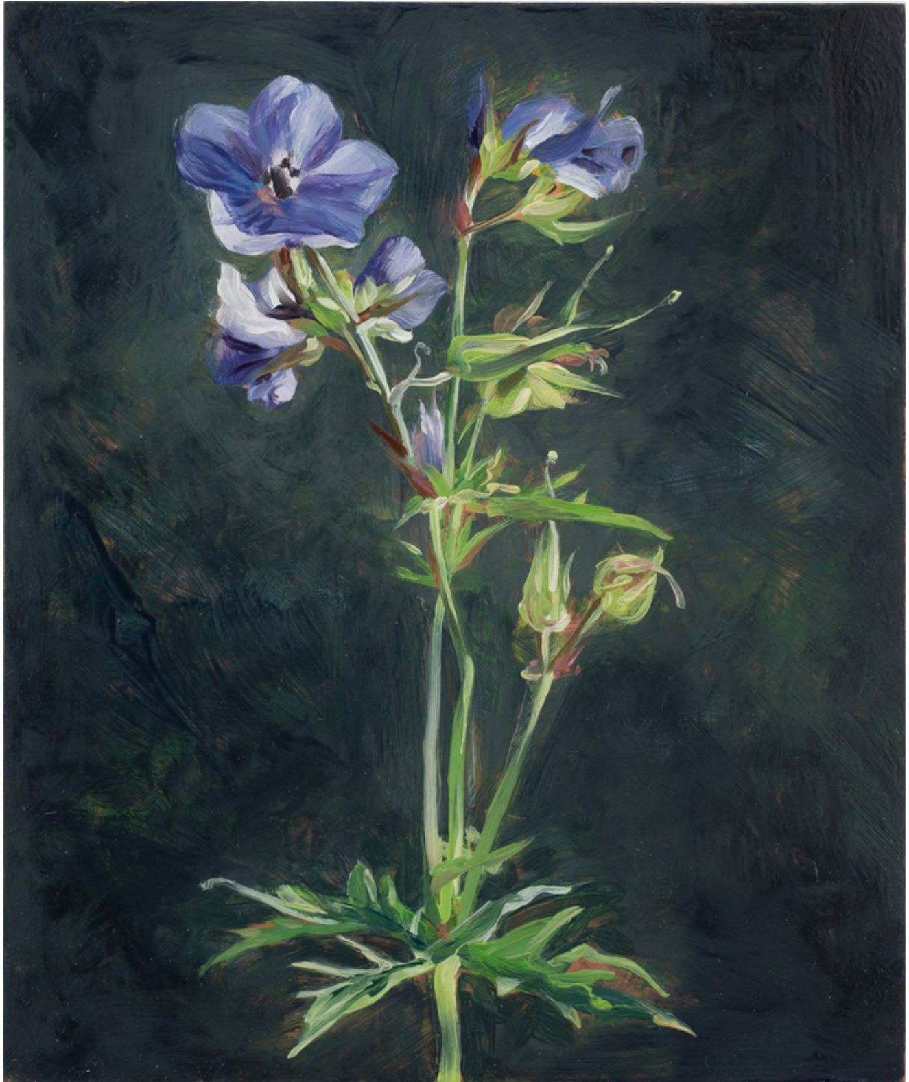
Julien AUDEBERT Géranium des prés , 2019 Huile sur cuivre Oil on copper 18 x 15 cm (7 1/8 x 5 7/8 in.)

Art : Concept 4 passage Sainte-Avoye, Paris 0033 1 53 60 90 30 www.galerieartconcept.com