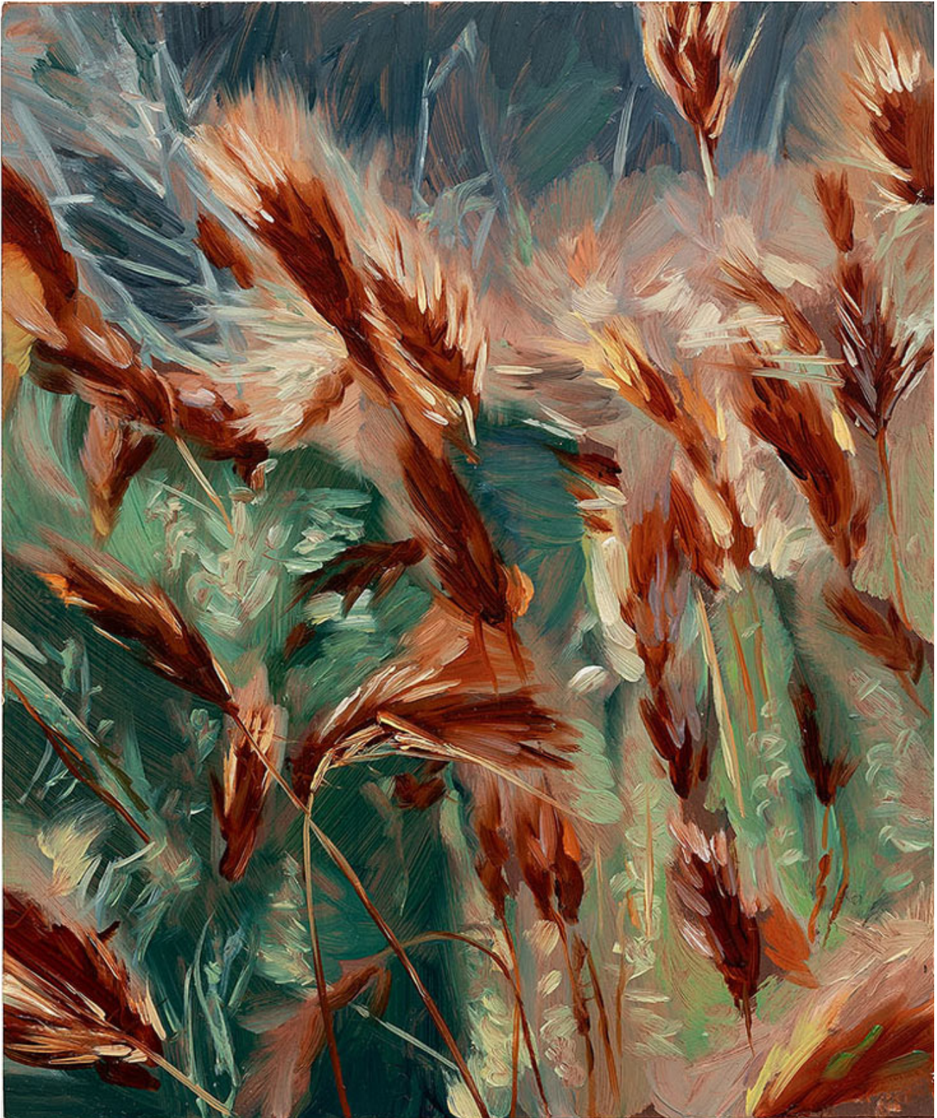
Julien AUDEBERT Bromus rubens (Brome rouge) , 2019 Huile sur cuivre Oil on copper 18 x 15 cm (7 1/8 x 5 7/8 in.)

Art : Concept 4 passage Sainte-Avoye, Paris 0033 1 53 60 90 30 www.galerieartconcept.com