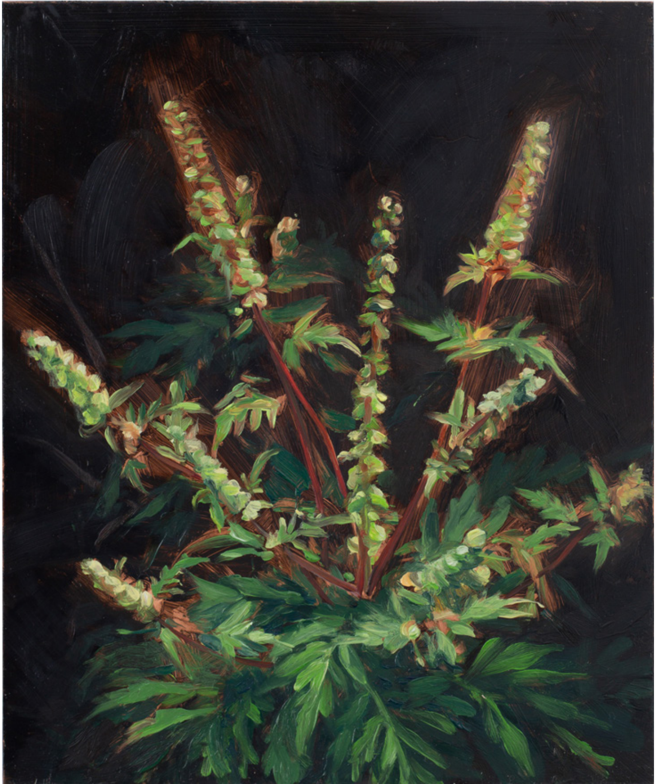
Julien AUDEBERT Ambrosia artemisiifolia (Ambrosie élevée) , 2019 Huile sur cuivre Oil on copper 18 x 15 cm (7 1/8 x 5 7/8 in.)

Art : Concept 4 passage Sainte-Avoye, Paris 0033 1 53 60 90 30 www.galerieartconcept.com