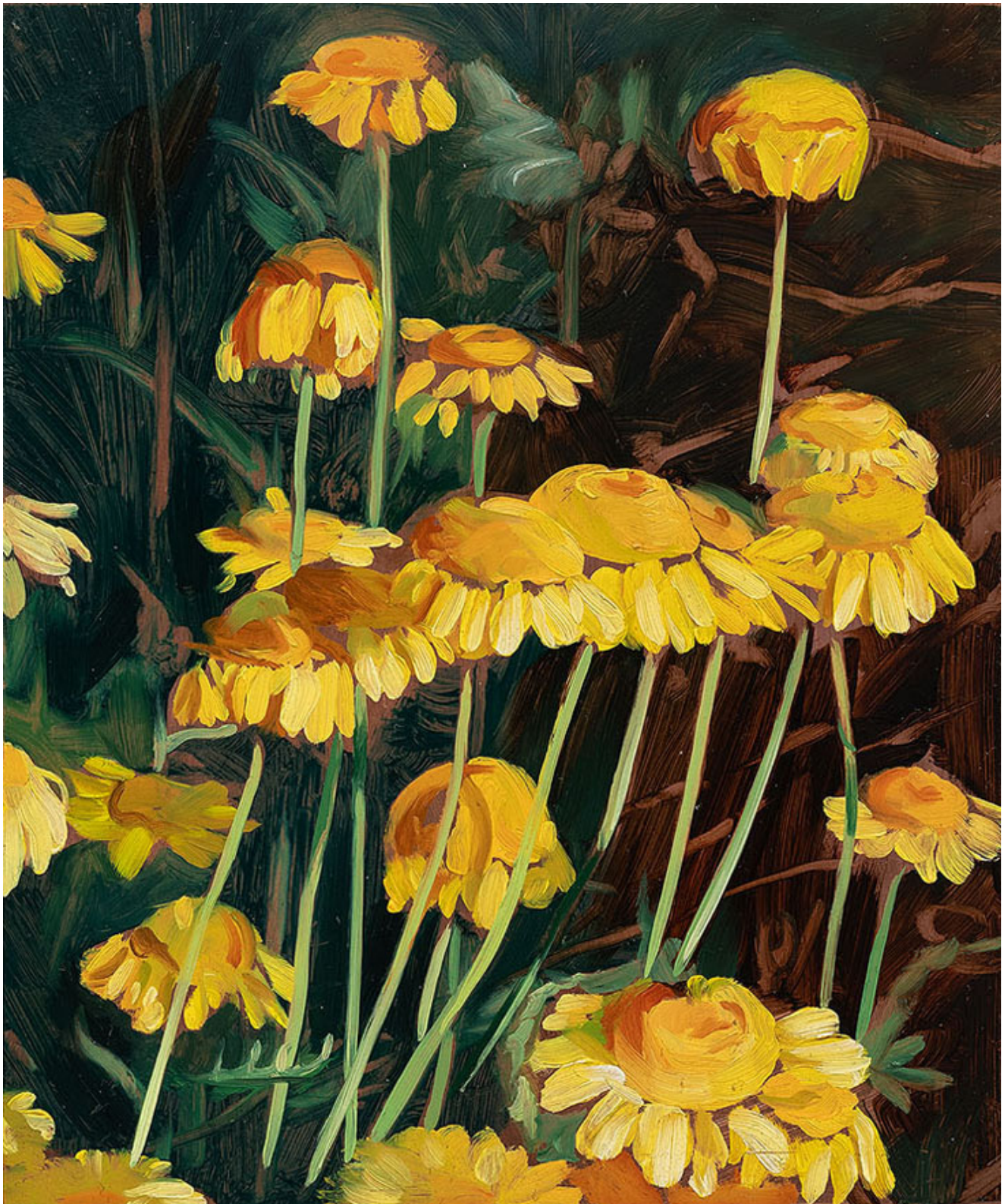
Julien AUDEBERT Anthémis tinctoria (Anthémis des teinturiers) , 2019 Huile sur cuivre Oil on copper 18 x 15 cm (7 1/8 x 5 7/8 in.)

Art : Concept 4 passage Sainte-Avoye, Paris 0033 1 53 60 90 30 www.galerieartconcept.com