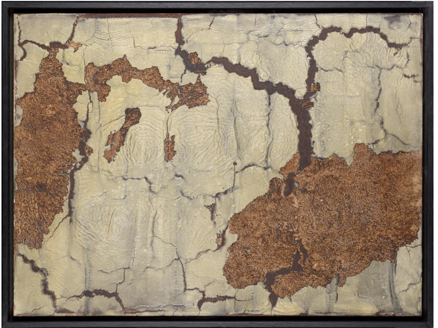
Sans titre 2011, oeufs, crème dessert au chocolat, farine, lait concentré sucré sur bois grignoté par des souris, 60 x 80 cm Sans titre , 2011, eggs, chocolate cream, flour, sweetened condensed milk on wood eaten by mice, 23 5/8 x 31 1/2 in