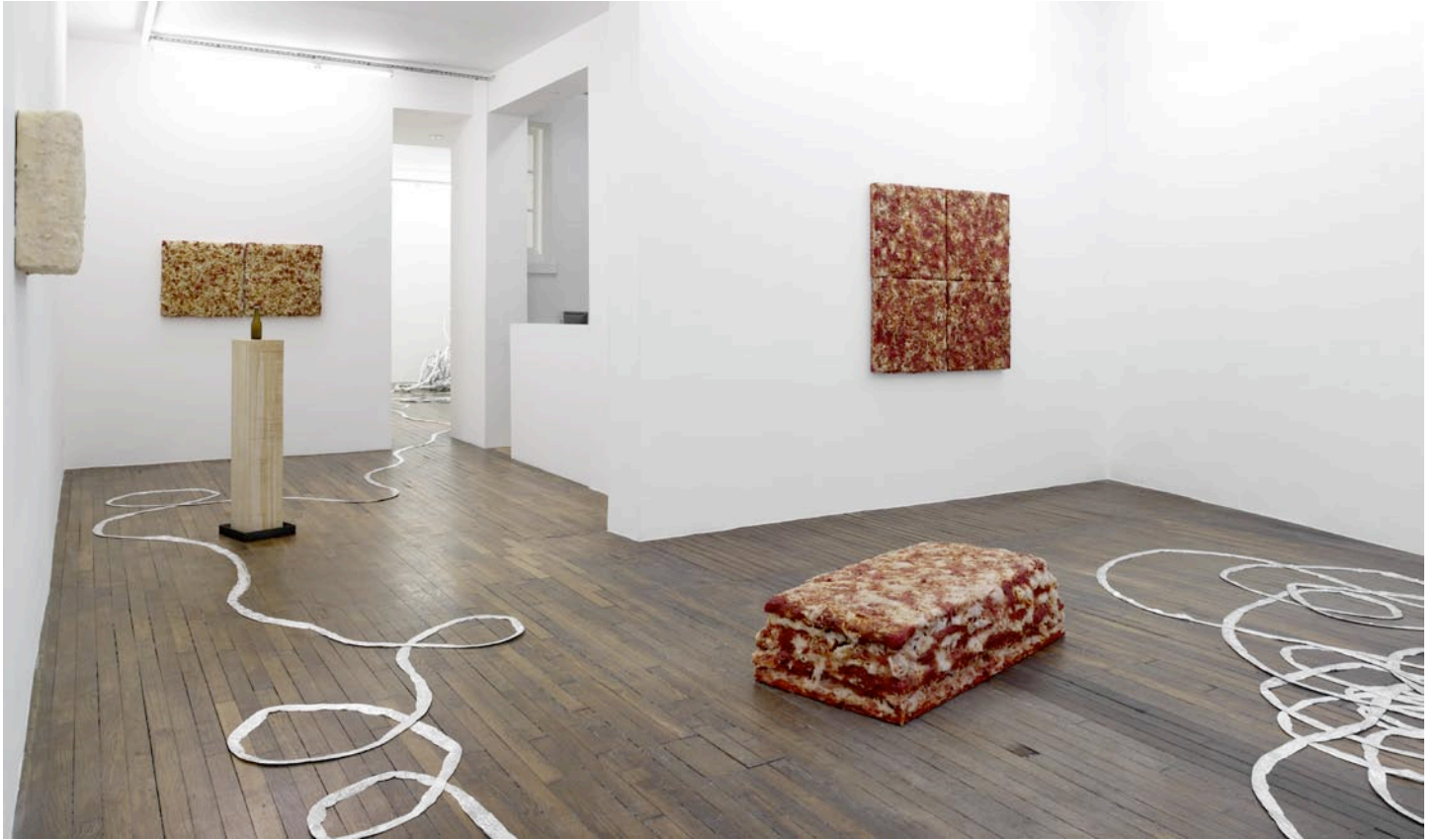
vue d'exposition, Débordement domestique , Art : Concept, Paris, 17 mars - 5 mai 2012 exhibition view, Débordement domestique , Art : Concept, Paris, 17th of March - 5th of May 2012