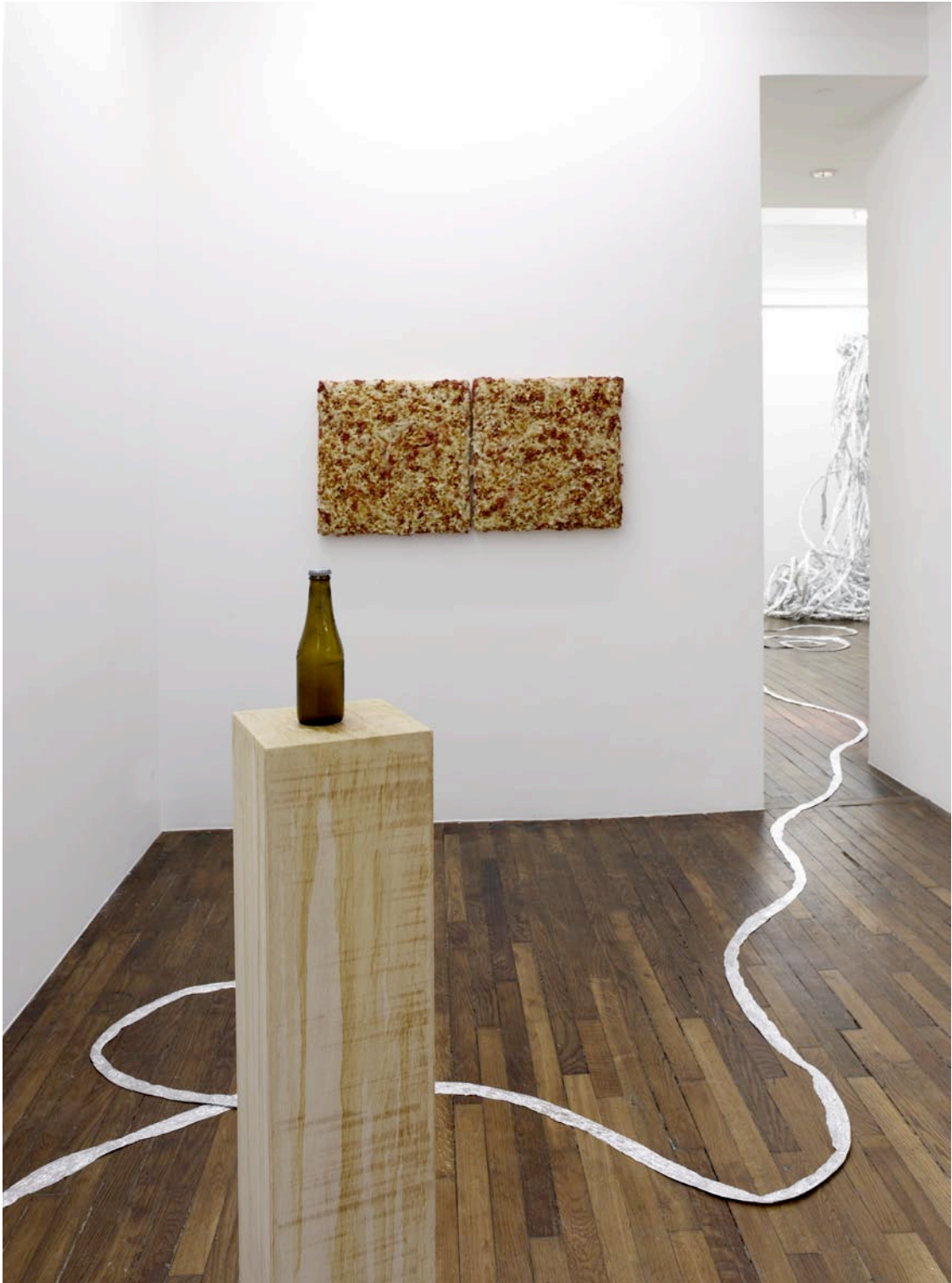
vue d'exposition, Débordement domestique , Art : Concept, Paris, 17 mars - 5 mai 2012 exhibition view, Débordement domestique , Art : Concept, Paris, 17th of March - 5th of May 2012