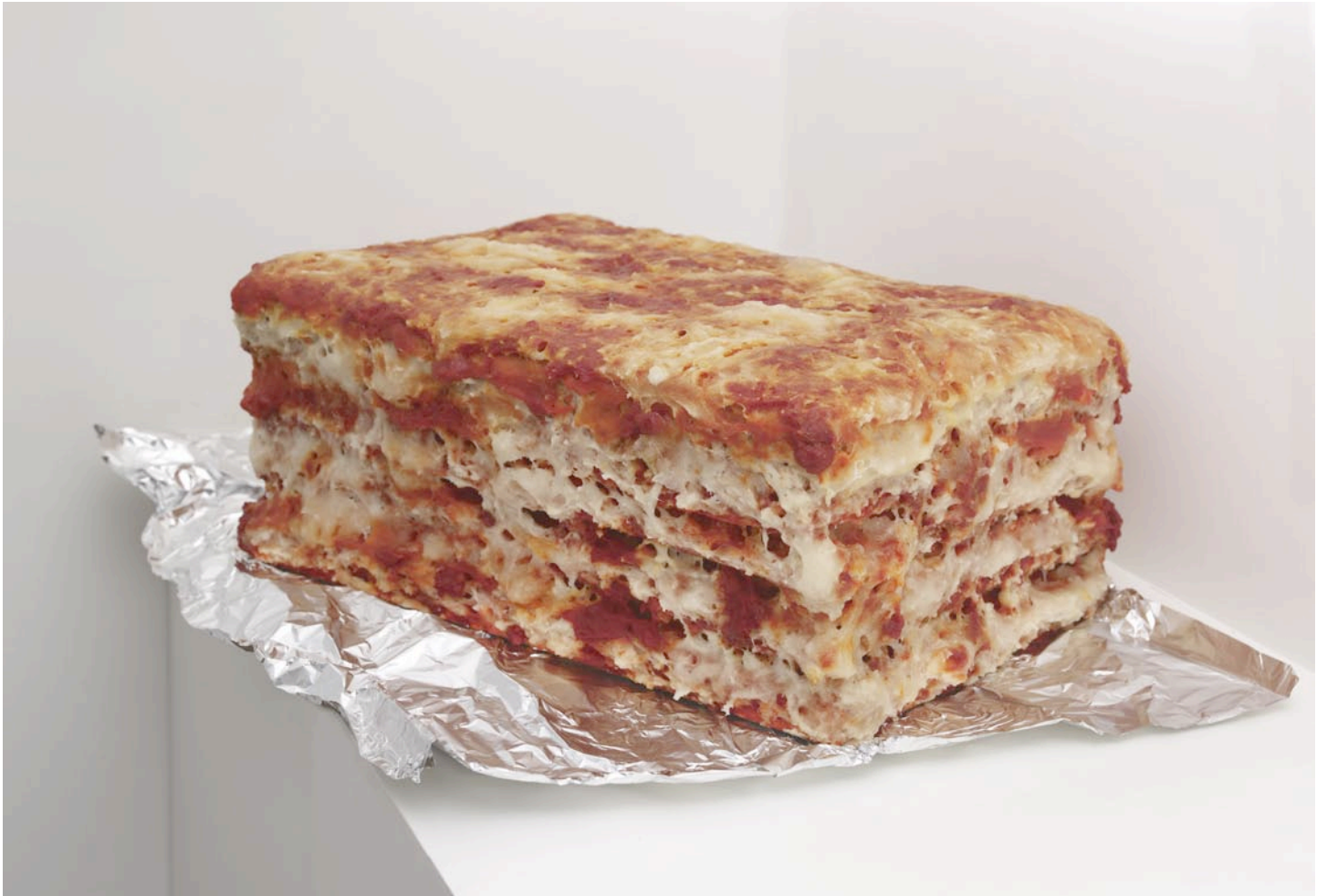
Une part de lasagne al forno, 2012

colle à papier peint, polystyrène extrudé, eau, colorants alimentaires, aluminium, arômes artificiels saveur pizza fromage fondu, 26 x 65 x 43 cm