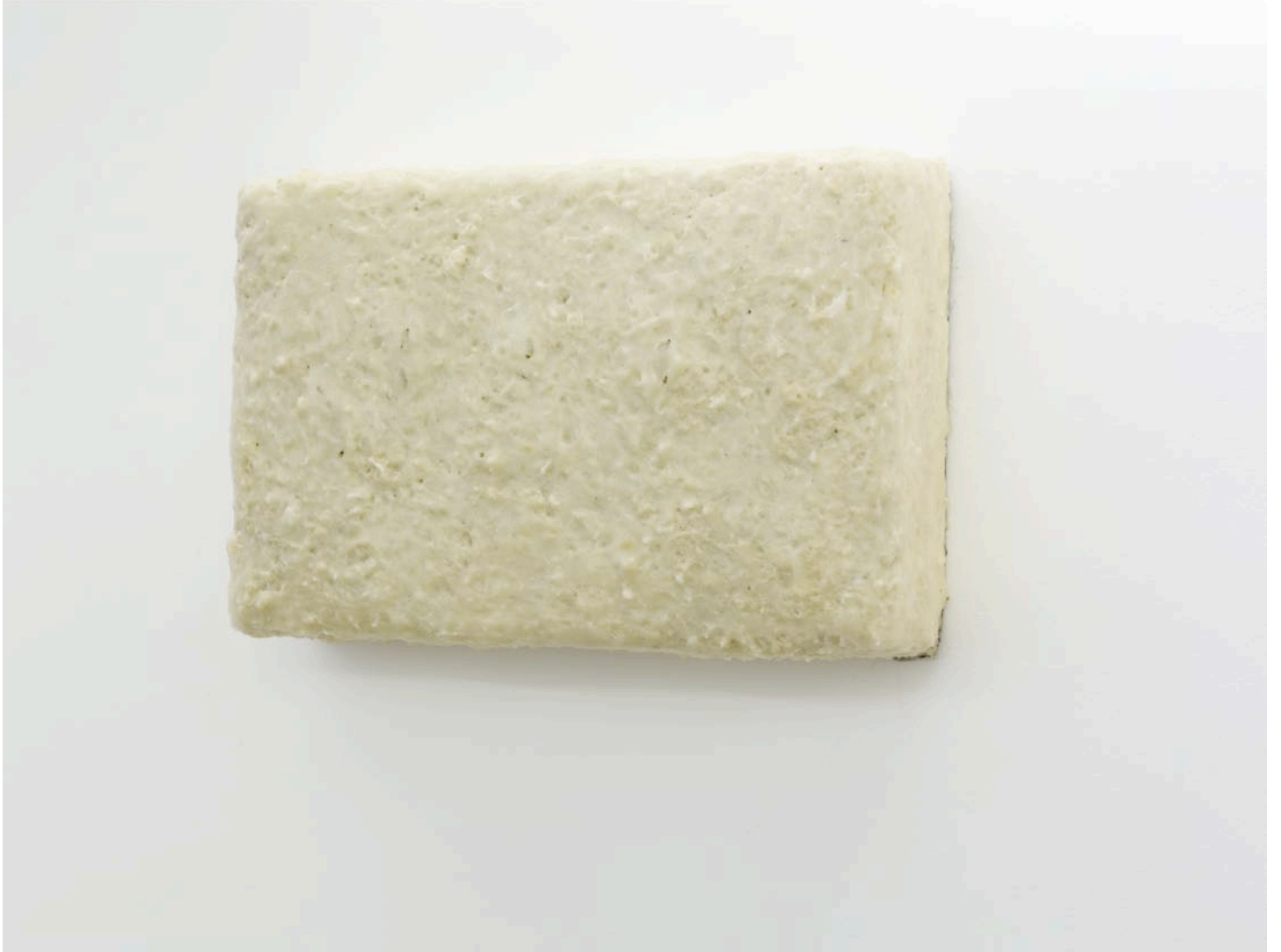
Surprise blanche, 2012

colle à papier peint, polystyrène extrudé, eau, sans colorant alimentaire, sans arôme artificiel, 40 x 60 x 3 cm, collection privée, Paris wallpaper glue, extruded polystyrene, water, without food coloring or artificial flavor, 15,7 x 23,6 x 1,1 in, private collection, Paris