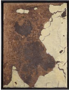
Sans titre, 2011 oeufs, crème dessert au chocolat, farine, lait concentré sucré sur bois grignoté par des souris 80 x 60 cm