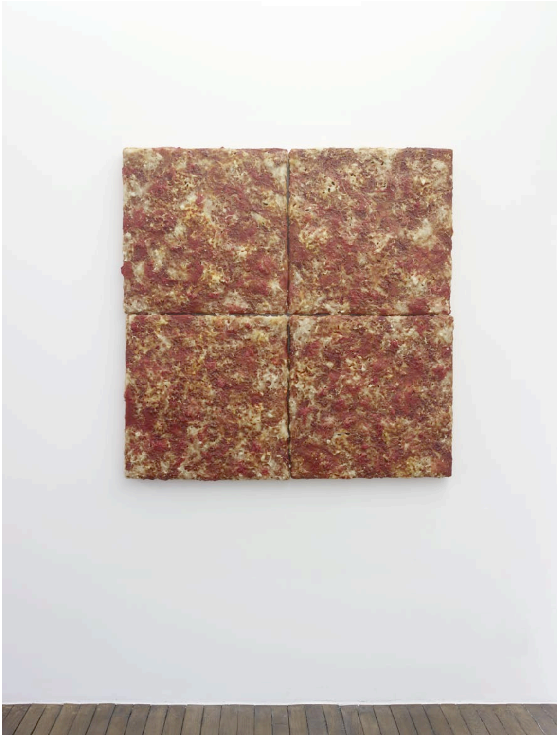
Marguerite , 2012

colle à papier peint, polystyrène extrudé, eau, colorants alimentaires, arômes artificiels saveur pizza fromage fondu, 122 x 122 x 8 cm collection privée, Paris