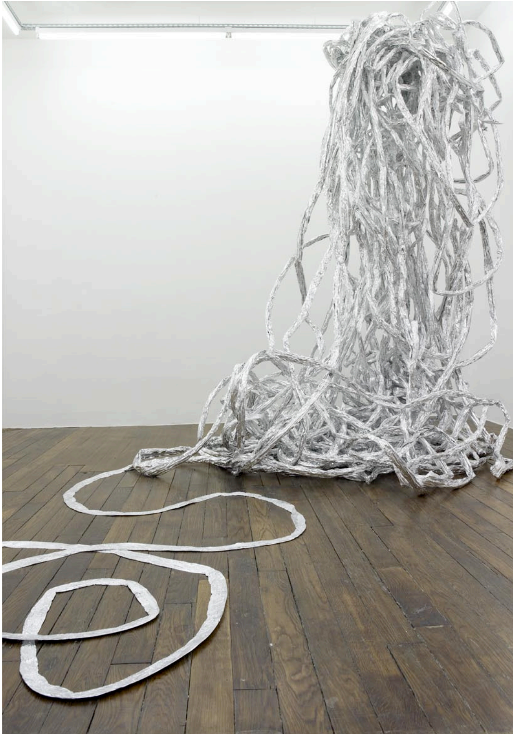
Trace brillante , 2012, papier aluminium, bois, dimensions variables Trace brillante , 2012, aluminum paper, wood, dimensions variable