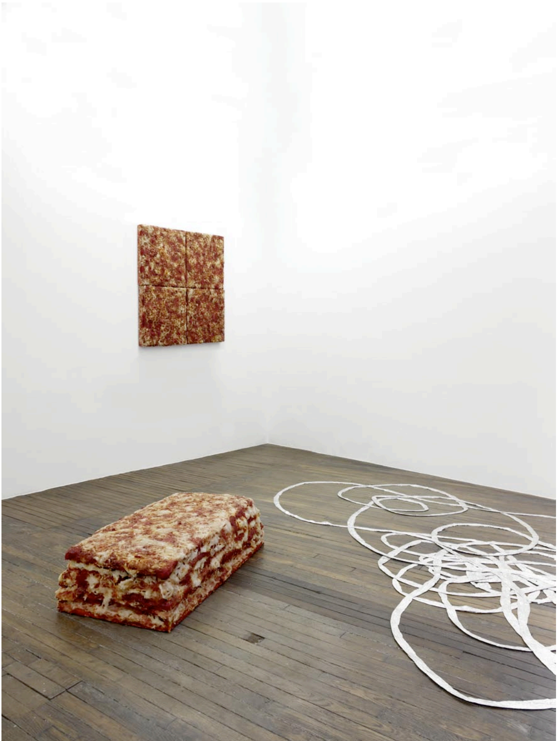
vue d'exposition, Débordement domestique , Art : Concept, Paris, 17 mars - 5 mai 2012 exhibition view, Débordement domestique , Art : Concept, Paris, 17th of March - 5th of May 2012