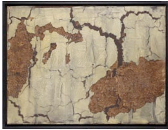
Sans titre, 2011 oeufs, crème dessert au choco- lat, farine, lait concentré sucré sur bois grignoté par des souris 60 x 80 cm