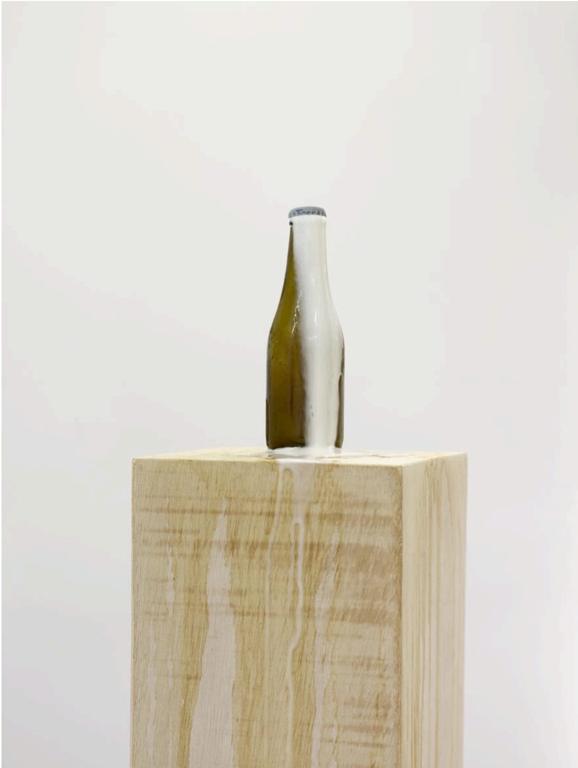
Fontaine , 2012, bière en bouteille, socle en bois, bière: 18,5 x 6 cm, socle: 110 x 20,5 x 20 Fontaine , 2012, bottle of beer, wooden base, bottle: 18,5 x 6 cm, base: 43 1/4 x 8 1/8 x 7 7/8 in