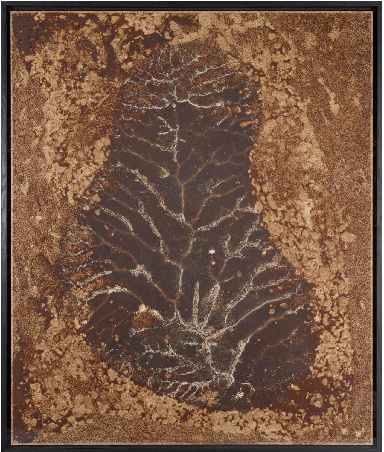
Barbacaen , 2010, crème dessert au chocolat, oeufs, chocolat en poudre, lait en poudre sur bois grignoté par des souris, 120 x 107 cm Barbacaen , 2010, chocolate cream, eggs, cocoa powder, milk powder on wood eaten by mouses, 47 1/4 x 42 1/8 in