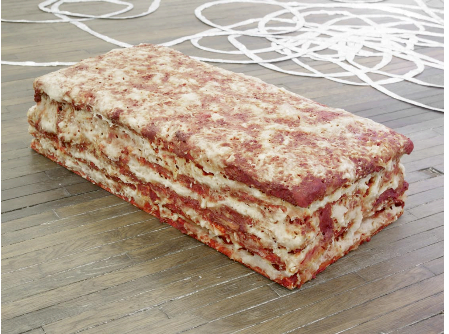
Lasagne al forno, 2012

colle à papier peint, polystyrène extrudé, eau, colorants alimentaires, arômes artificiels saveur pizza fromage fondu, 30 x 117 x 63 cm wallpaper glue, extruded polystyrene, water, food coloring, cheesy pizza artificial flavors, 11 3/4 x 46 1/8 x 24 3/4 in