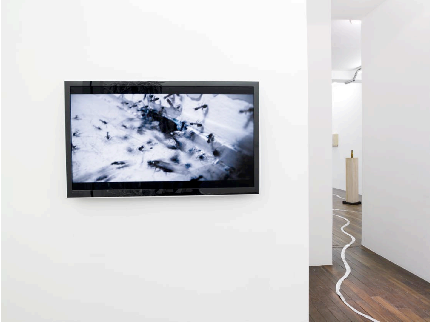
vue d'exposition, Débordement domestique , Art : Concept, Paris, 17 mars - 5 mai 2012 exhibition view, Débordement domestique , Art : Concept, Paris, 17th of March - 5th of May 2012