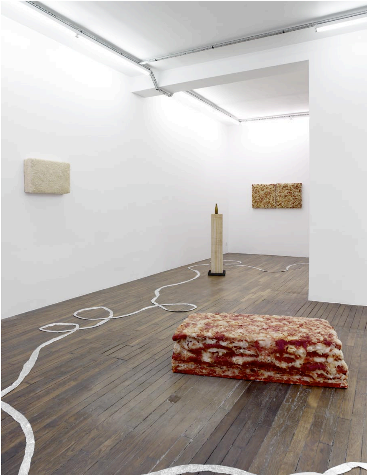
vue d'exposition, Débordement domestique , Art : Concept, Paris, 17 mars - 5 mai 2012 exhibition view, Débordement domestique , Art : Concept, Paris, 17th of March - 5th of May 2012