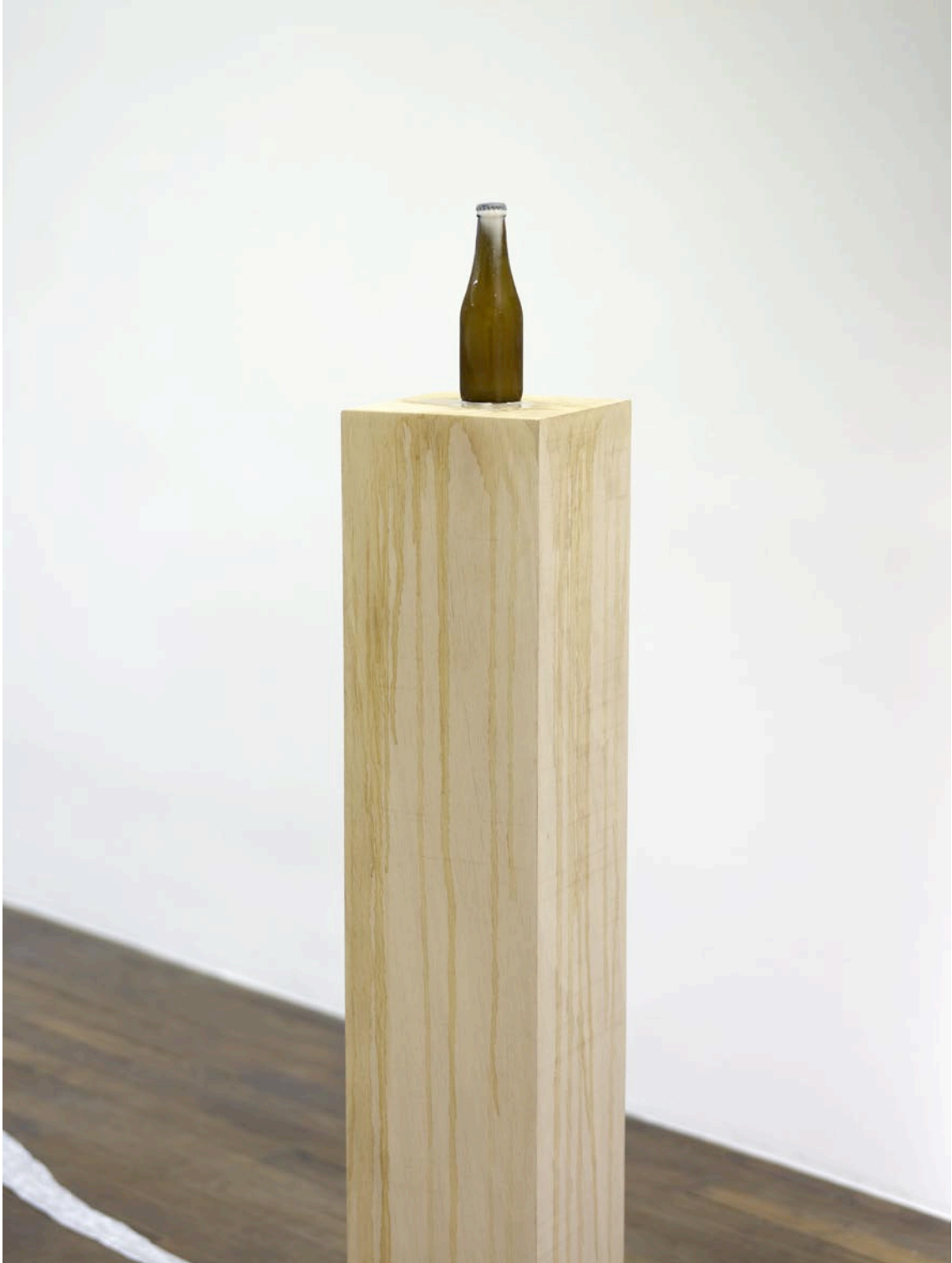
Fontaine , 2012, bière en bouteille, socle en bois, bière: 18,5 x 6 cm, socle: 110 x 20,5 x 20 Fontaine , 2012, bottle of beer, wooden base, bottle: 18,5 x 6 cm, base: 43 1/4 x 8 1/8 x 7 7/8 in