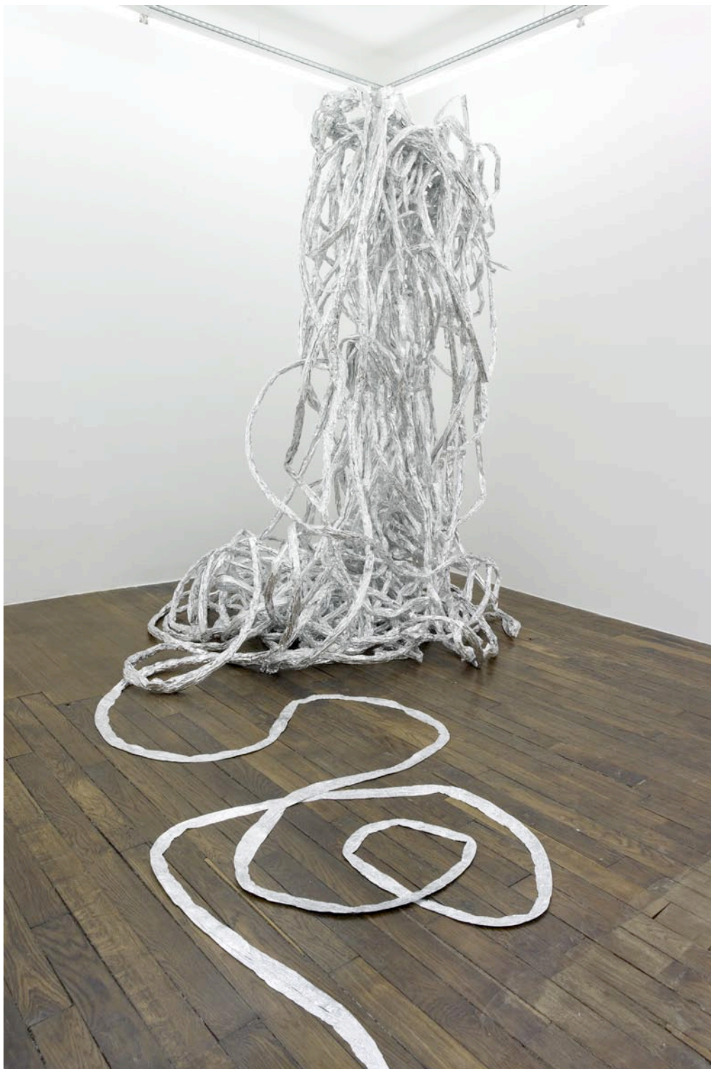
Trace brillante , 2012, papier aluminium, bois, dimensions variables Trace brillante , 2012, aluminum paper, wood, dimensions variable