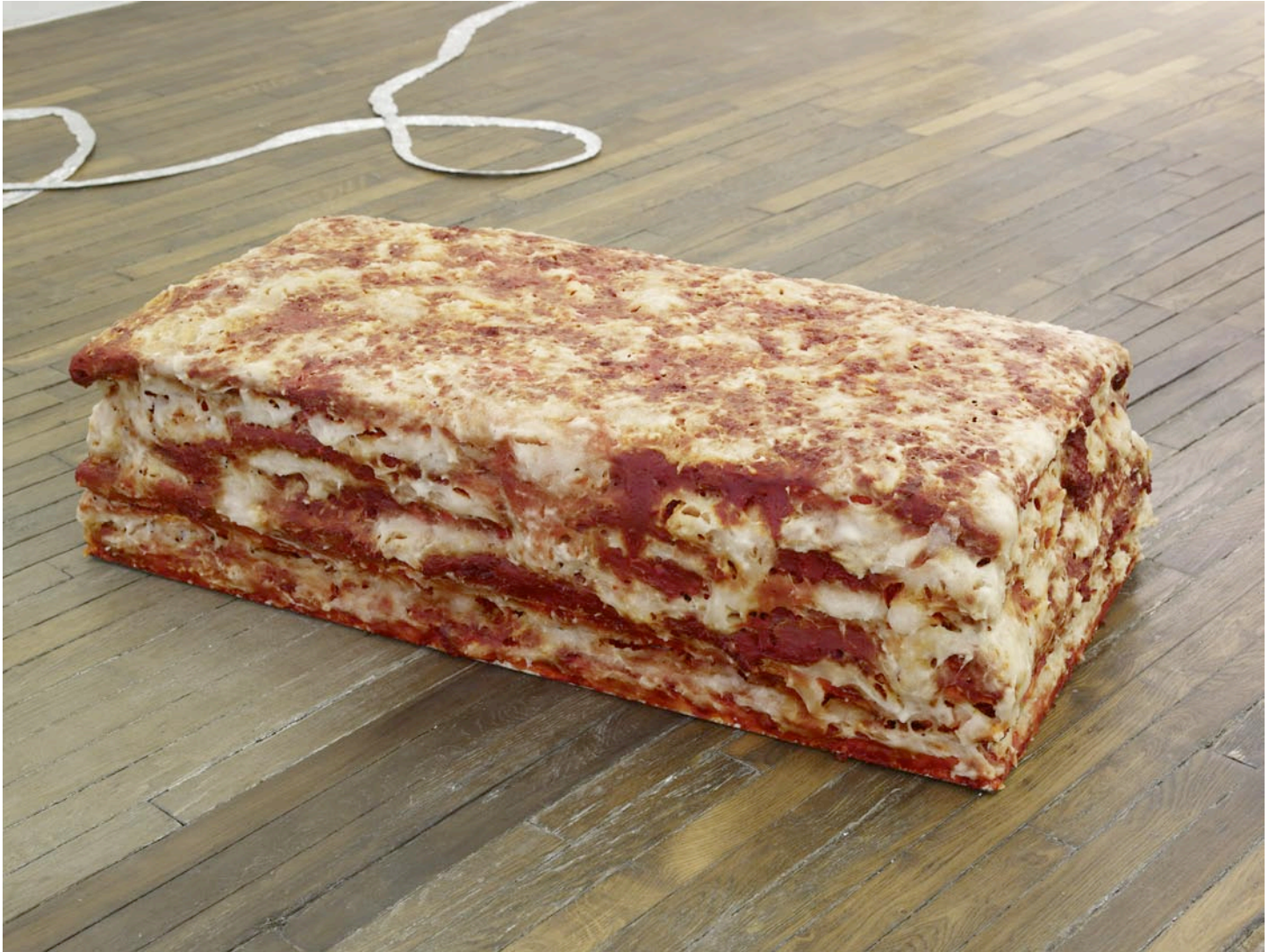
Lasagne al forno, 2012

colle à papier peint, polystyrène extrudé, eau, colorants alimentaires, arômes artificiels saveur pizza fromage fondu, 30 x 117 x 63 cm wallpaper glue, extruded polystyrene, water, food coloring, cheesy pizza artificial flavors, 11 3/4 x 46 1/8 x 24 3/4 in