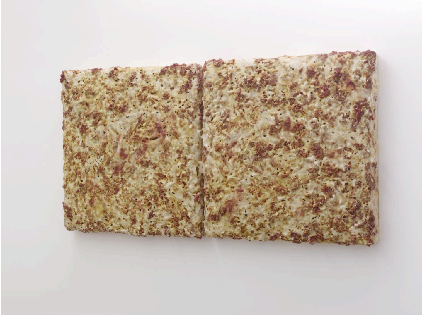
Suprême Cheese, 2012

colle à papier peint, polystyrène extrudé, eau, colorants alimentaires, arômes artificiels saveur pizza fromage fondu, 62 x 124 x 8 cm wallpaper glue, extruded polystyrene, water, food coloring, cheesy pizza artificial flavors, 24,4 x 48,8 x 3,1 in