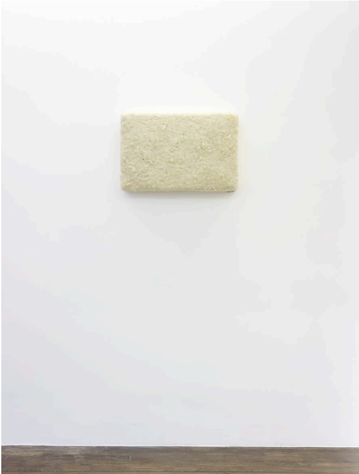
Surprise blanche, 2012

colle à papier peint, polystyrène extrudé, eau, sans colorant alimentaire, sans arôme artificiel, 40 x 60 x 3 cm, collection privée, Paris wallpaper glue, extruded polystyrene, water, without food coloring or artificial flavor, 15,7 x 23,6 x 1,1 in, private collection, Paris