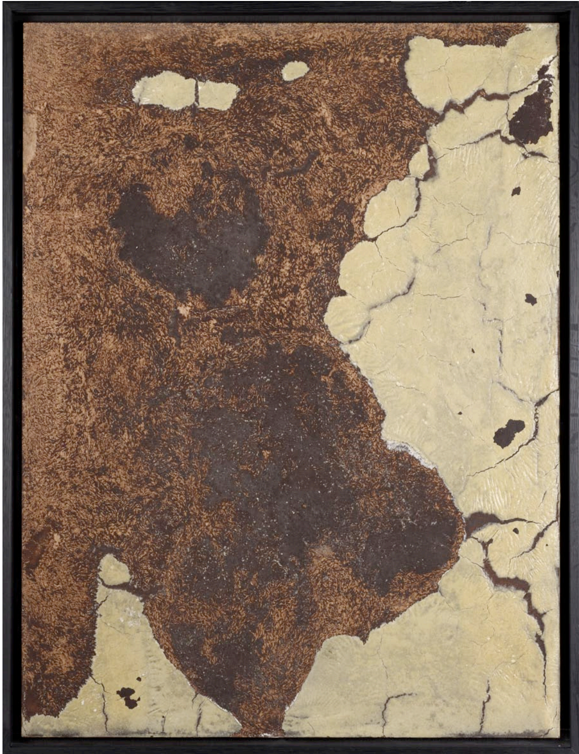
Sans titre 2011, oeufs, crème dessert au chocolat, farine, lait concentré sucré sur bois grignoté par des souris, 80 x 60 cm Sans titre , 2011, eggs, chocolate cream, flour, sweetened condensed milk on wood eaten by mice, 31 1/2 x 23 5/8 in