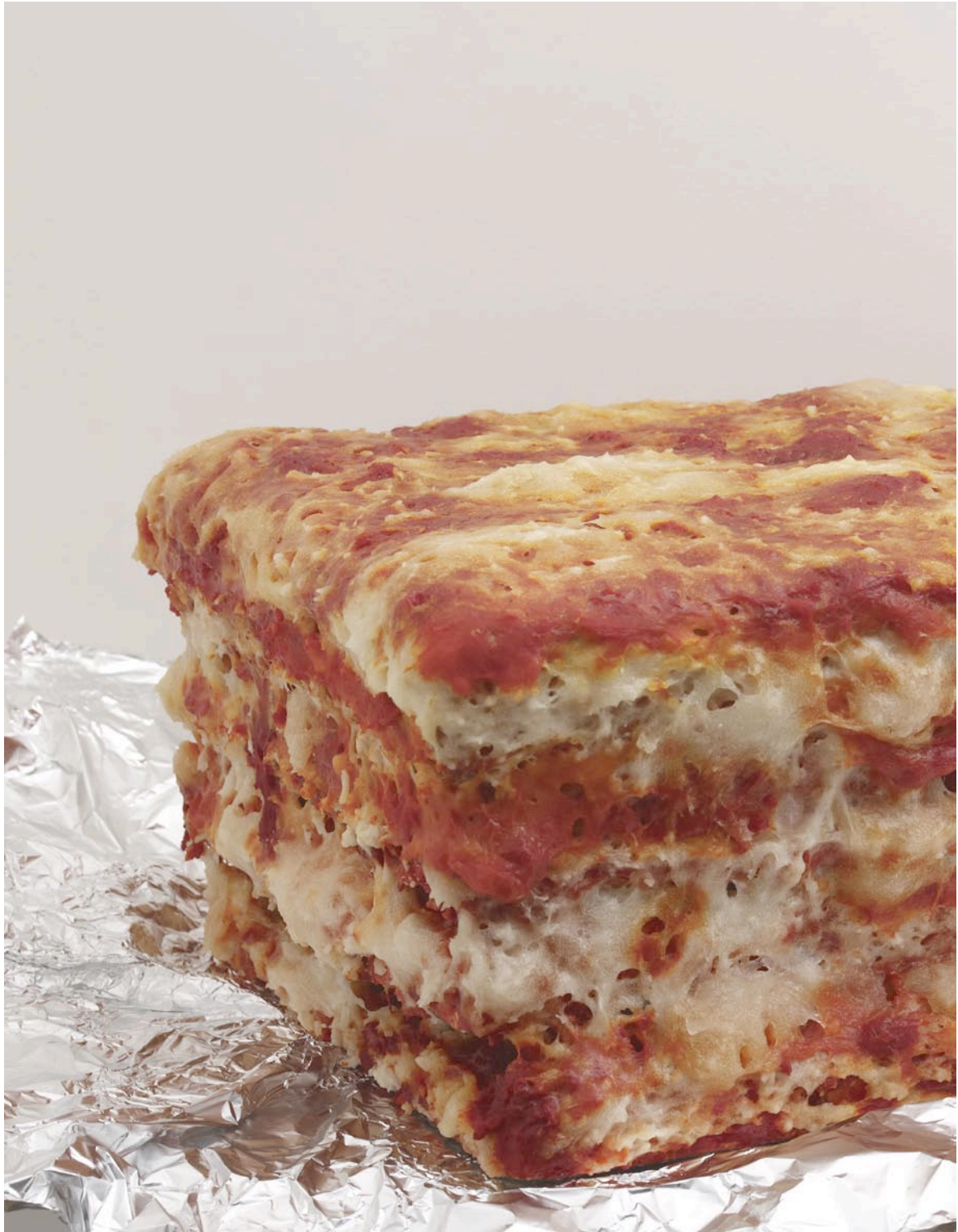
Une part de lasagne al forno, 2012

colle à papier peint, polystyrène extrudé, eau, colorants alimentaires, aluminium, arômes artificiels saveur pizza fromage fondu, 26 x 65 x 43 cm