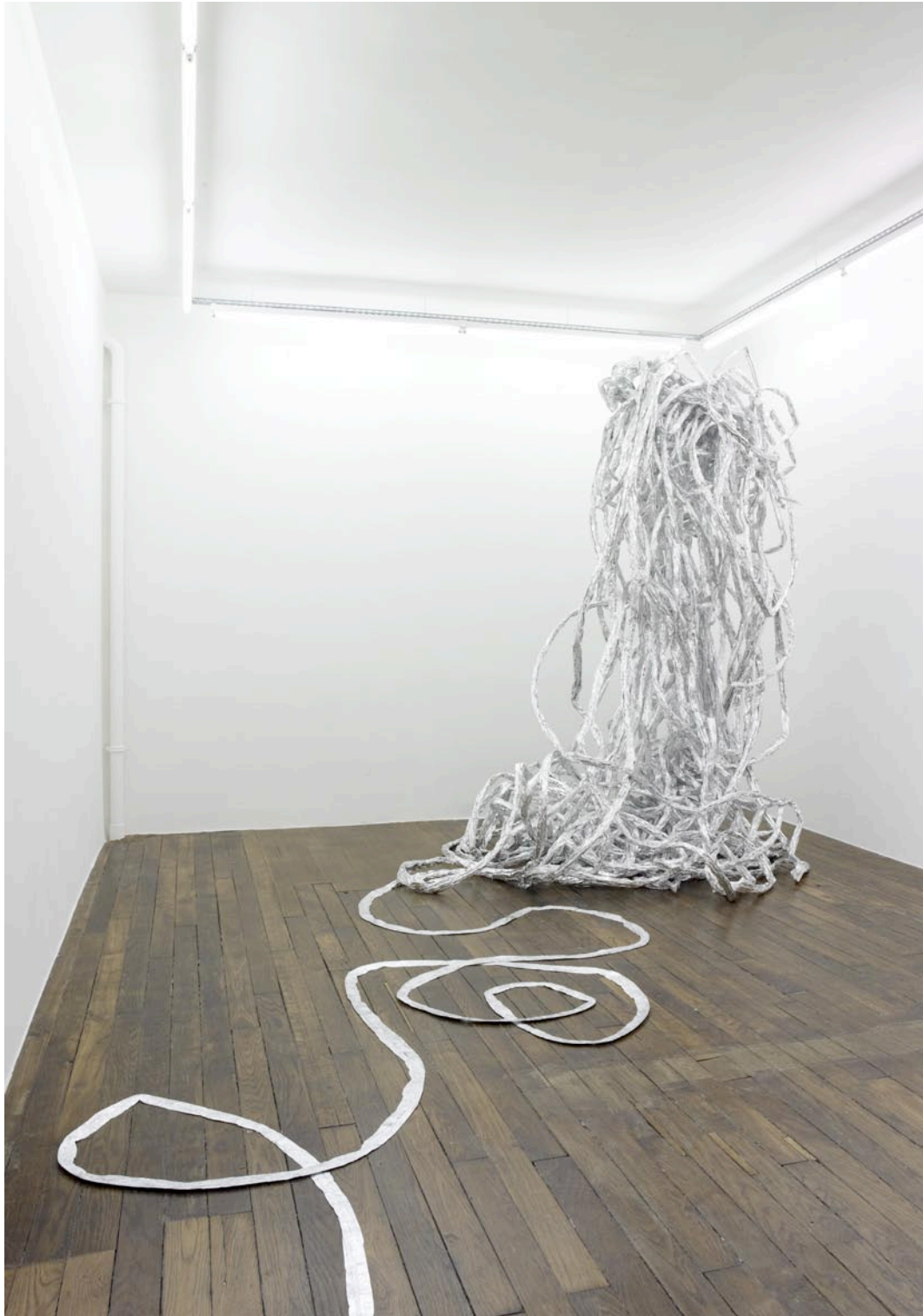
vue d'exposition, Débordement domestique , Art : Concept, Paris, 17 mars - 5 mai 2012 exhibition view, Débordement domestique , Art : Concept, Paris, 17th of March - 5th of May 2012