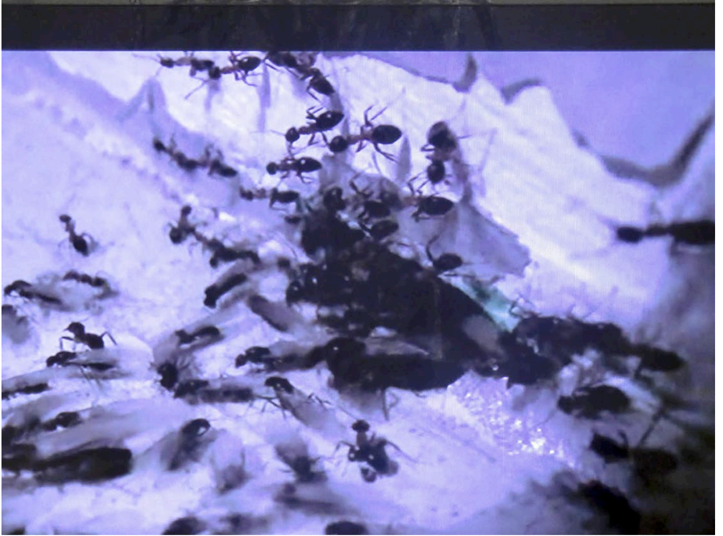
Still alive , 2012, vidéo couleur et sonore, 3 min 22 sec Still alive , 2012, coloured video with sound, 3 min 22 sec