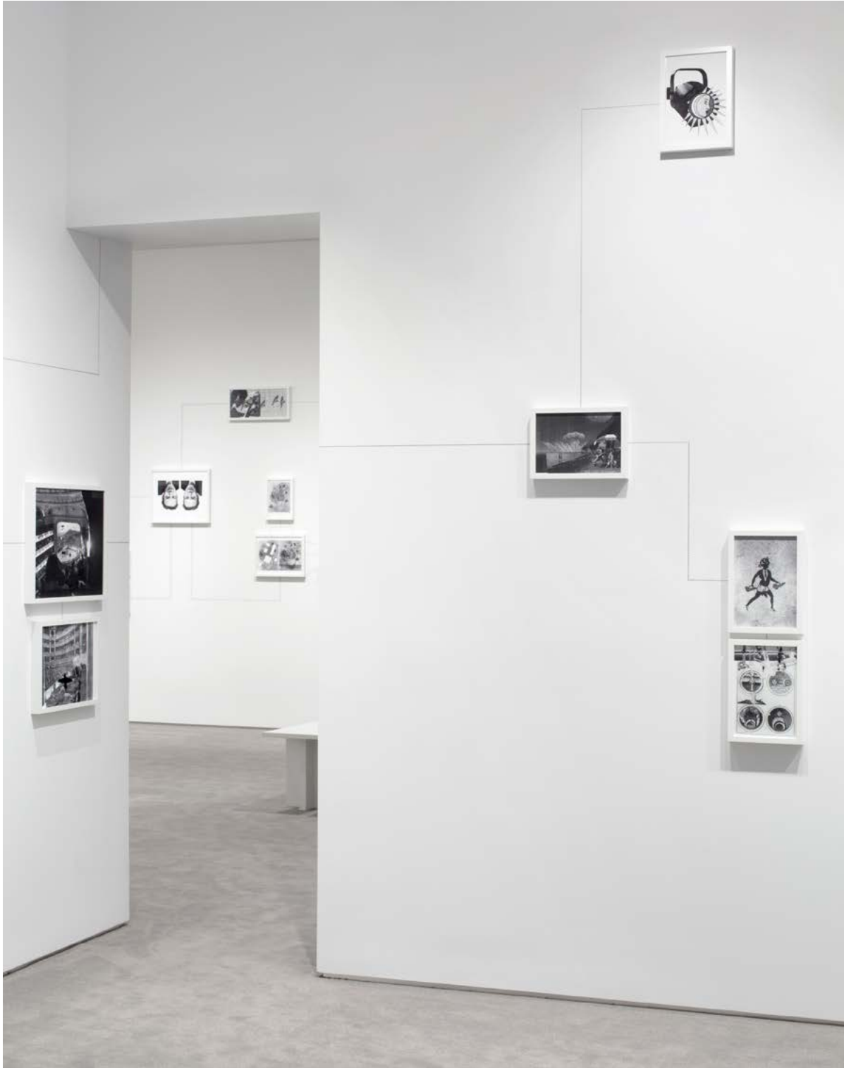
vue d'exposition Assembly Instructions: The Pledge , The Drawing Center, New York, 17 janvier - 13 mars 2013 exhibition view Assembly Instructions: The Pledge , The Drawing Center, New York, January 17th - March 13th 2013