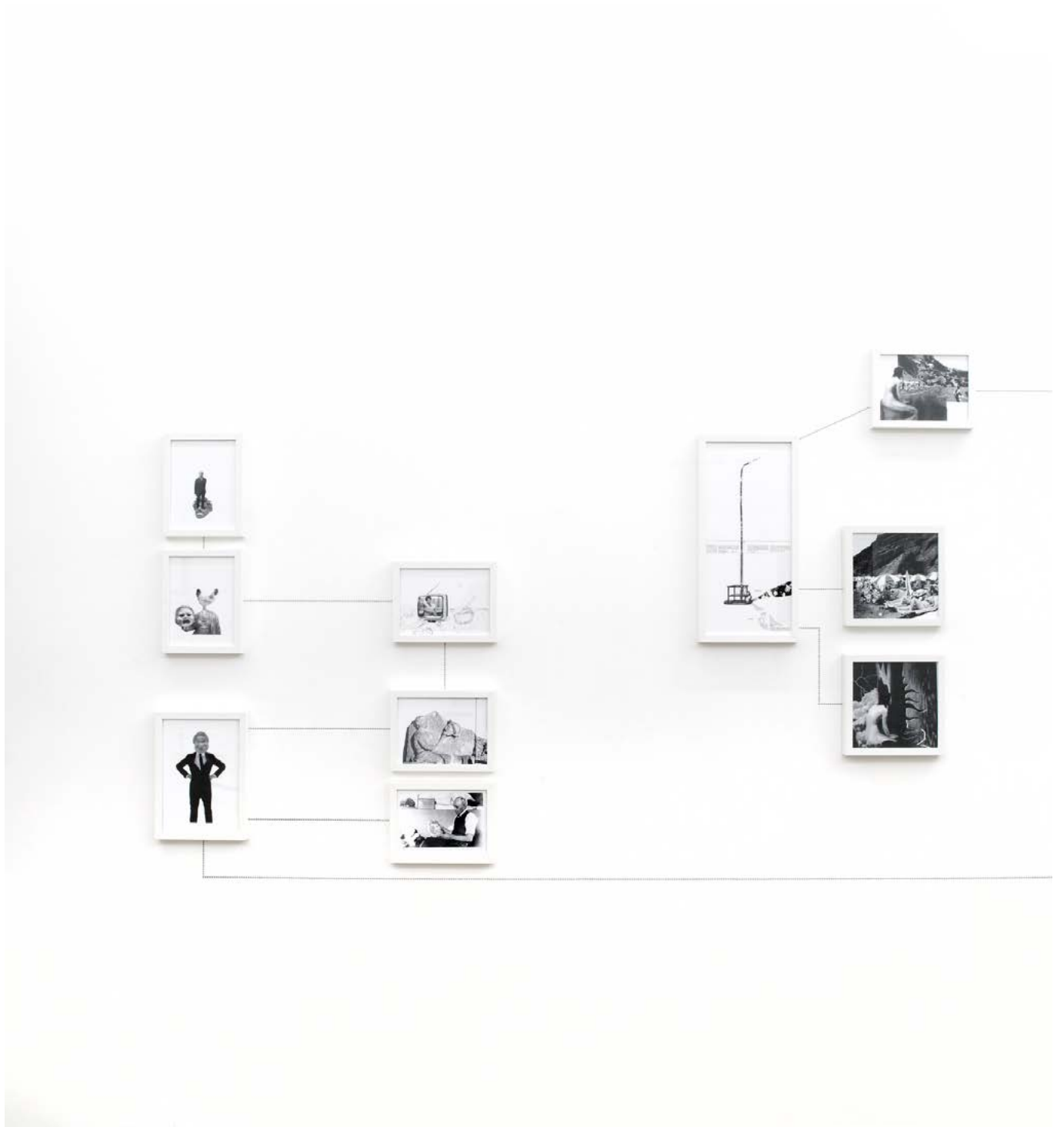
Assembly Instruction (The Pledge: Alfredo Arias) , 2011, impression jet d'encre encadrés, crayon, dimensions variables, édition de 3 + 2ea Assembly Instruction (The Pledge: Alfredo Arias) , 2011, inkjet ultrachrome archival print, pencil, dimensions variable, edition of 3 + 2ap