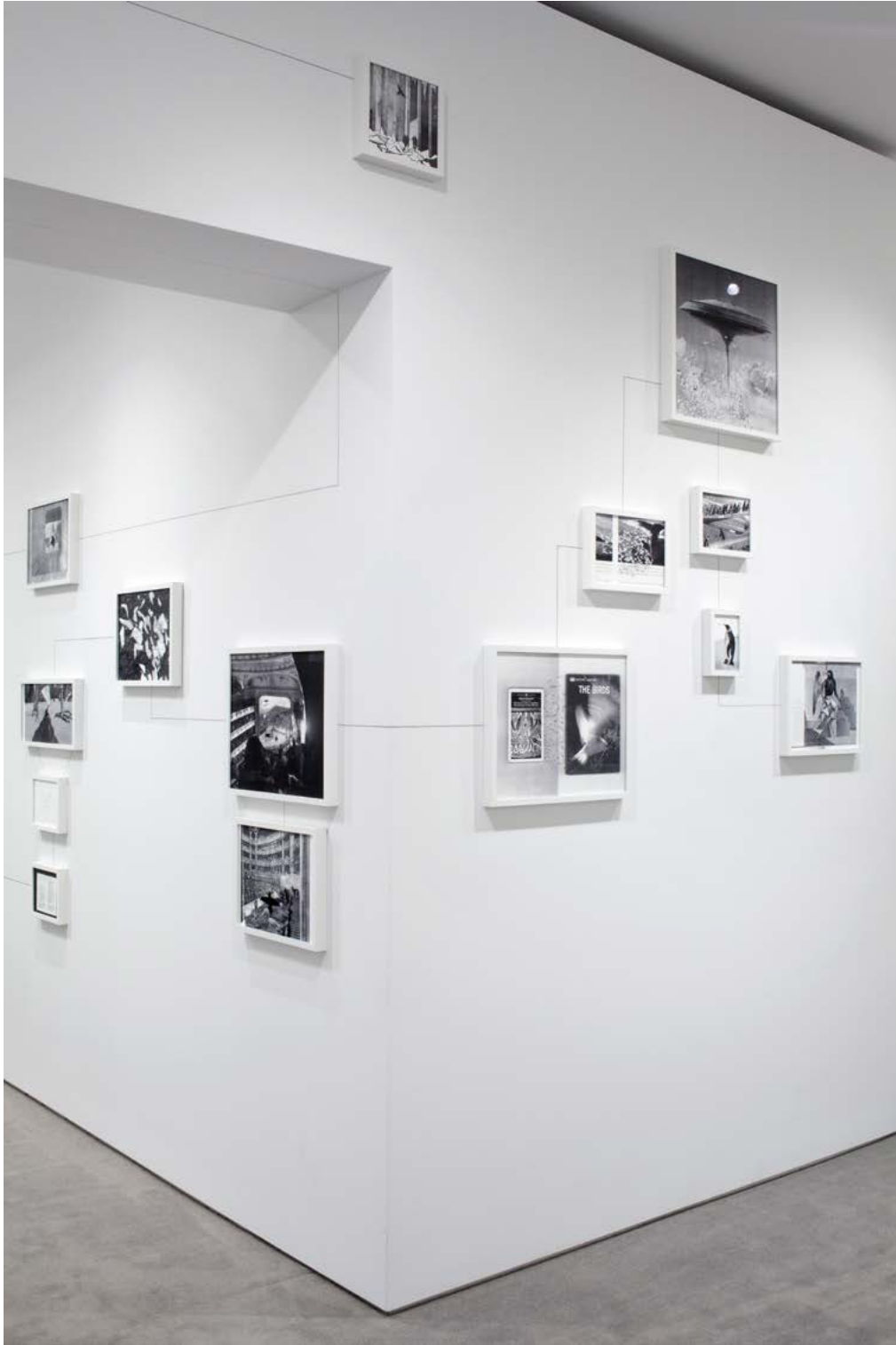
vue d'exposition Assembly Instructions: The Pledge , The Drawing Center, New York, 17 janvier - 13 mars 2013 exhibition view Assembly Instructions: The Pledge , The Drawing Center, New York, January 17th - March 13th 2013