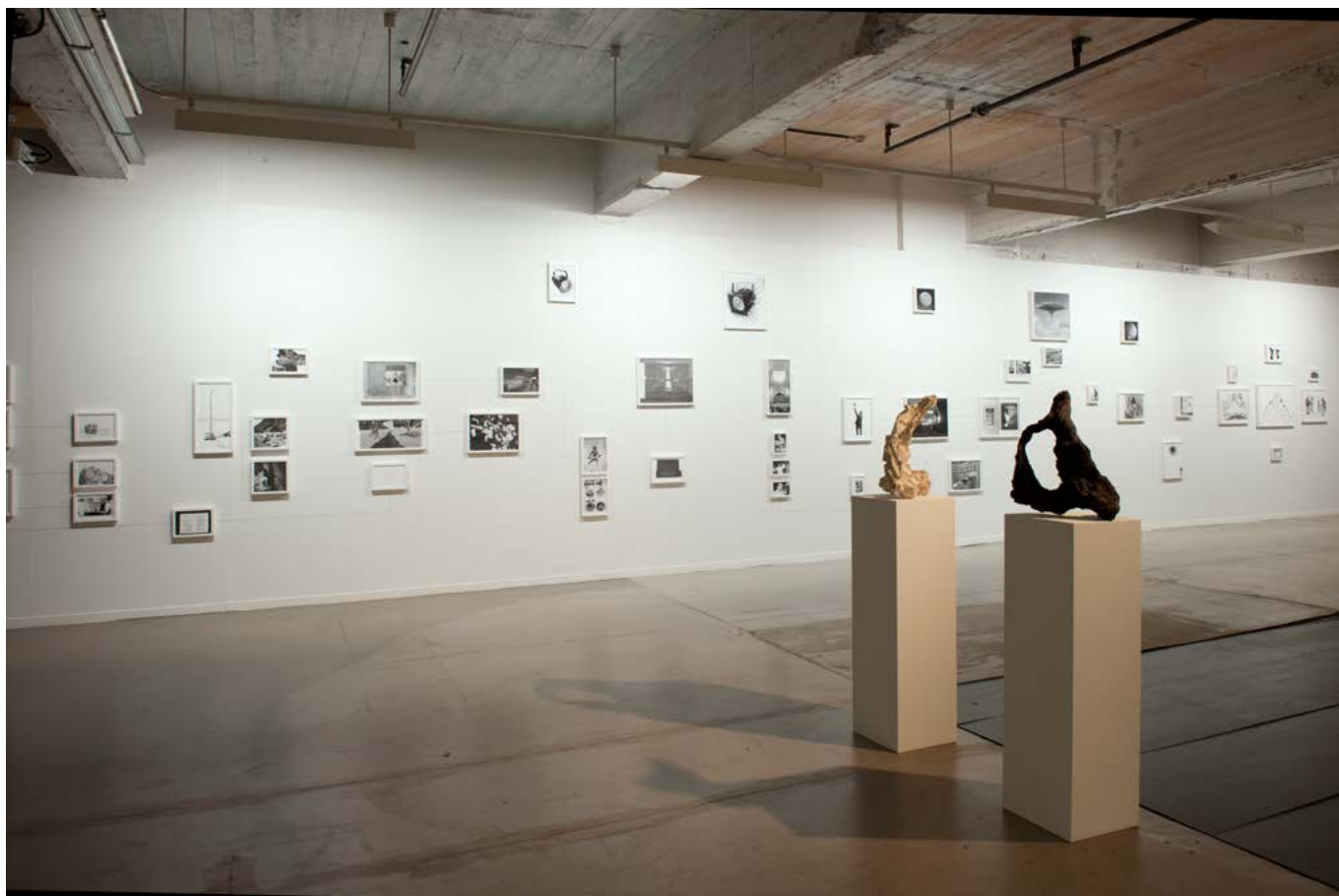
vue d'exposition L'Origine des choses , Collection du Centre National des Arts Plastiques, La CENTRALE, Bruxelles, du 7 mars au 9 juin 2013 exhibition view L'Origine des choses , Collection du Centre National des Arts Plastiques, La CENTRALE, Bruxelles, March 7th - June 9th 2013