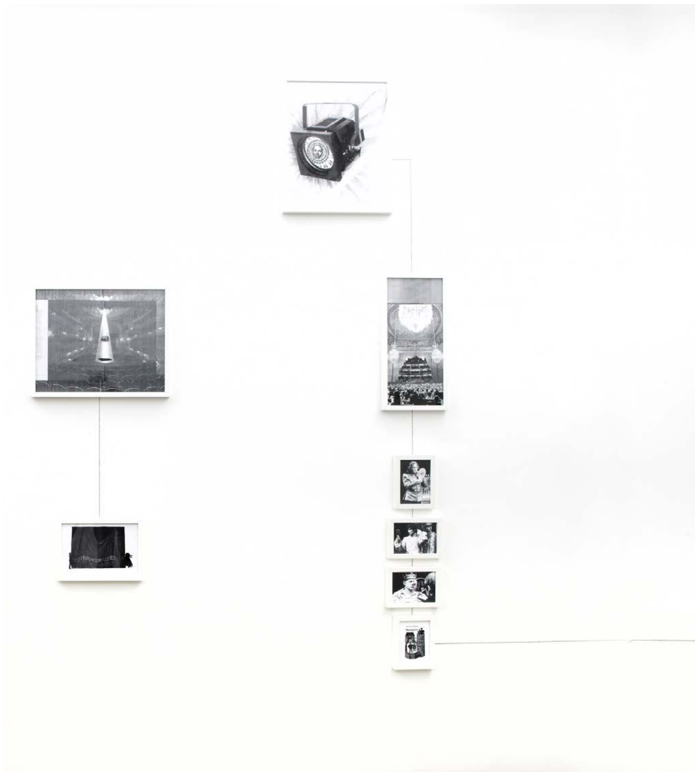
Assembly Instruction (The Pledge: Alfredo Arias) , 2011, impression jet d'encre encadrés, crayon, dimensions variables, édition de 3 + 2ea Assembly Instruction (The Pledge: Alfredo Arias) , 2011, inkjet ultrachrome archival print, pencil, dimensions variable, edition of 3 + 2ap