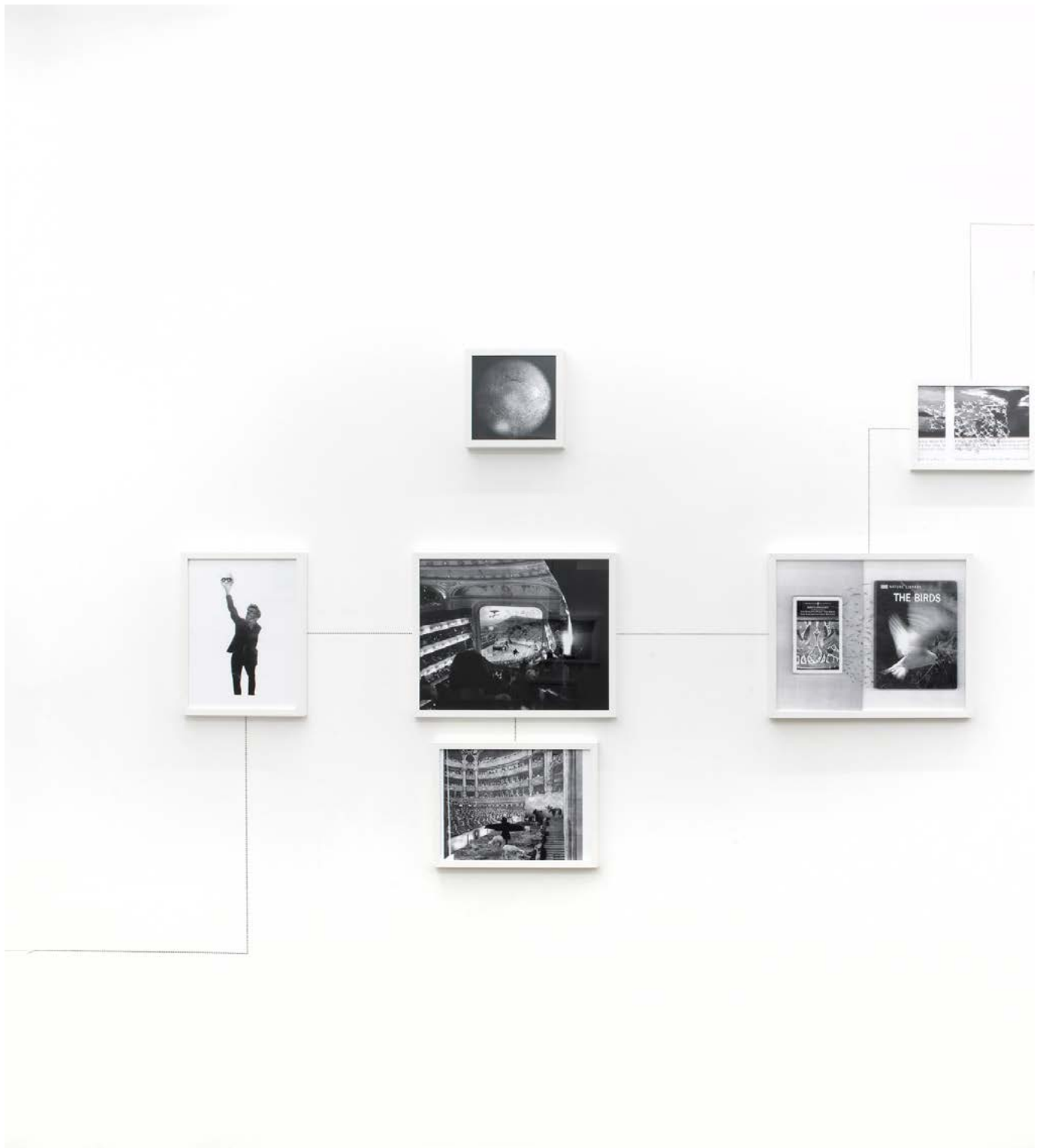
Assembly Instruction (The Pledge: Alfredo Arias) , 2011, impression jet d'encre encadrés, crayon, dimensions variables, édition de 3 + 2ea Assembly Instruction (The Pledge: Alfredo Arias) , 2011, inkjet ultrachrome archival print, pencil, dimensions variable, edition of 3 + 2ap