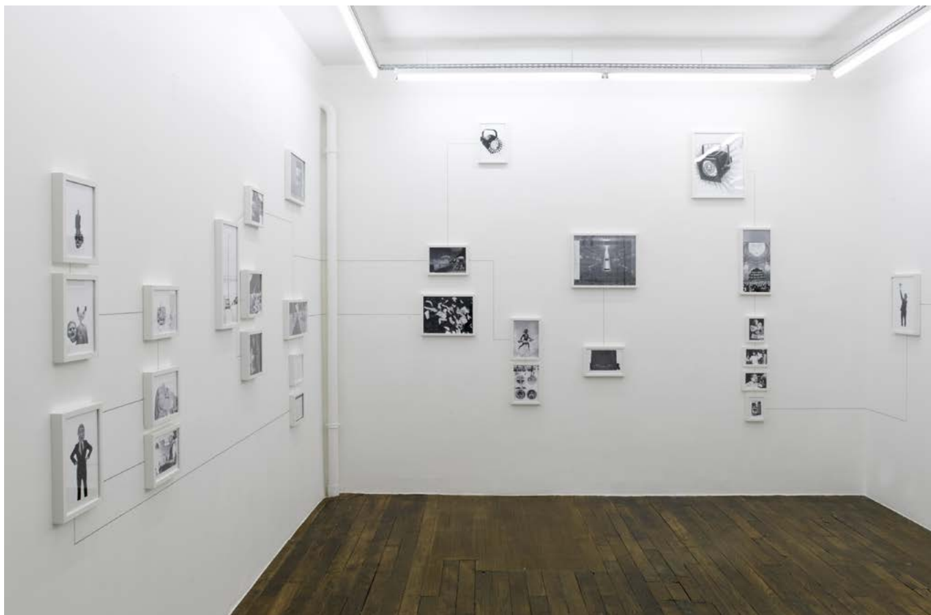
vue d'exposition Assembly Instruction: The Pledge , Art:Concept, Paris, 10 Septembre - 12 Novembre 2011 exhibition view Assembly Instruction: The Pledge , Art:Concept, Paris, September 10th - November 12th 2011