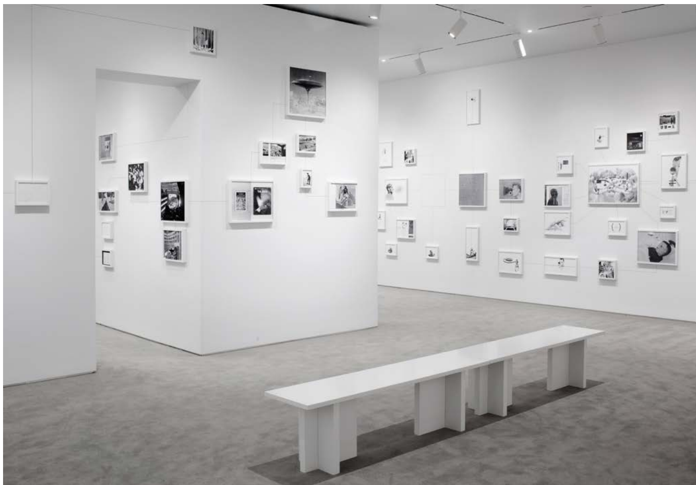
vue d'exposition Assembly Instructions: The Pledge , The Drawing Center, New York, 17 janvier - 13 mars 2013 exhibition view Assembly Instructions: The Pledge , The Drawing Center, New York, January 17th - March 13th 2013