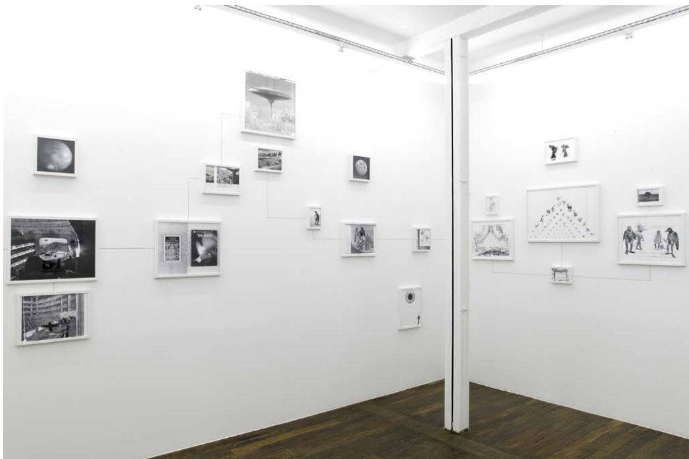
vue d'exposition Assembly Instruction: The Pledge , Art:Concept, Paris, 10 Septembre - 12 Novembre 2011 exhibition view Assembly Instruction: The Pledge , Art:Concept, Paris, September 10th - November 12th 2011