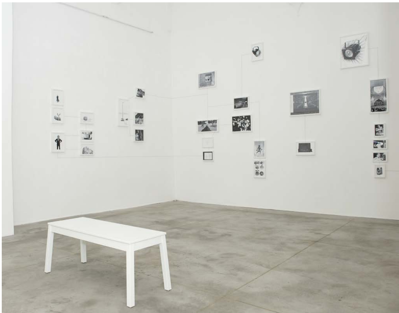
vue d'exposition Assembly Instructions: The Pledge , Monitor, Rome, Italie, 17 novembre 2011 - 4 février 2012 exhibition view Assembly Instructions: The Pledge , Gallery, Roma, Italy, November 17th 2011 - February 4th 2012