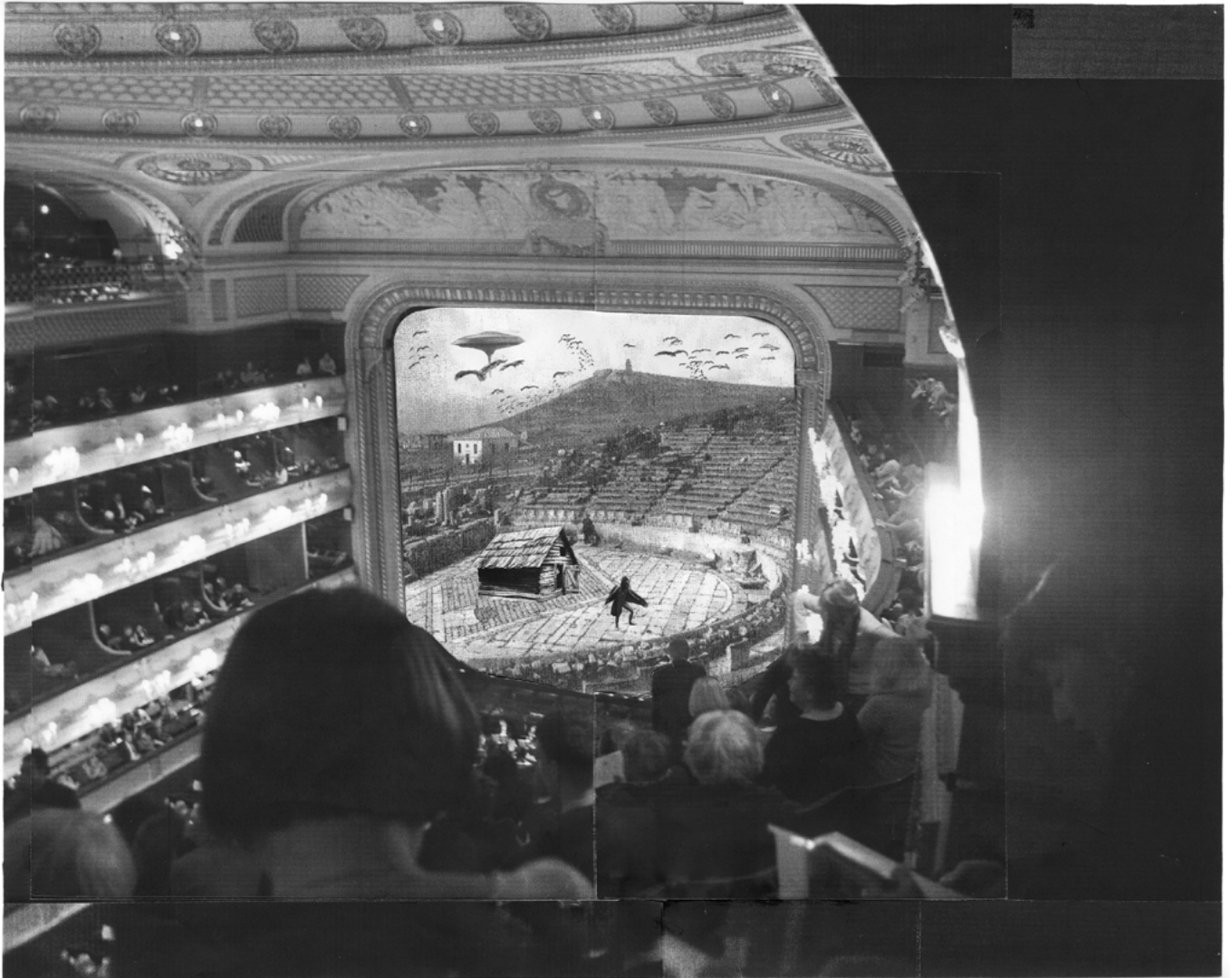
Assembly Instruction (The Pledge: Alfredo Arias), 2011 (détail) Assembly Instruction (The Pledge: Alfredo Arias), 2011 (detail)