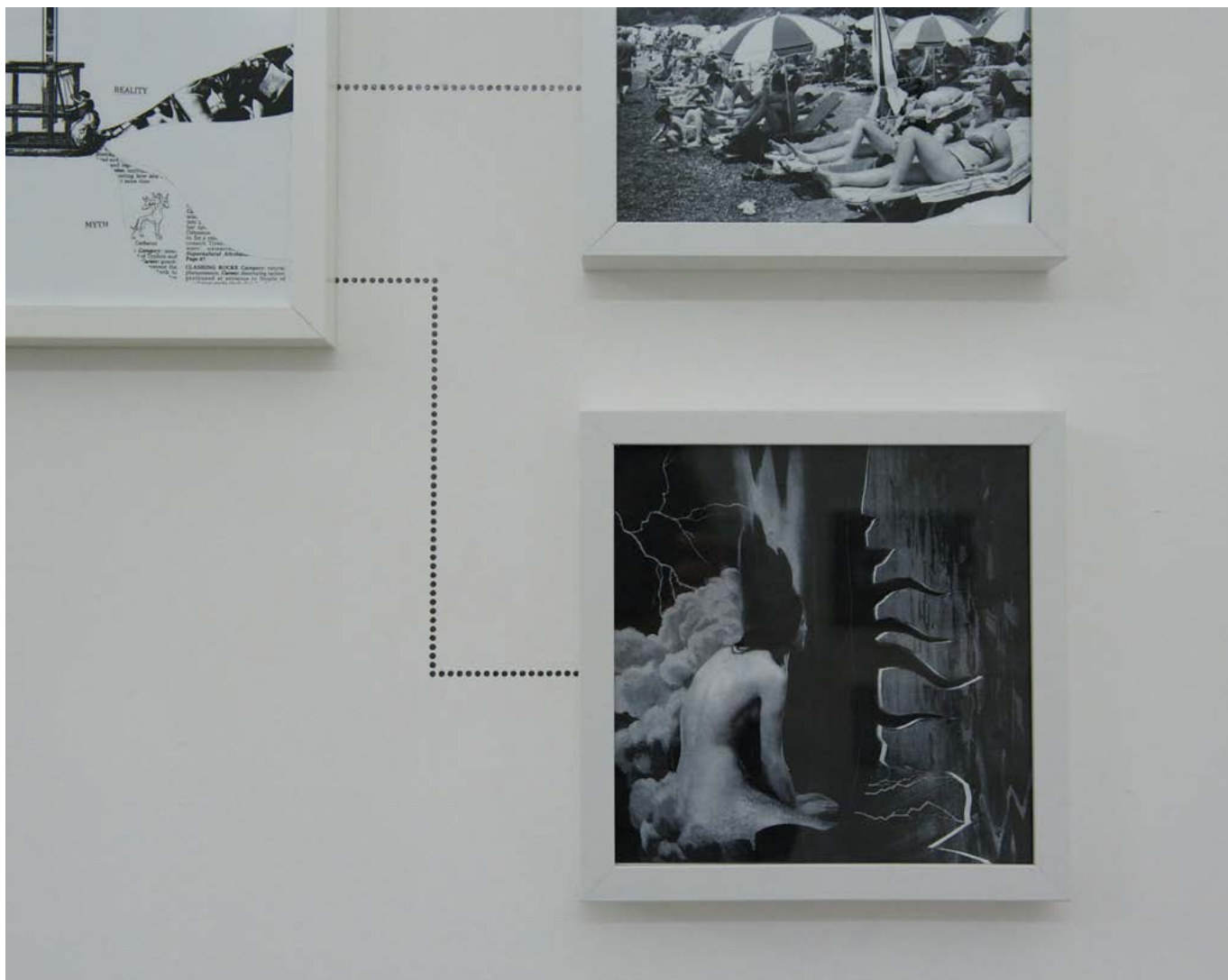
Assembly Instruction (The Pledge: Alfredo Arias) , 2011, impression jet d'encre encadrés, crayon, dimensions variables, édition de 3 + 2ea Assembly Instruction (The Pledge: Alfredo Arias) , 2011, inkjet ultrachrome archival print, pencil, dimensions variable, edition of 3 + 2ap