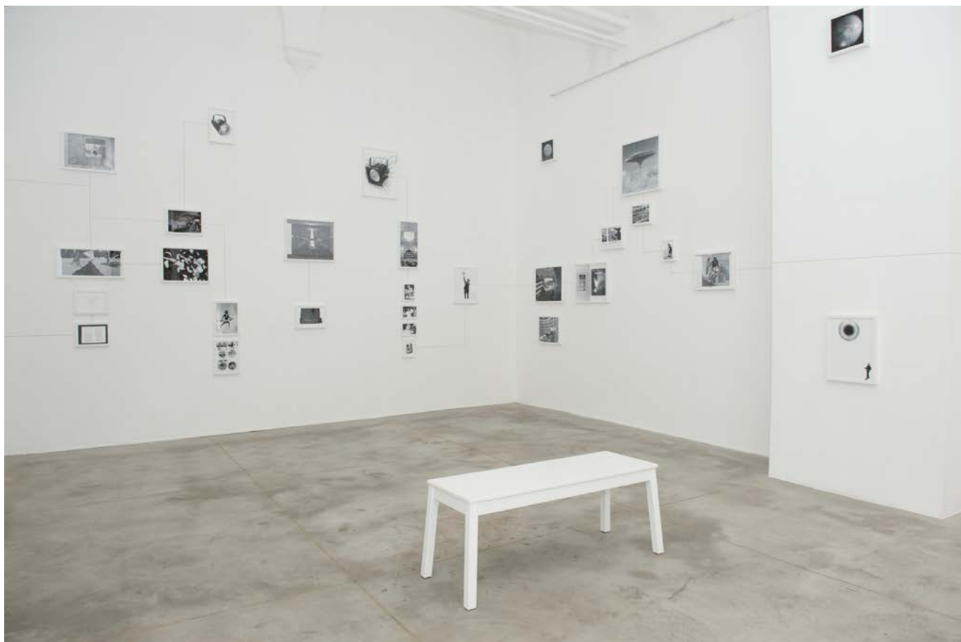
vue d'exposition Assembly Instructions: The Pledge , Monitor, Rome, Italie, 17 novembre 2011 - 4 février 2012 exhibition view Assembly Instructions: The Pledge , Gallery, Roma, Italy, November 17th 2011 - February 4th 2012