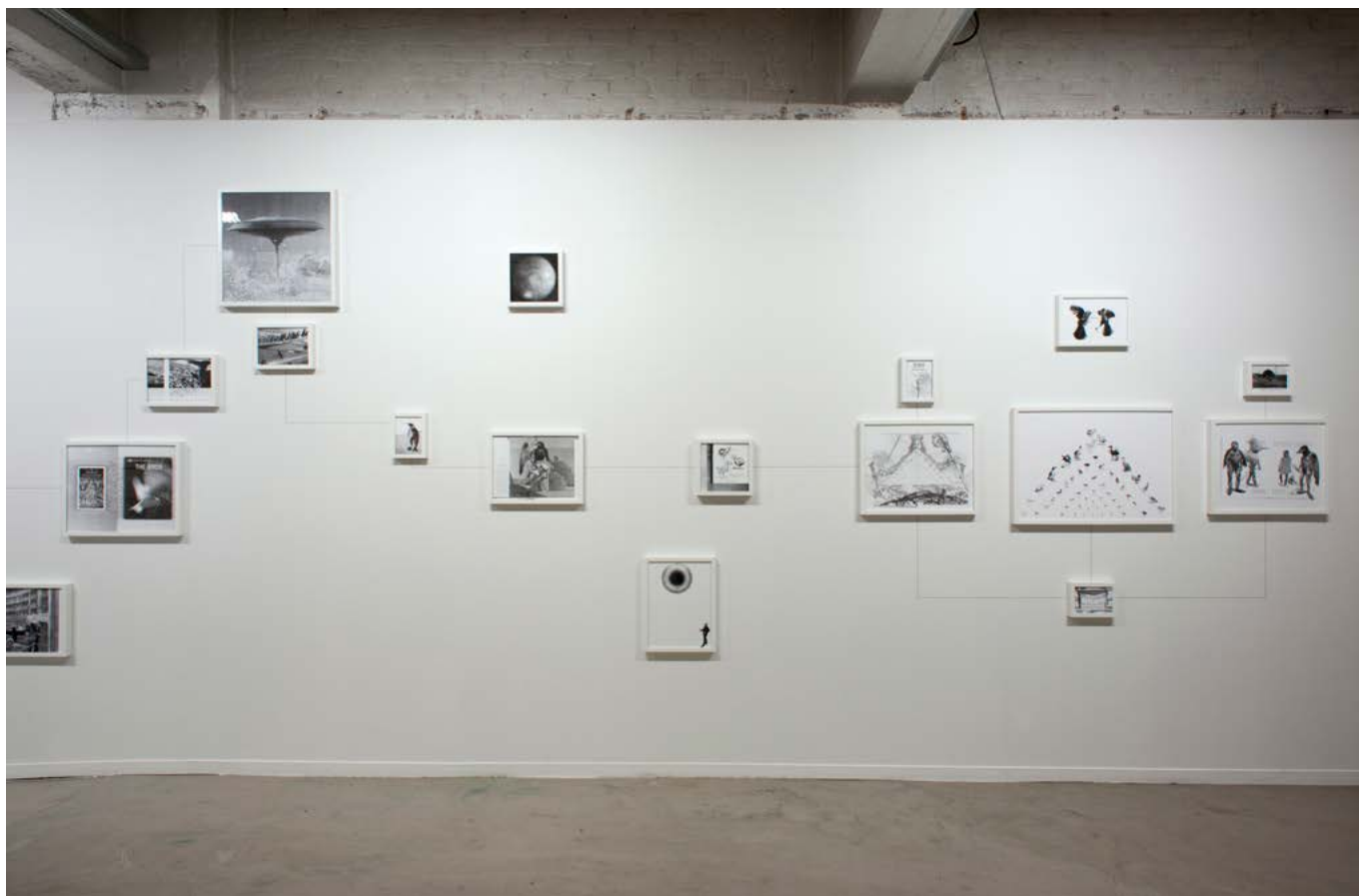
vue d'exposition L'Origine des choses , Collection du Centre National des Arts Plastiques, La CENTRALE, Bruxelles, du 7 mars au 9 juin 2013 exhibition view L'Origine des choses , Collection du Centre National des Arts Plastiques, La CENTRALE, Bruxelles, March 7th - June 9th 2013