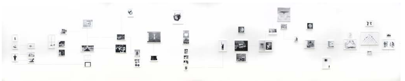
Assembly Instruction (The Pledge: Alfredo Arias) , 2011, impression jet d'encre encadrés, crayon, dimensions variables, édition de 3 + 2ea Assembly Instruction (The Pledge: Alfredo Arias) , 2011, inkjet ultrachrome archival print, pencil, dimensions variable, edition of 3 + 2ap