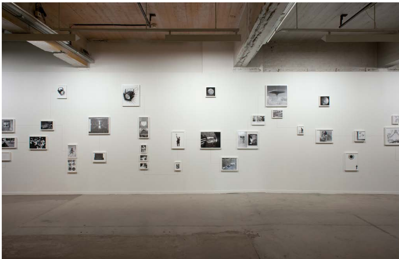
vue d'exposition L'Origine des choses , Collection du Centre National des Arts Plastiques, La CENTRALE, Bruxelles, du 7 mars au 9 juin 2013 exhibition view L'Origine des choses , Collection du Centre National des Arts Plastiques, La CENTRALE, Bruxelles, March 7th - June 9th 2013