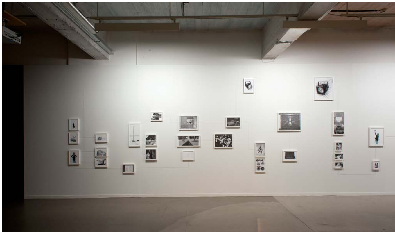
vue d'exposition L'Origine des choses , Collection du Centre National des Arts Plastiques, La CENTRALE, Bruxelles, du 7 mars au 9 juin 2013 exhibition view L'Origine des choses , Collection du Centre National des Arts Plastiques, La CENTRALE, Bruxelles, March 7th - June 9th 2013