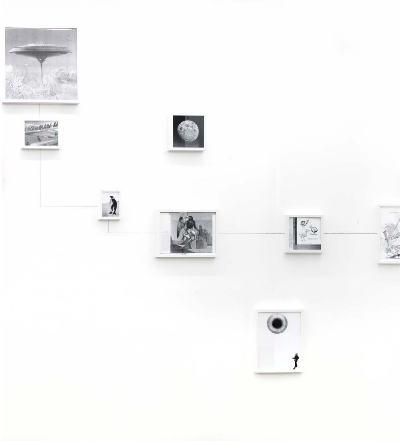
Assembly Instruction (The Pledge: Alfredo Arias) , 2011, impression jet d'encre encadrés, crayon, dimensions variables, édition de 3 + 2ea Assembly Instruction (The Pledge: Alfredo Arias) , 2011, inkjet ultrachrome archival print, pencil, dimensions variable, edition of 3 + 2ap