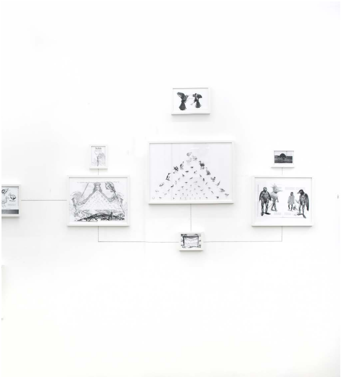
Assembly Instruction (The Pledge: Alfredo Arias) , 2011, impression jet d'encre encadrés, crayon, dimensions variables, édition de 3 + 2ea Assembly Instruction (The Pledge: Alfredo Arias) , 2011, inkjet ultrachrome archival print, pencil, dimensions variable, edition of 3 + 2ap